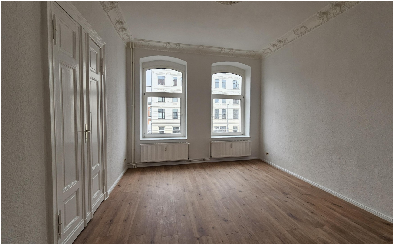
Wohnzimmer 2 (geschlossen)