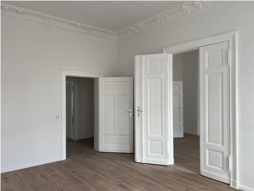
Wohnzimmer (Blick zur Tür)