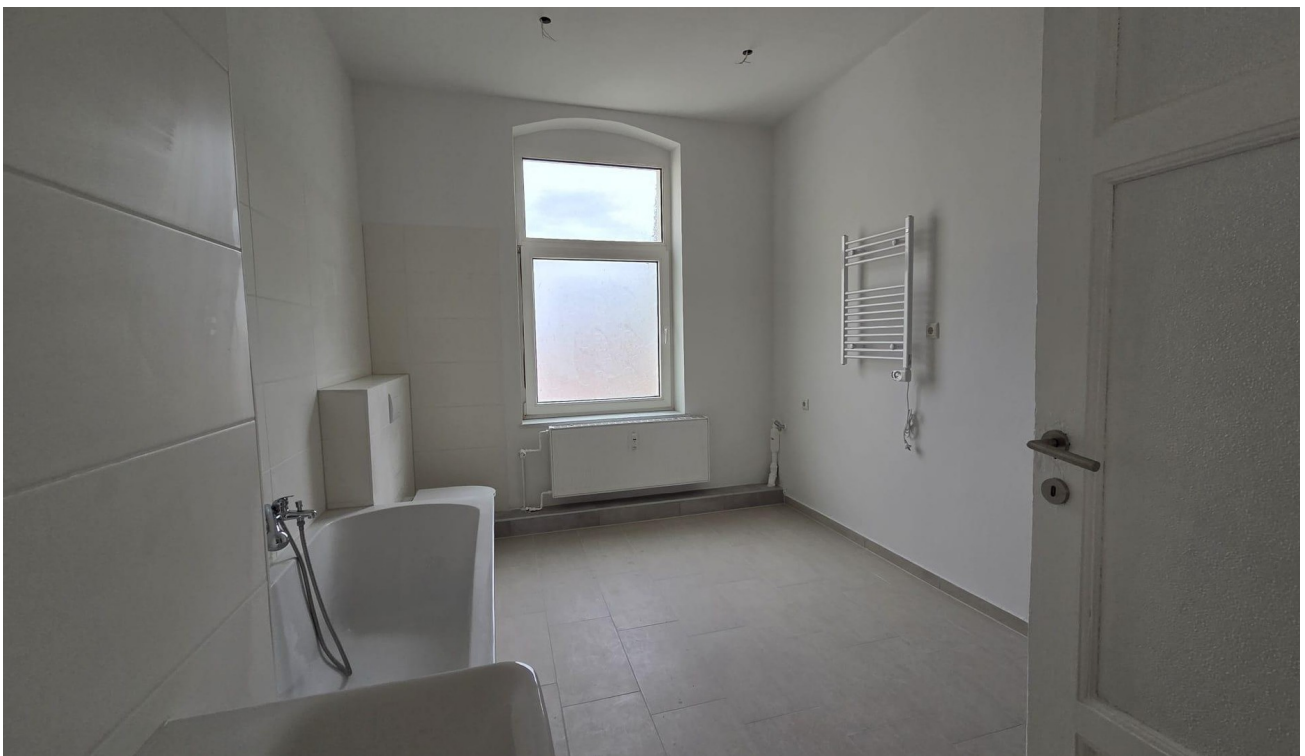
Blick ins Bad