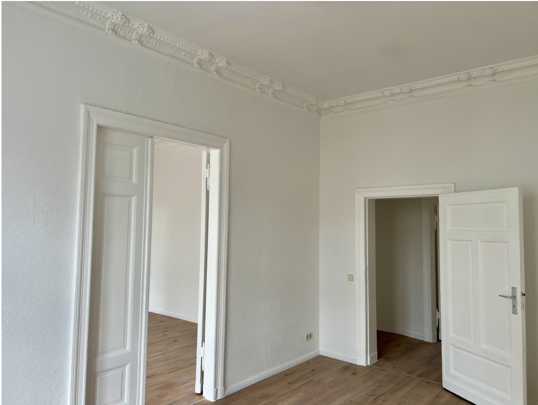
Arbeitszimmer 2 mit Stuck