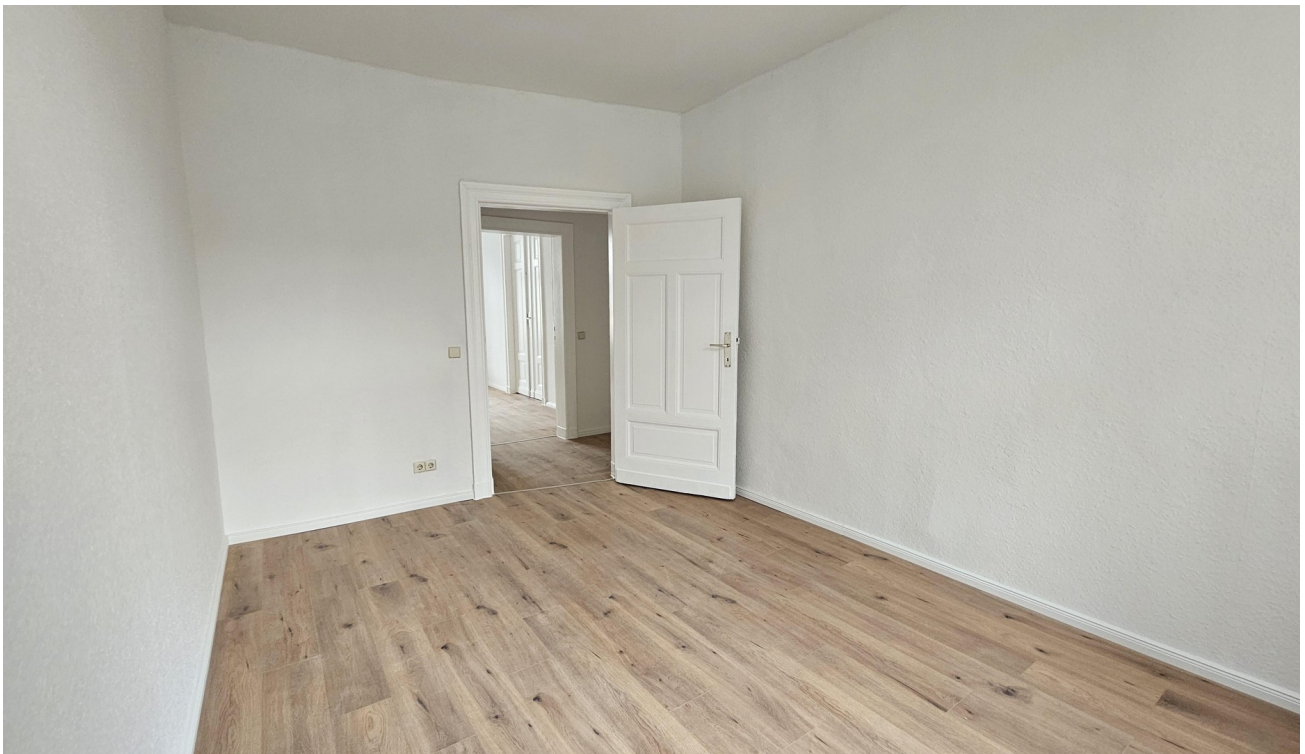
kleines Zimmer zum Hof