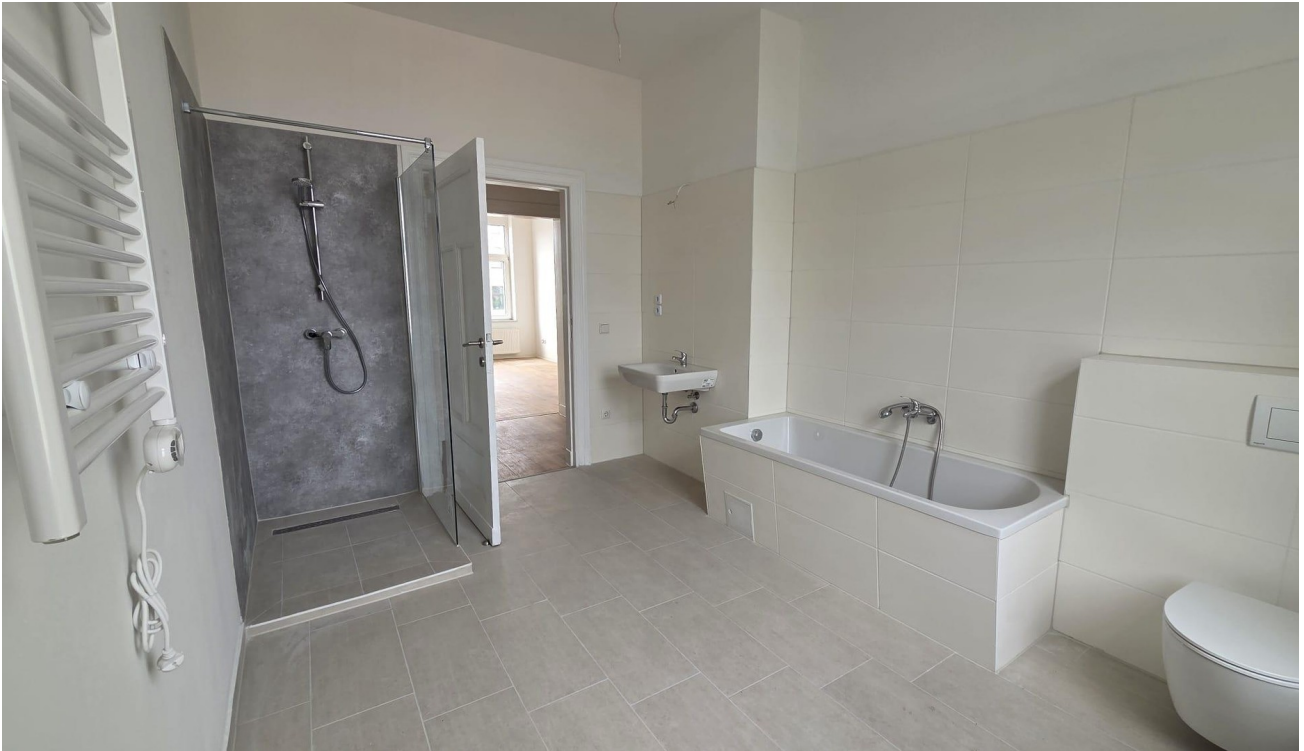
Wannen- und Duschbad