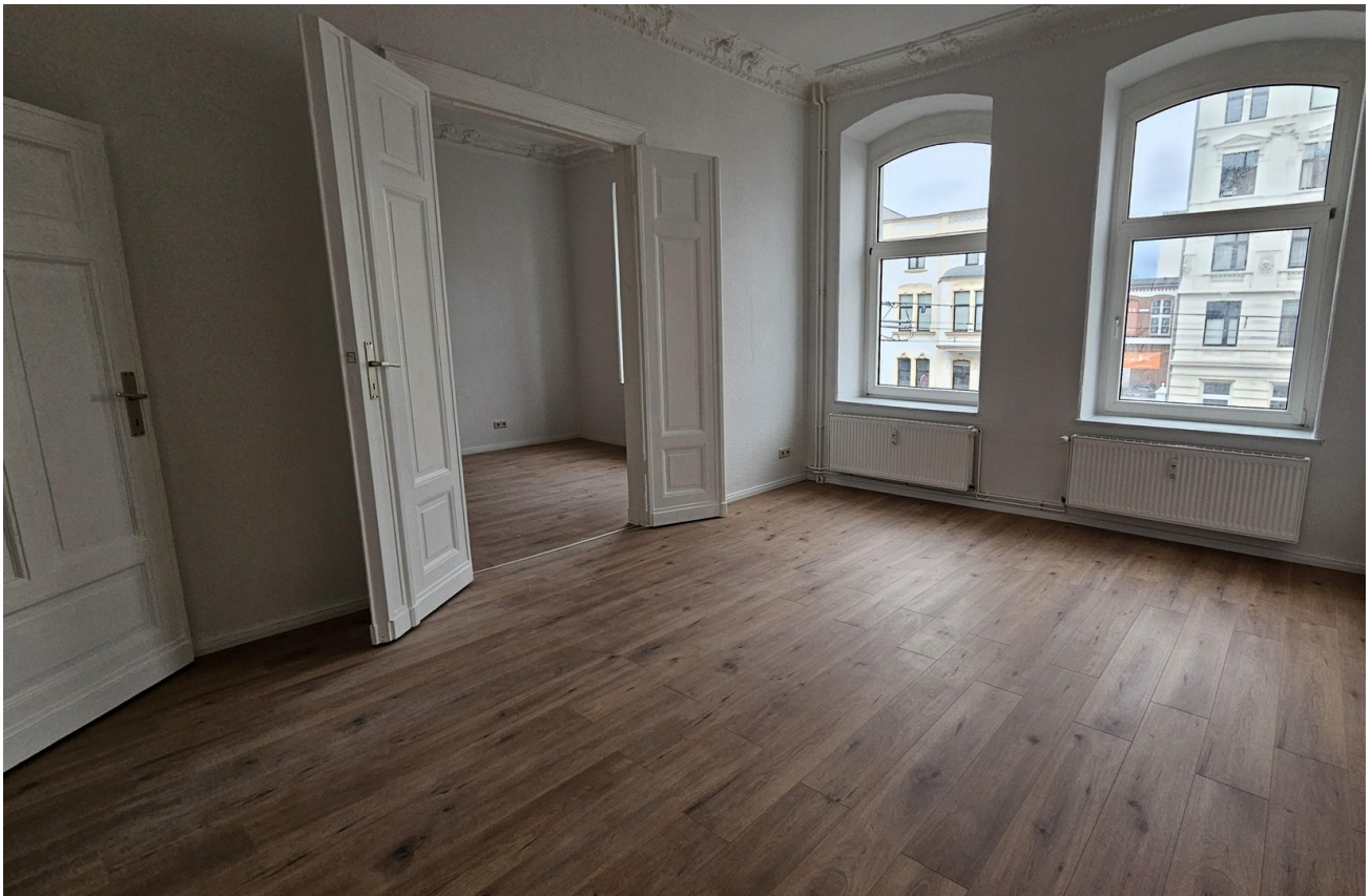
Wohnzimmer 1 (offen)