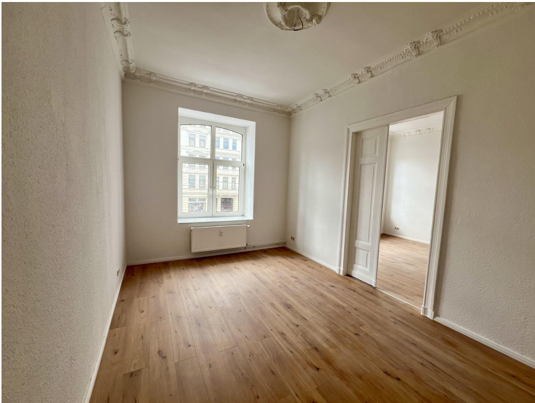
Arbeitszimmer 2 mit Stuck