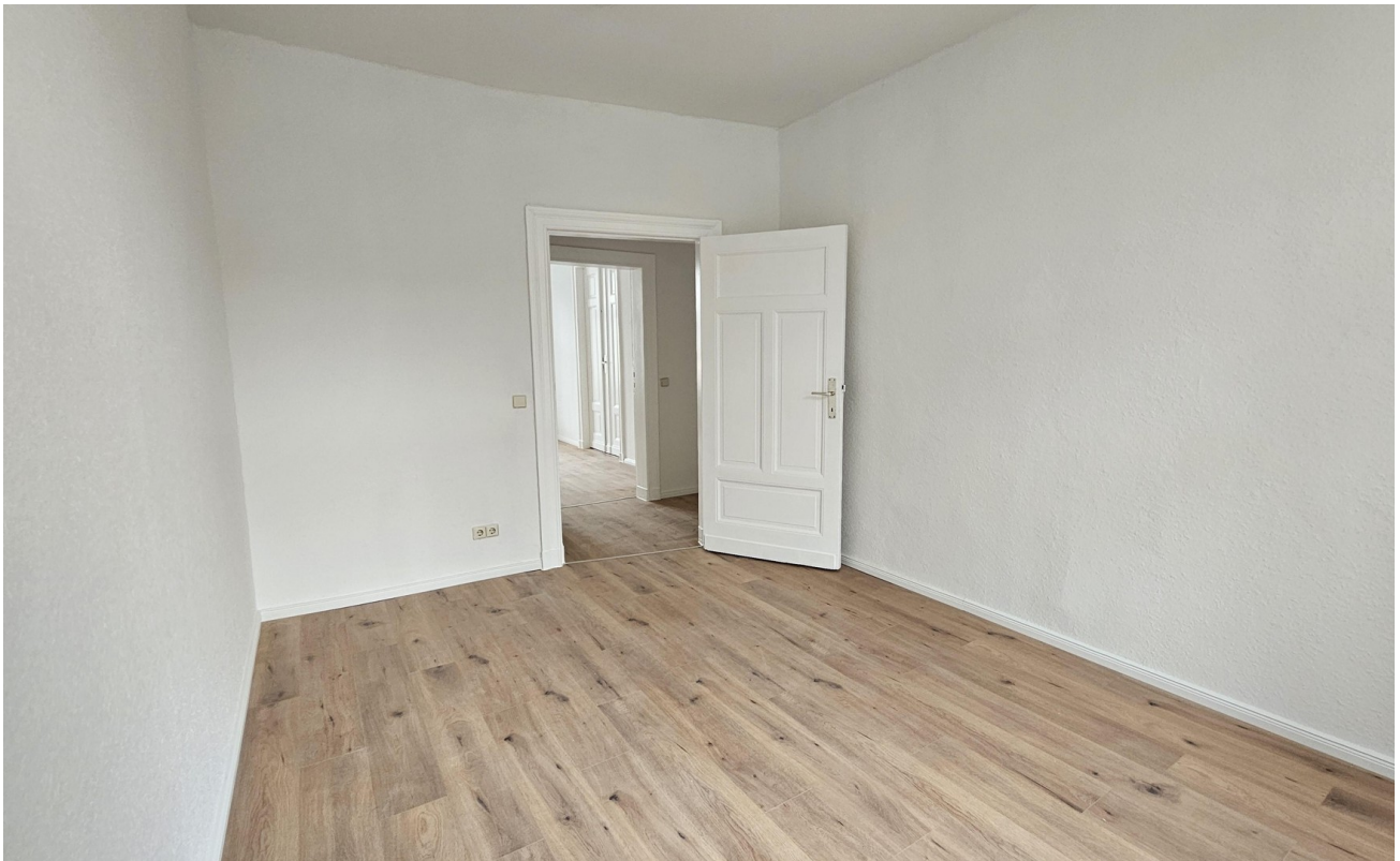
kleines Zimmer zum Hof