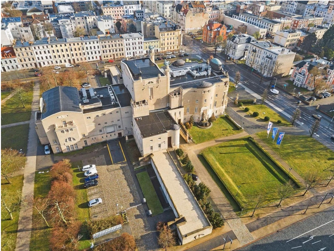
Lage des Gebäudes