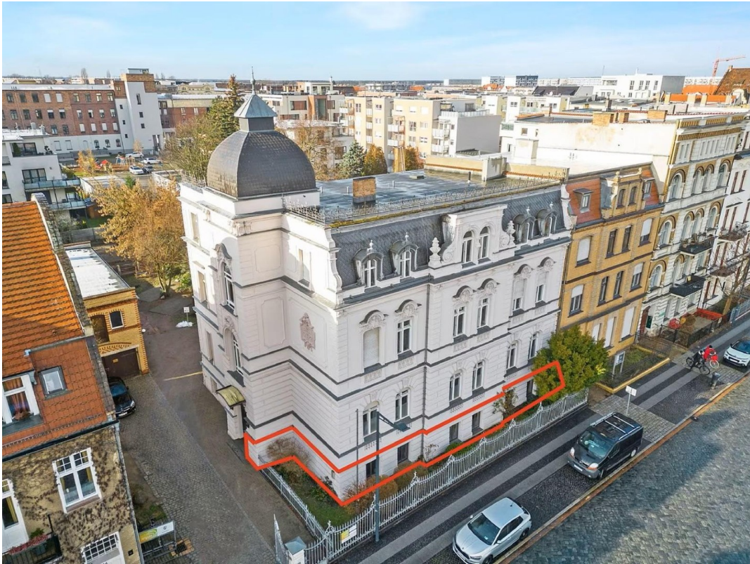
Lage der Räume