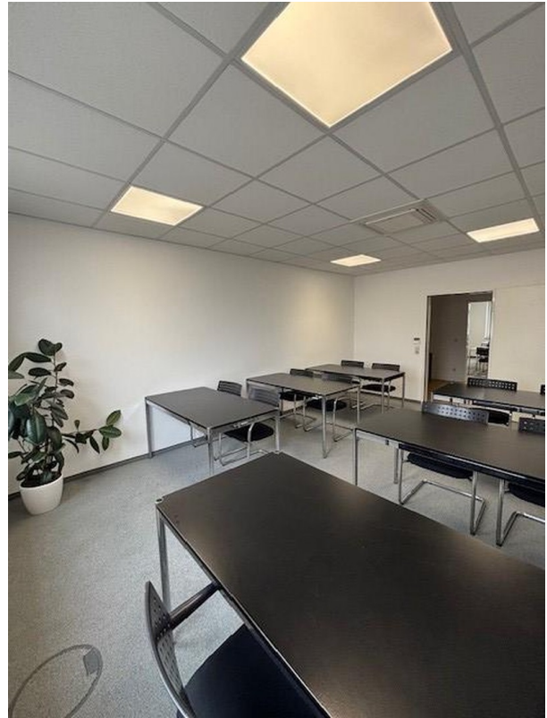
Konferenz-/Schulungsraum 22m 2