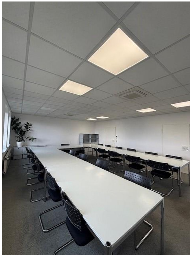
Konferenz-/Schulungsraum 44m 2