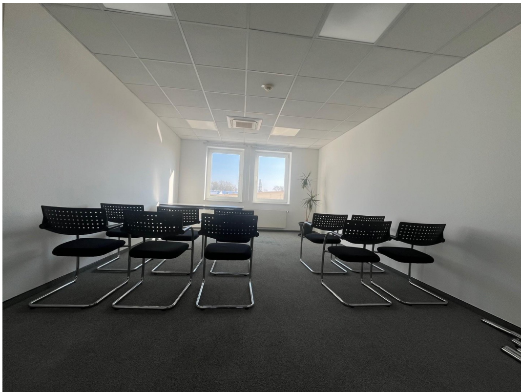
Konferenz-/Schulungsraum 22m 2