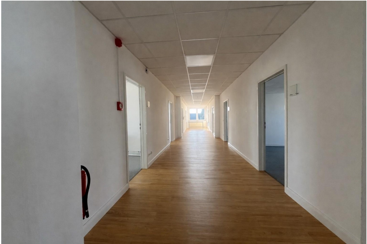
Flur zu den Tagungsräumen