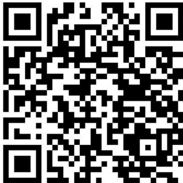
Lage des Grundstücks