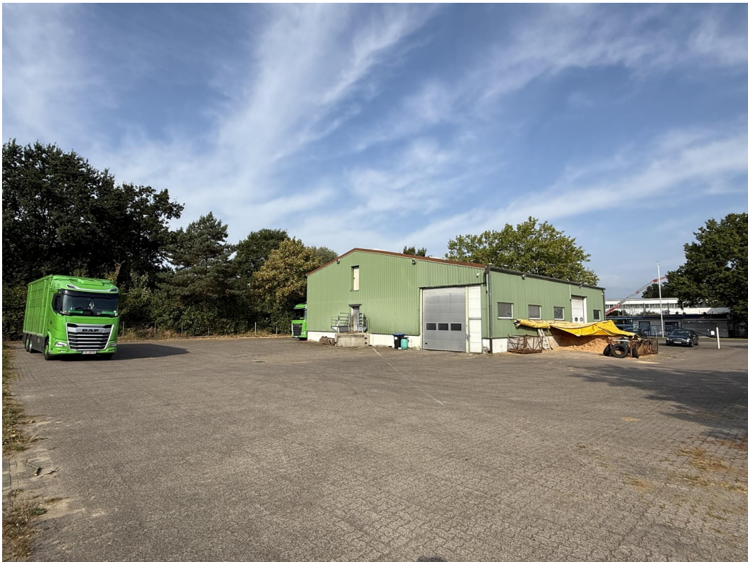
Außenansicht v. hinten