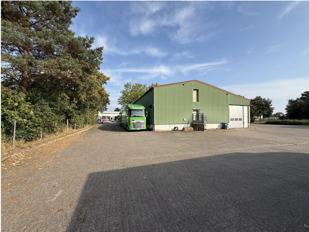
Außenansicht v. hinten