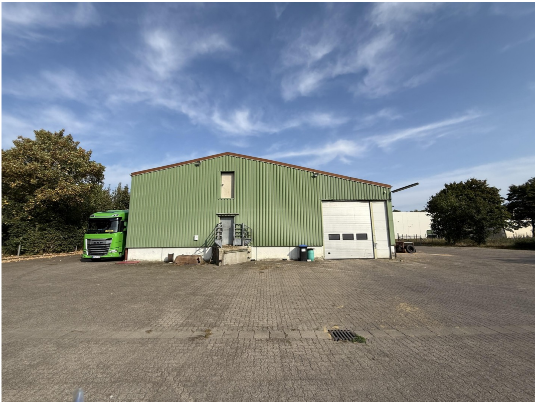
Außenansicht v. hinten