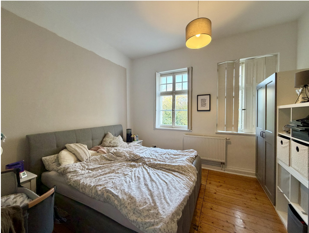
Schlafzimmer 1 OG