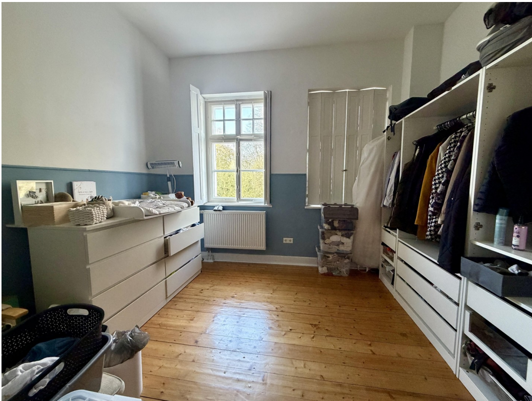
Schlafzimmer 2 OG