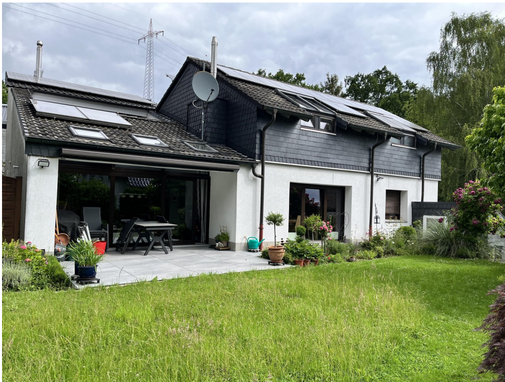
Außenansicht und Garten