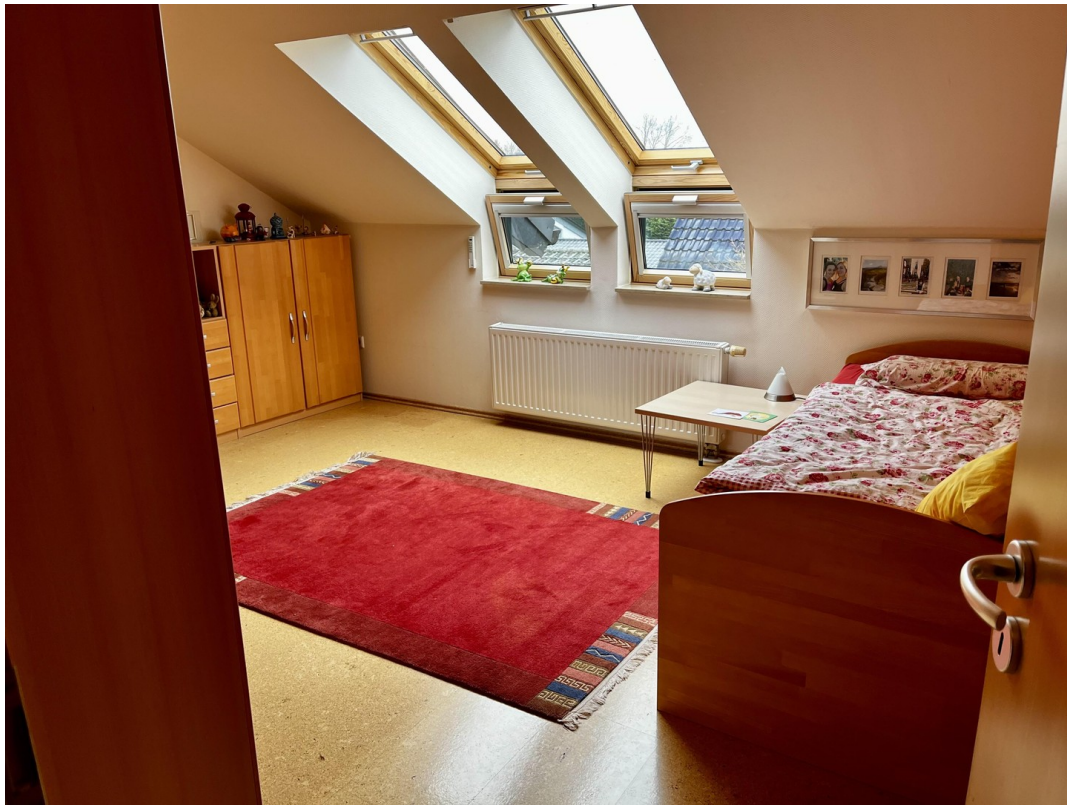
Kinderzimmer 2 im OG