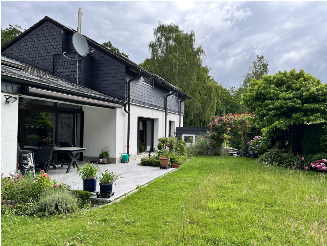
Außenansicht und Garten