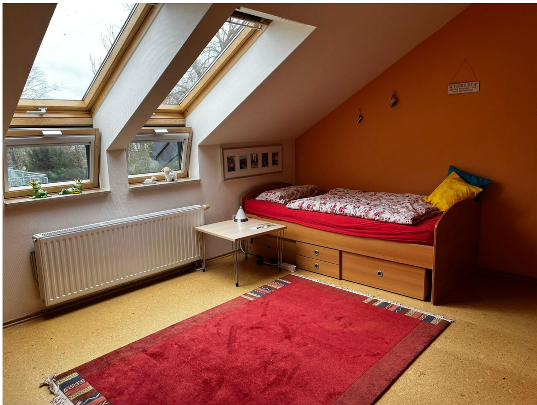
Kinderzimmer 2 im OG