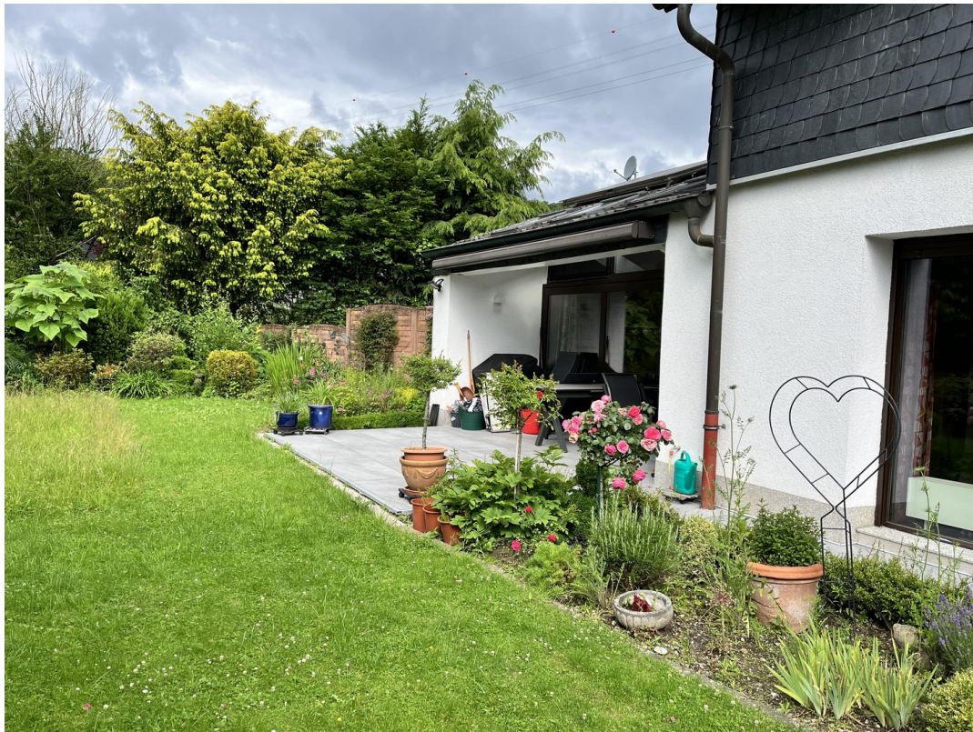
Außenansicht und Garten