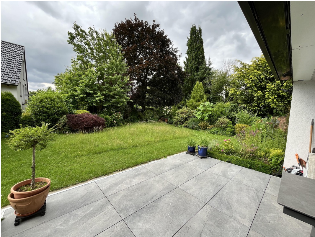
Terrasse und Gartenblick