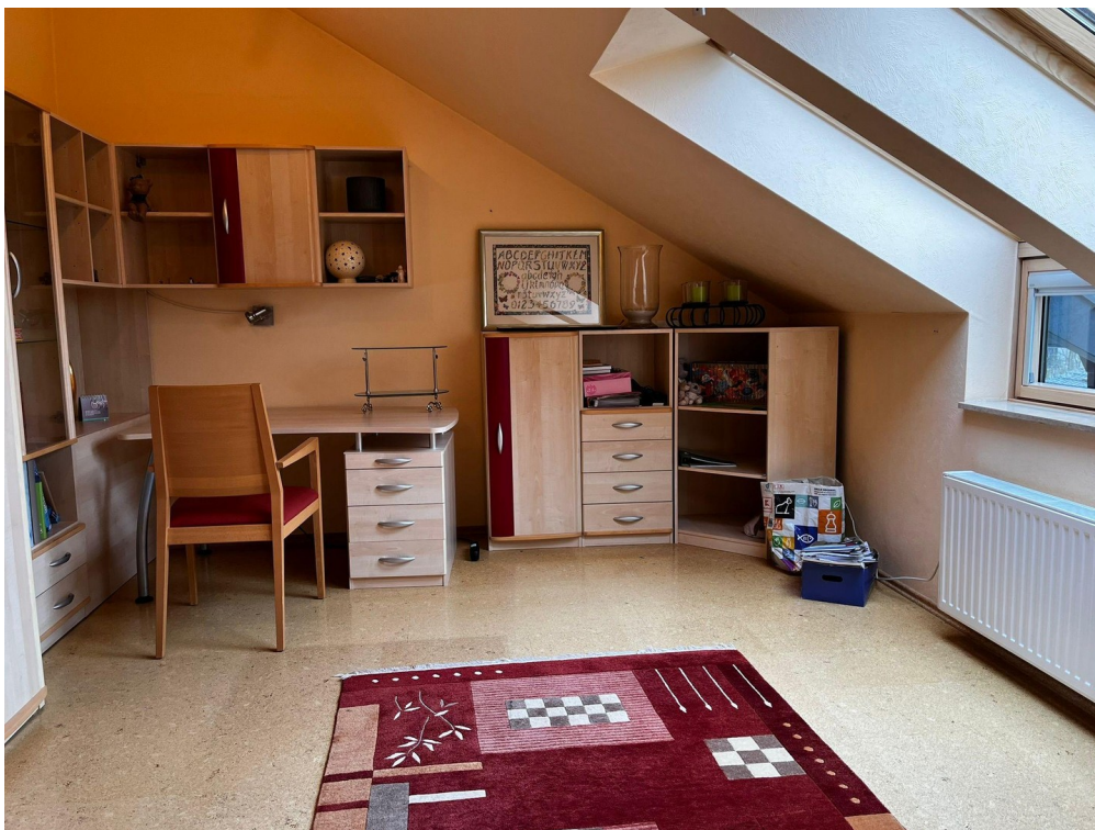
Kinderzimmer 1 im OG