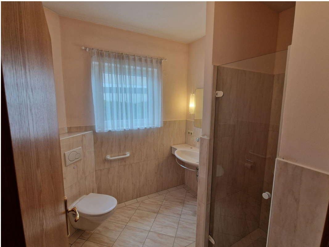
EG Duschbad zu Schlafzi. 1