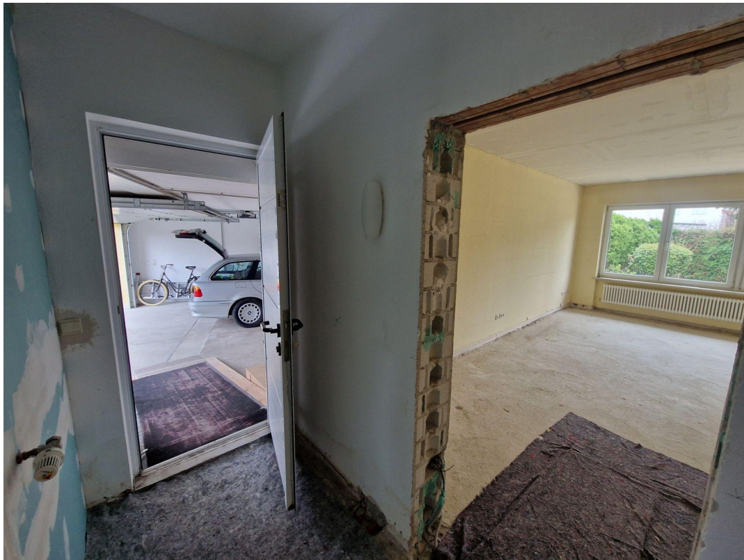
EG Hauszugang von der Garage