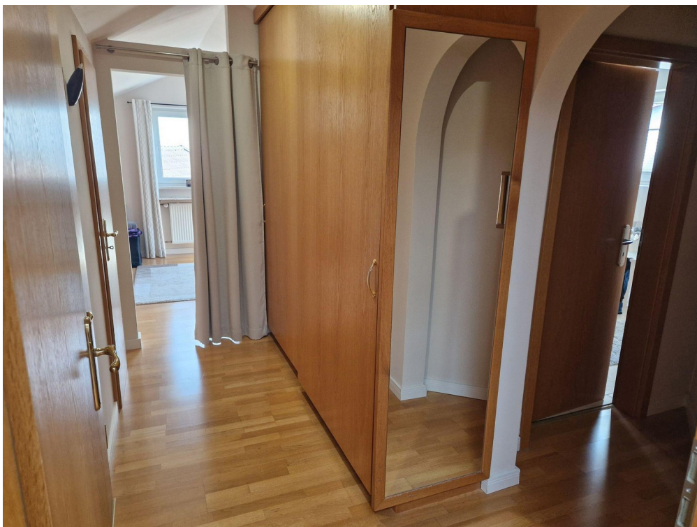
DG Ankleideflur zum Schlafzi.