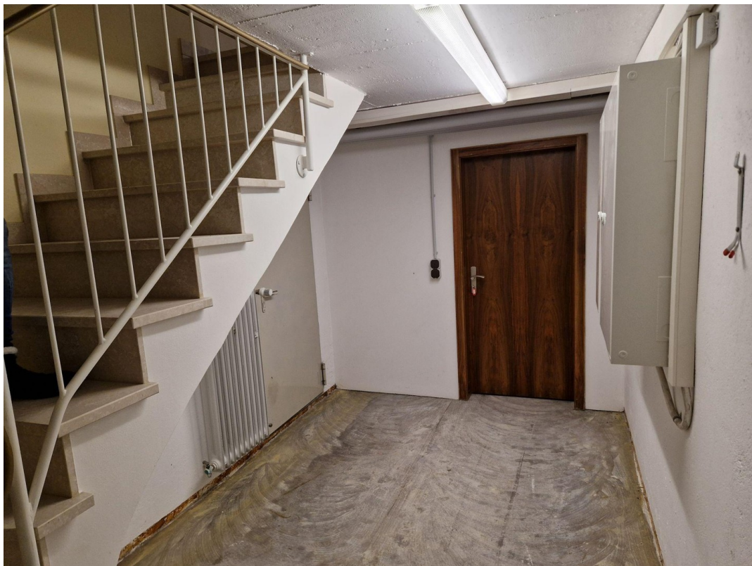
KG Treppenzugang Kellergeschoß