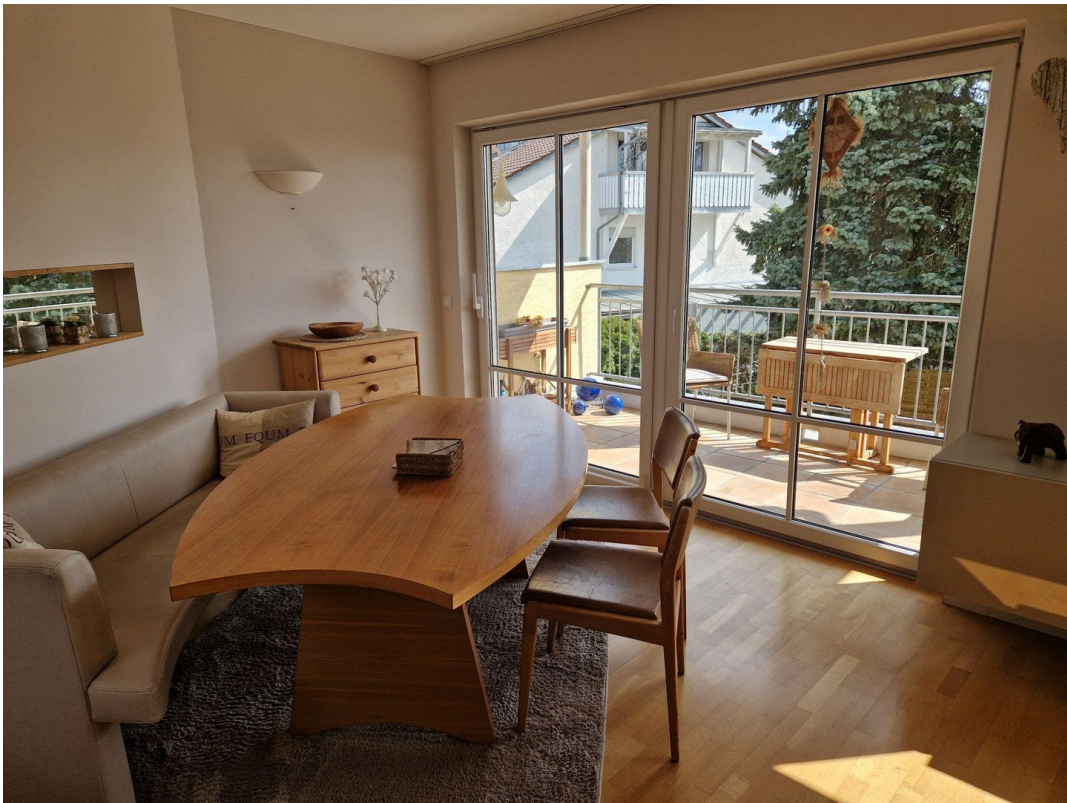
DG Esszimmer mit Süd-Balkon