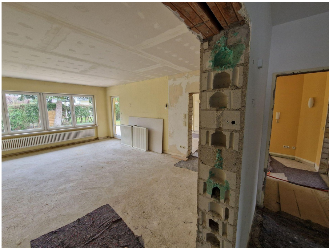
EG Wohnzi. (von Flur Garage)