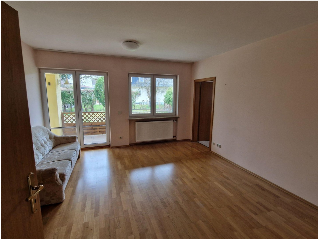
EG Schlafzimmer 1 (Oma)