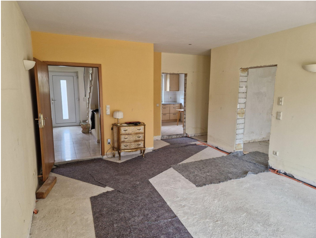
EG Esszimmer Blick zur Küche