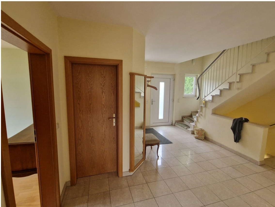
EG Hauptflur mit Hauszugang