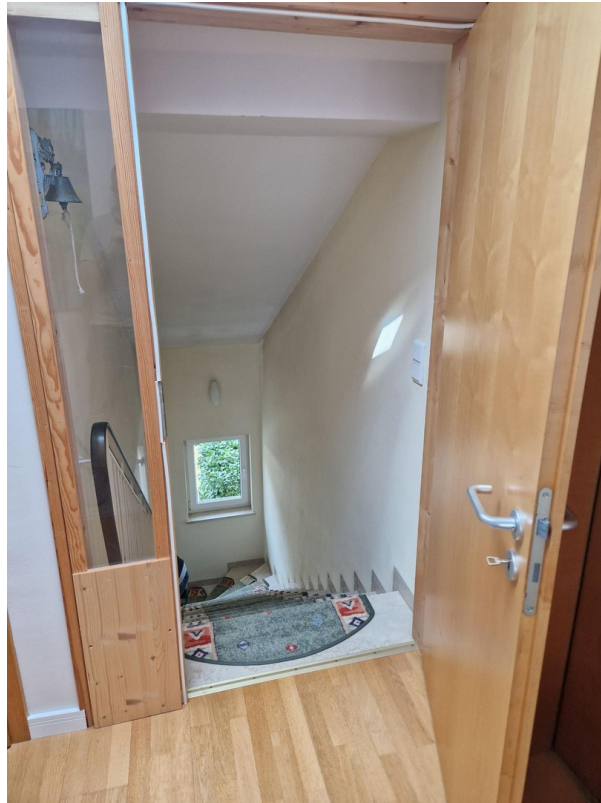
Treppenzugang zum Dachgeschoss