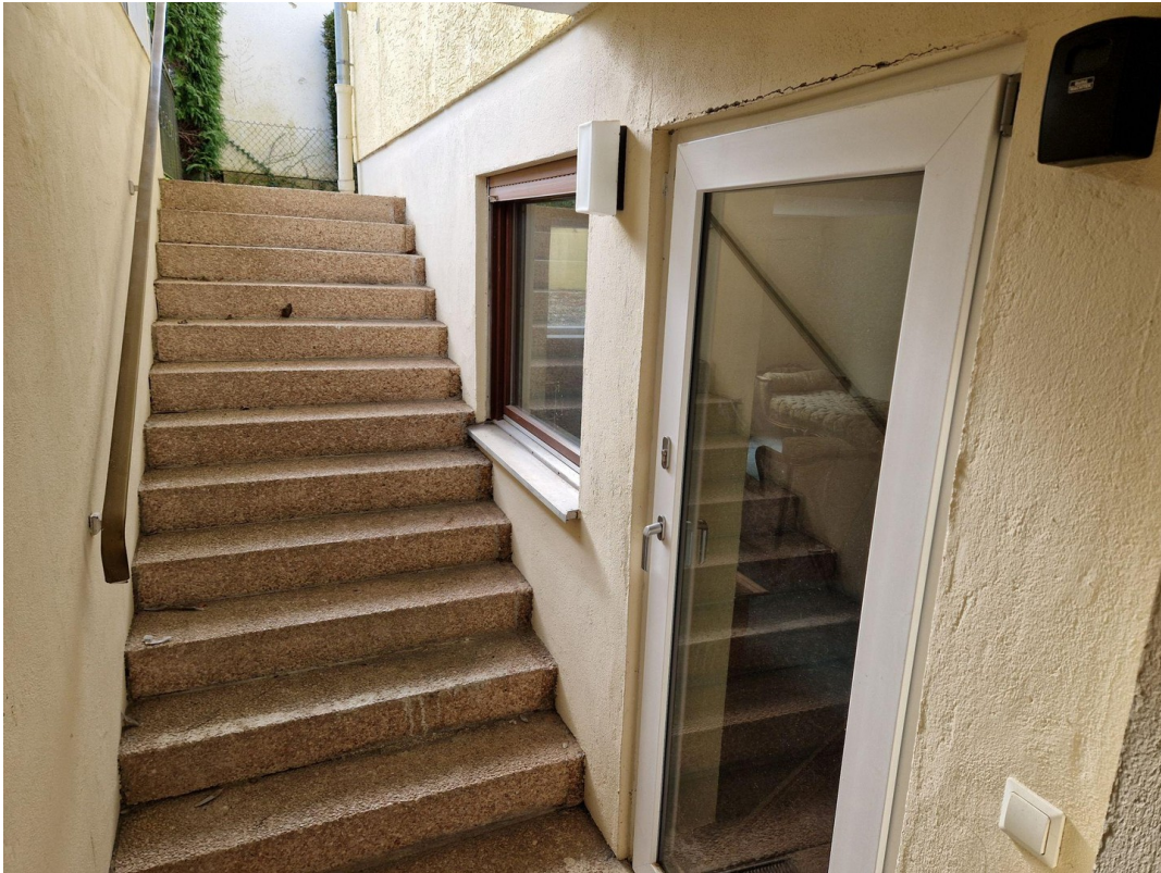
Treppe zum KG und Hobbyfläche