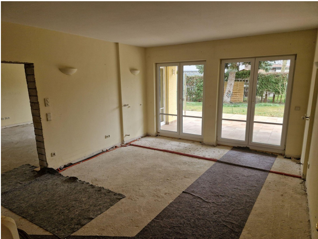
EG Esszimmer mit Terrasse