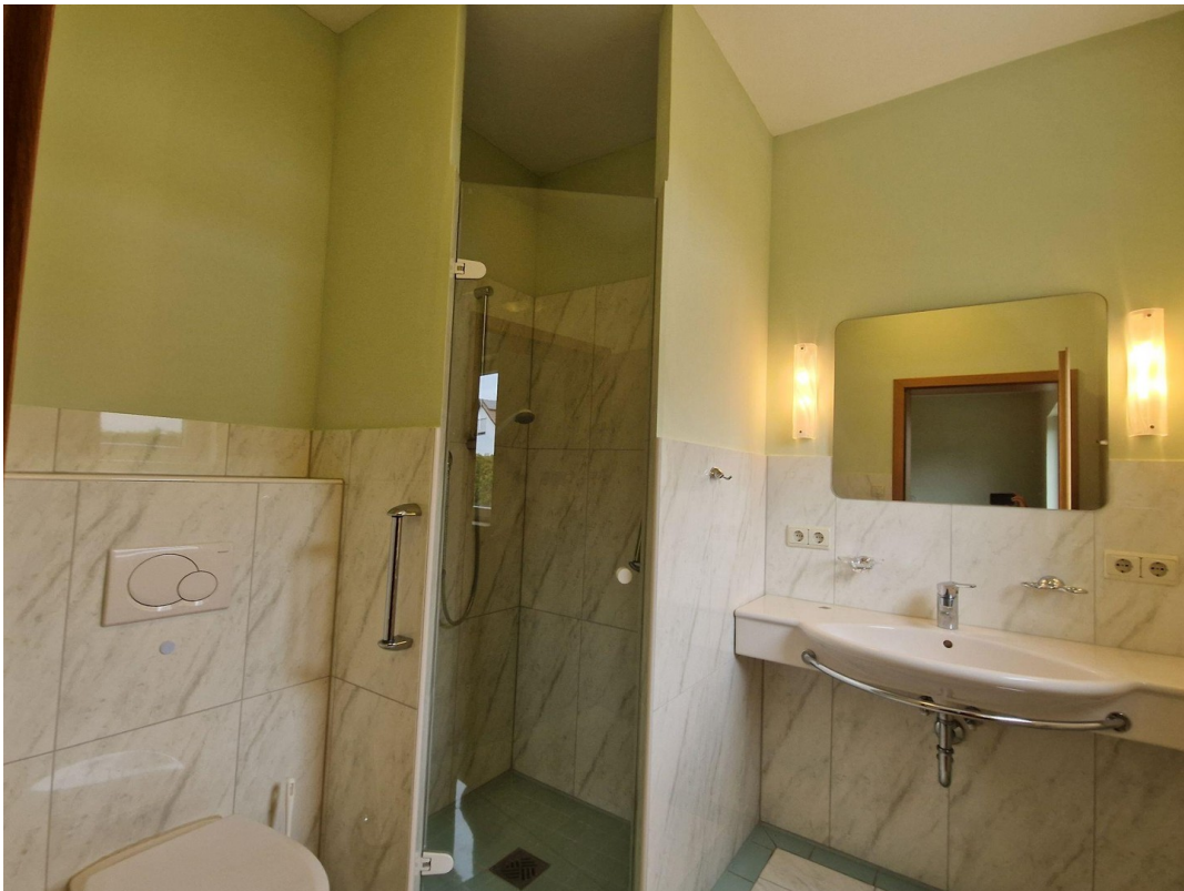
EG Duschbad zu Gastzimmer