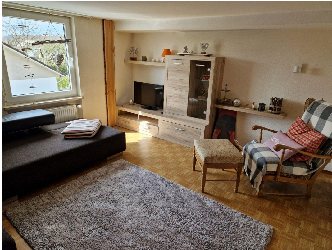
DG Fernsehzimmer (Gast)