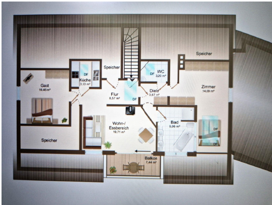
Dachgeschoss aktuell 2022