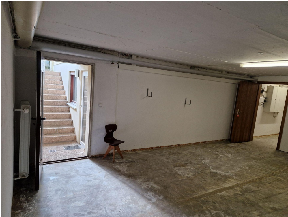
KG Kellerraum 1 von 3