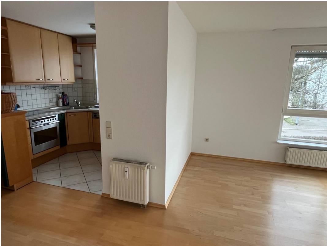
Wohnzimmer und Küche