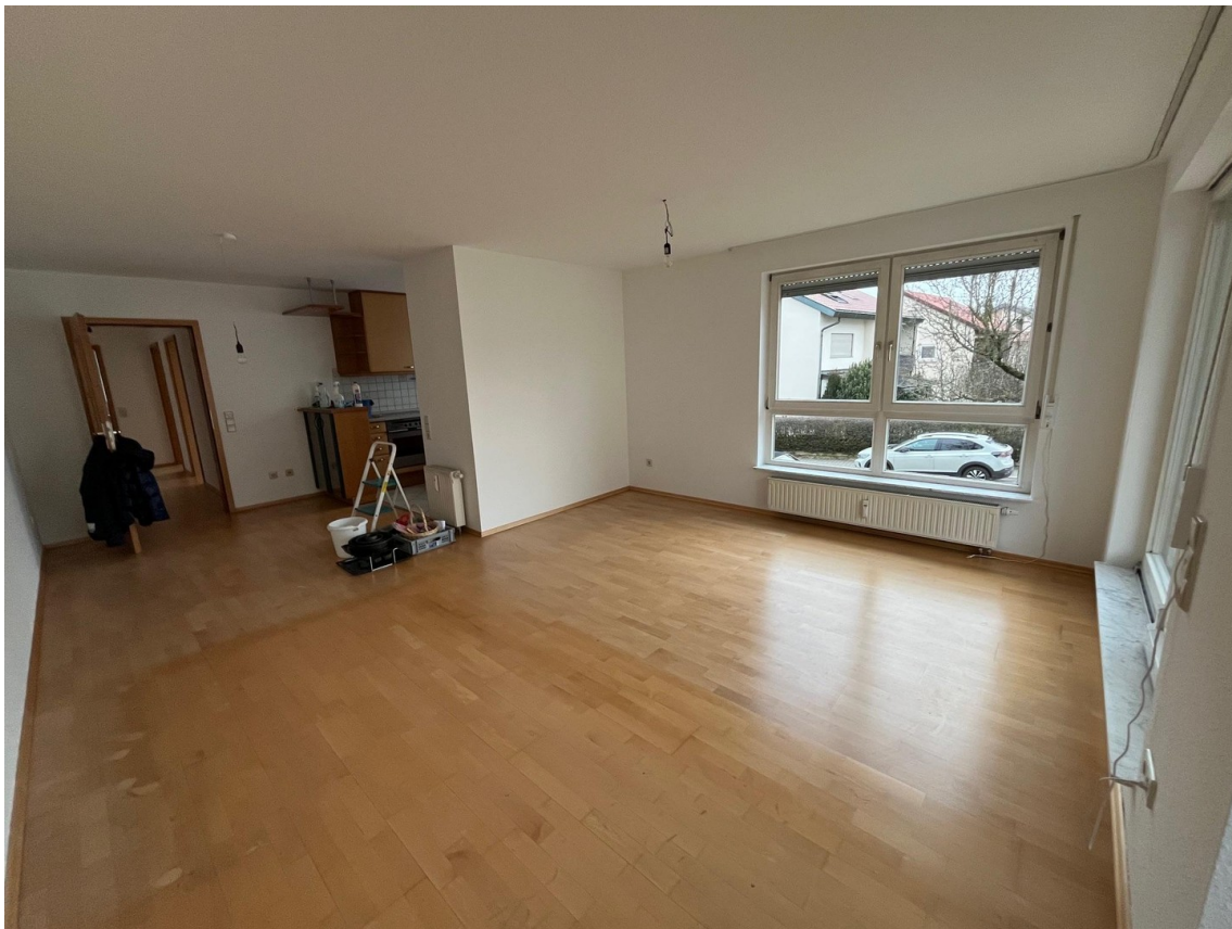
Wohnzimmer und Essbereich