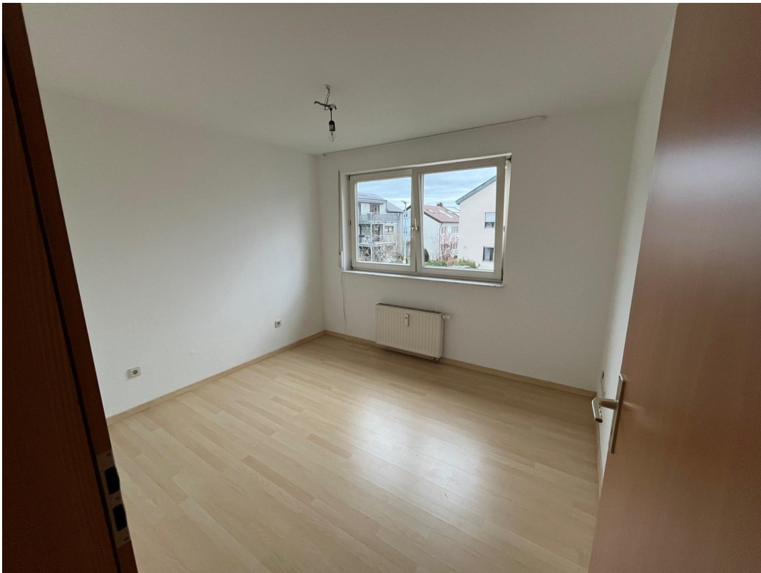
Kinder- bzw. Gästezimmer