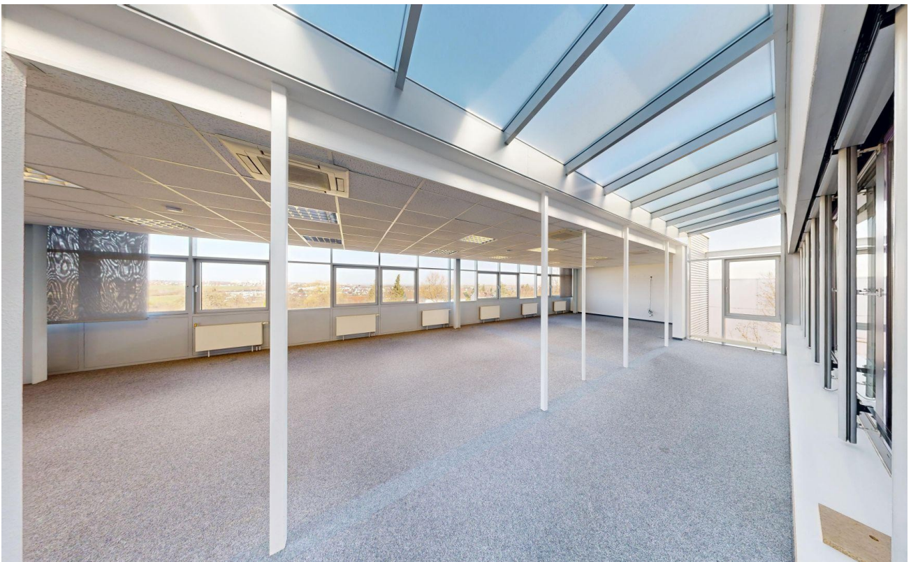
Großraumbüro mit Ausblick