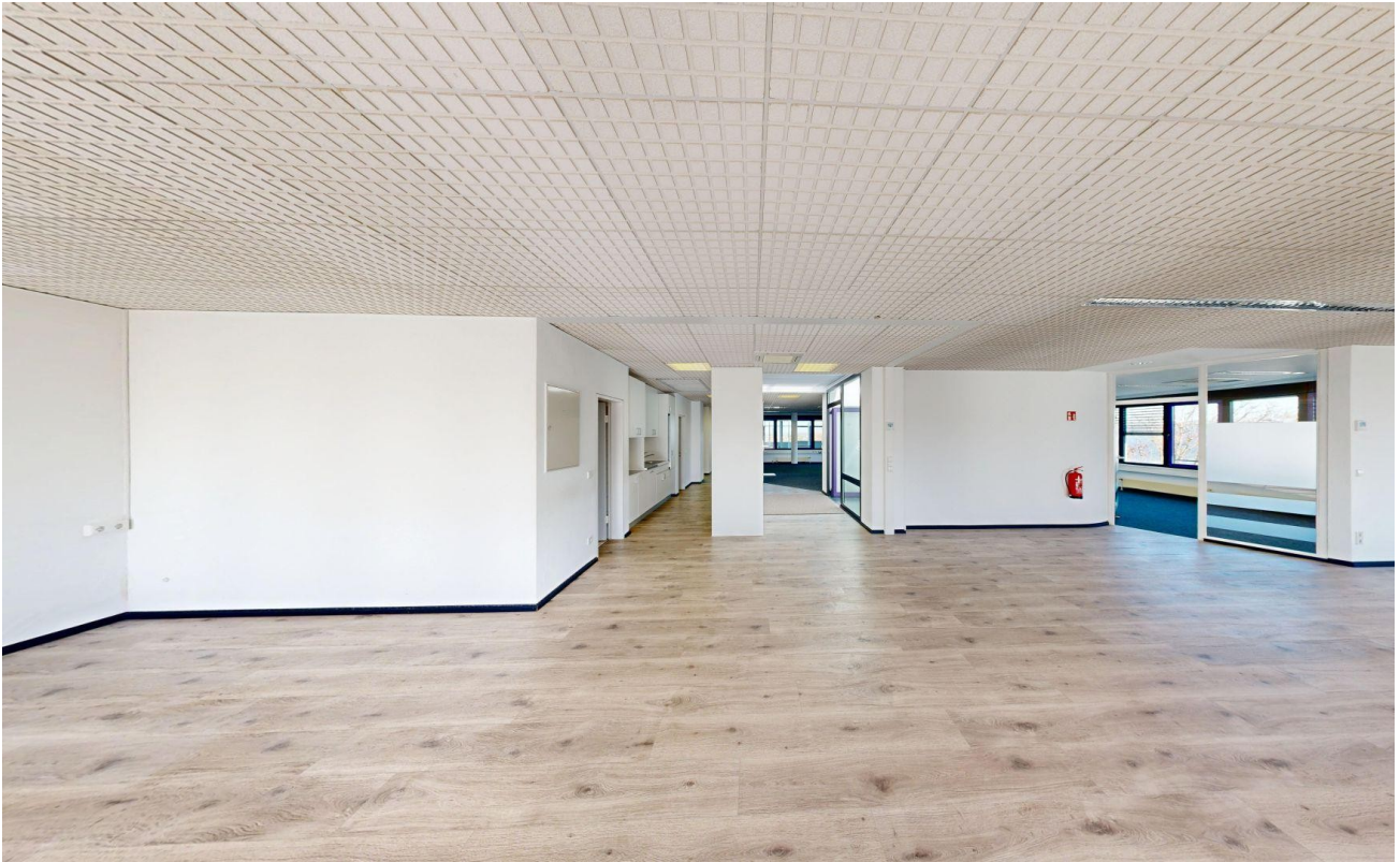
Blick zum Eingang