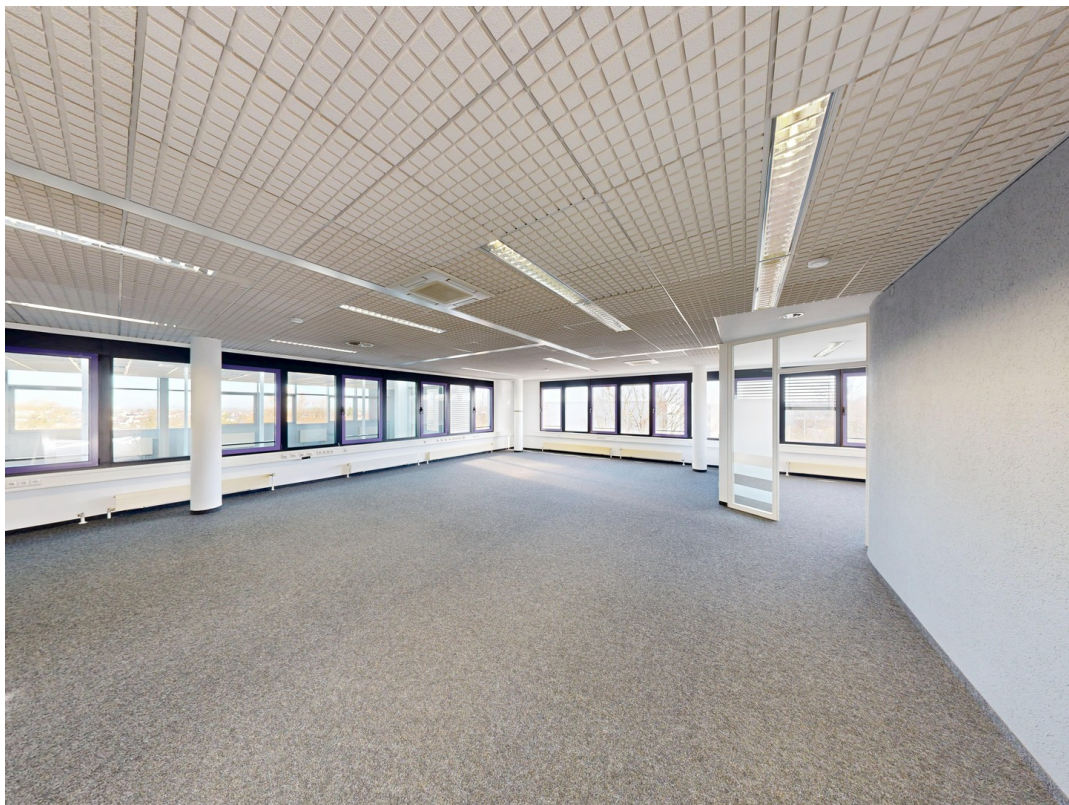
Großraumbüro m. Teppichboden