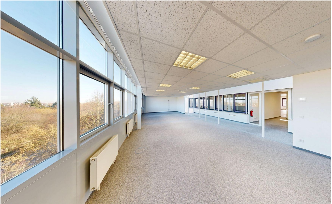
Großraumbüro mit Ausblick