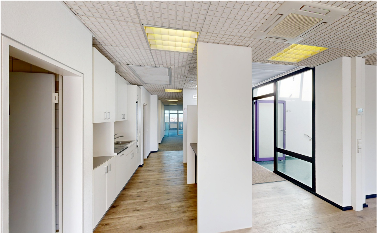
Teeküche, Garderobe, Eingang