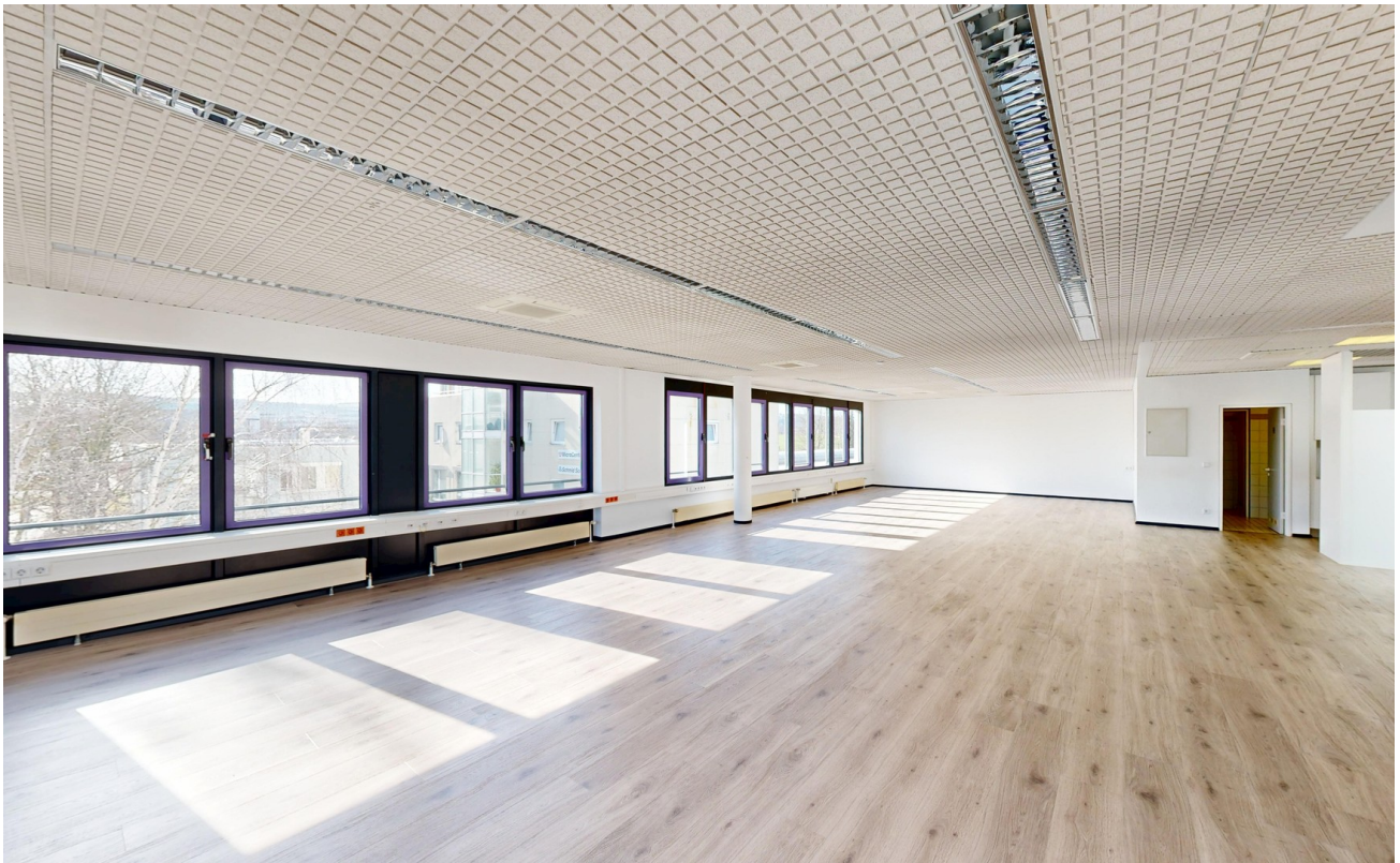
Großraumbüro mit Laminatboden