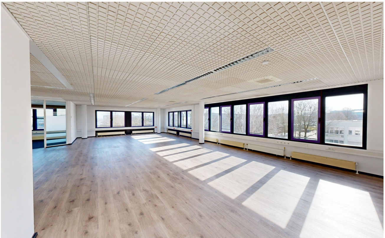
Großraumbüro mit Laminatboden