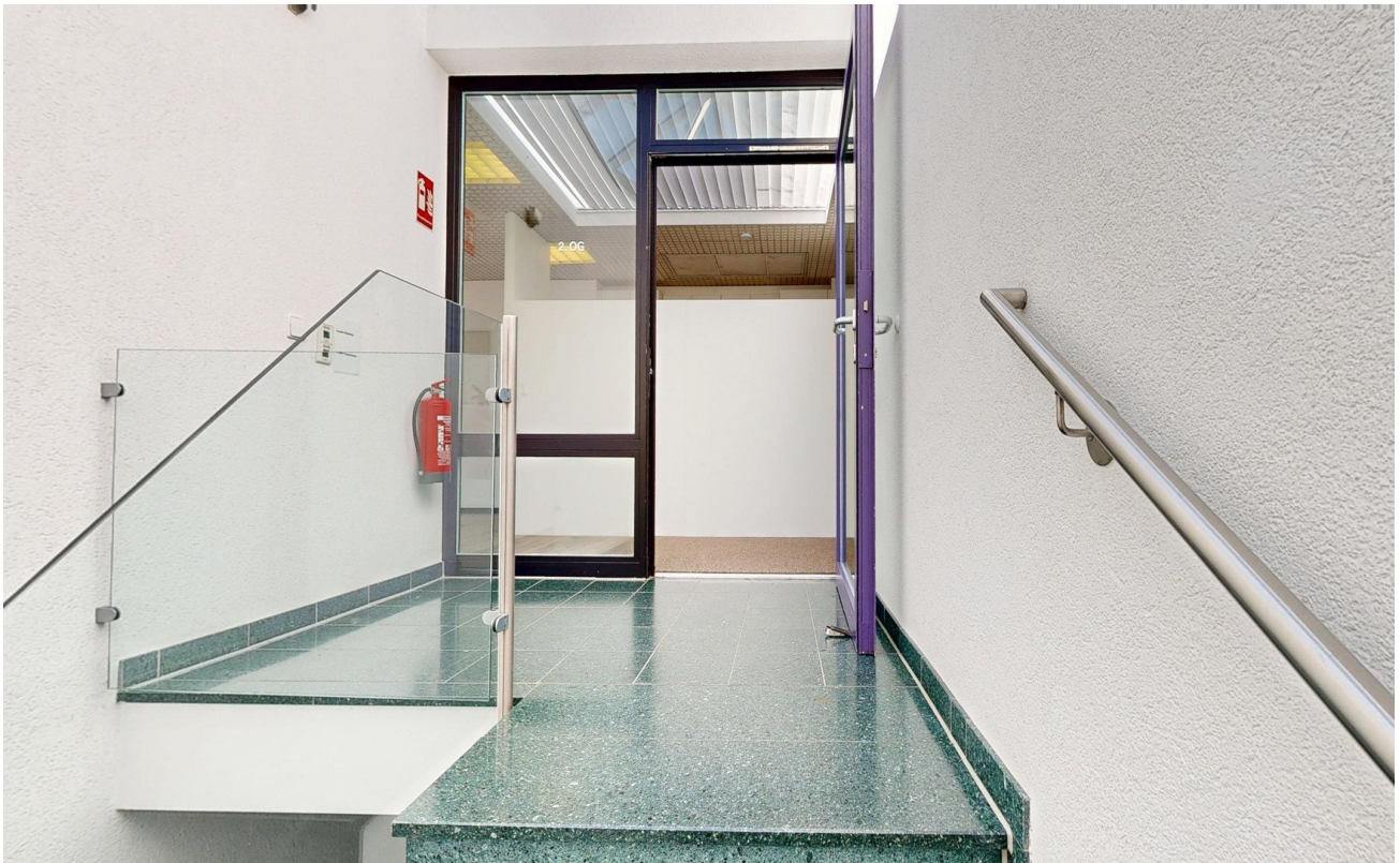
2. OG Eingang