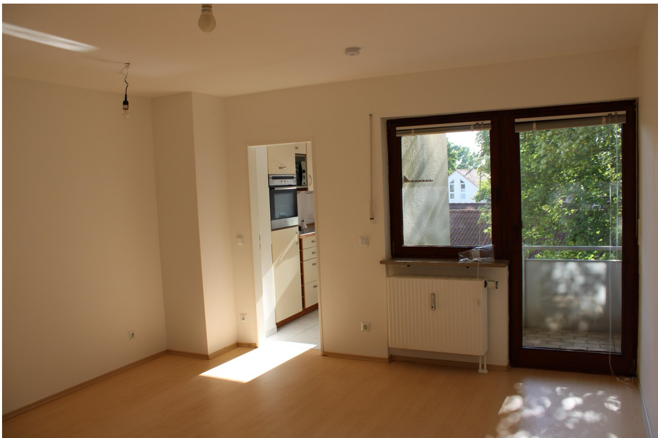
Wohnzimmer Zugang Küche