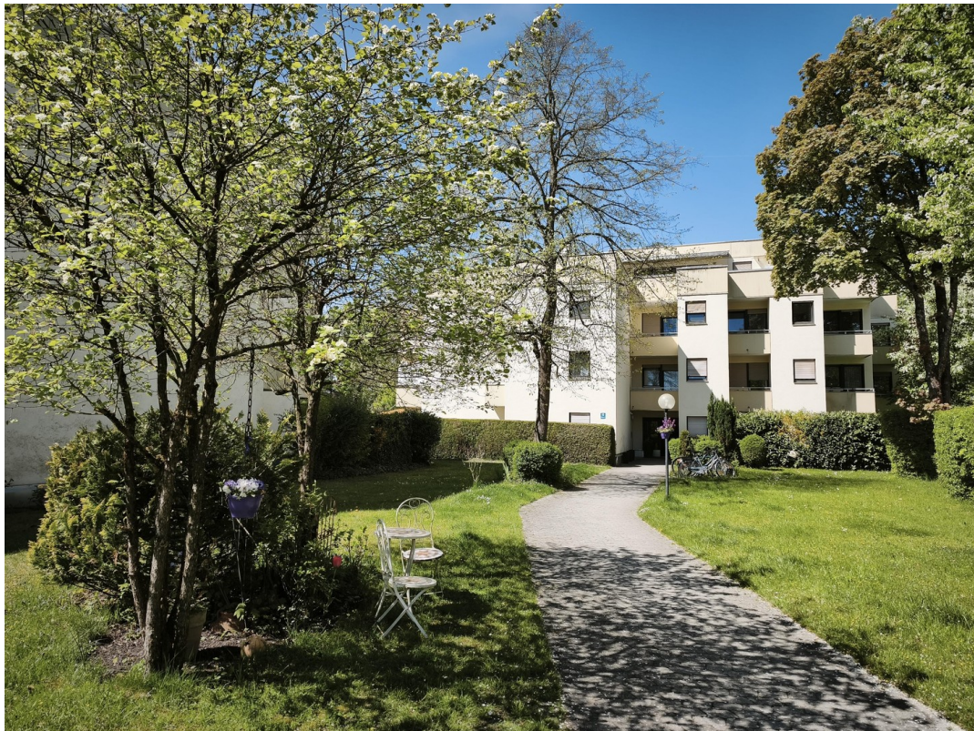
Hausansicht (Ost) Eingang