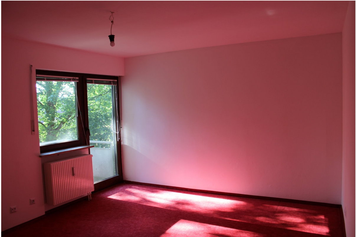
Schlafzimmer mit Westbalkon 2