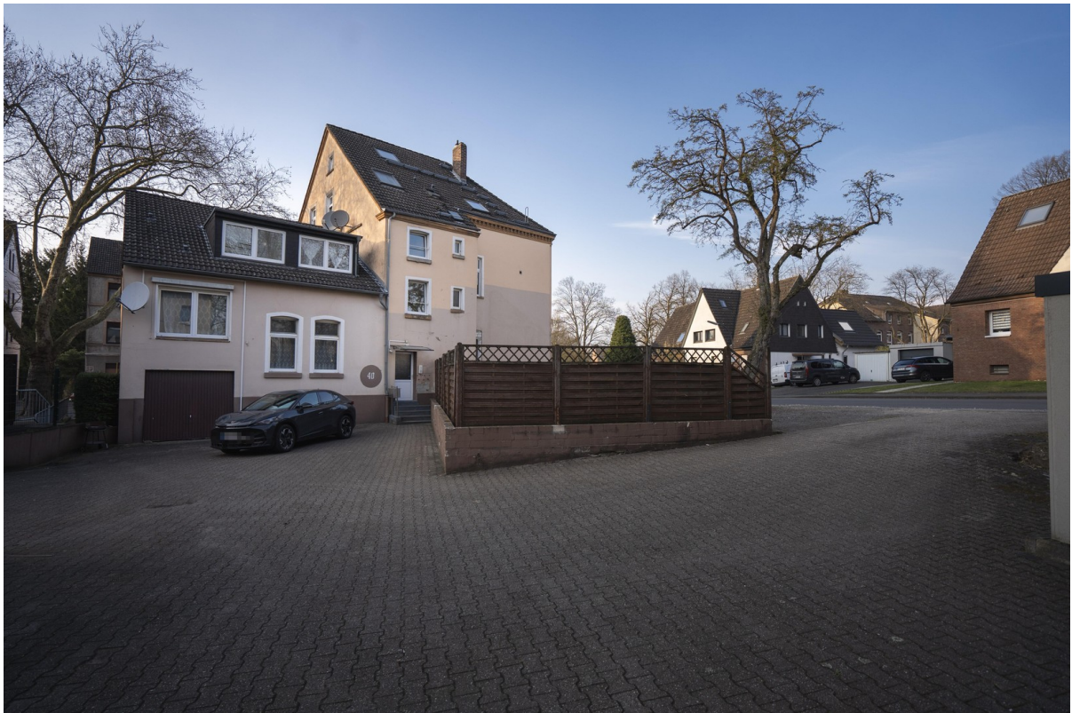
Außenansicht hinten (Eingang)