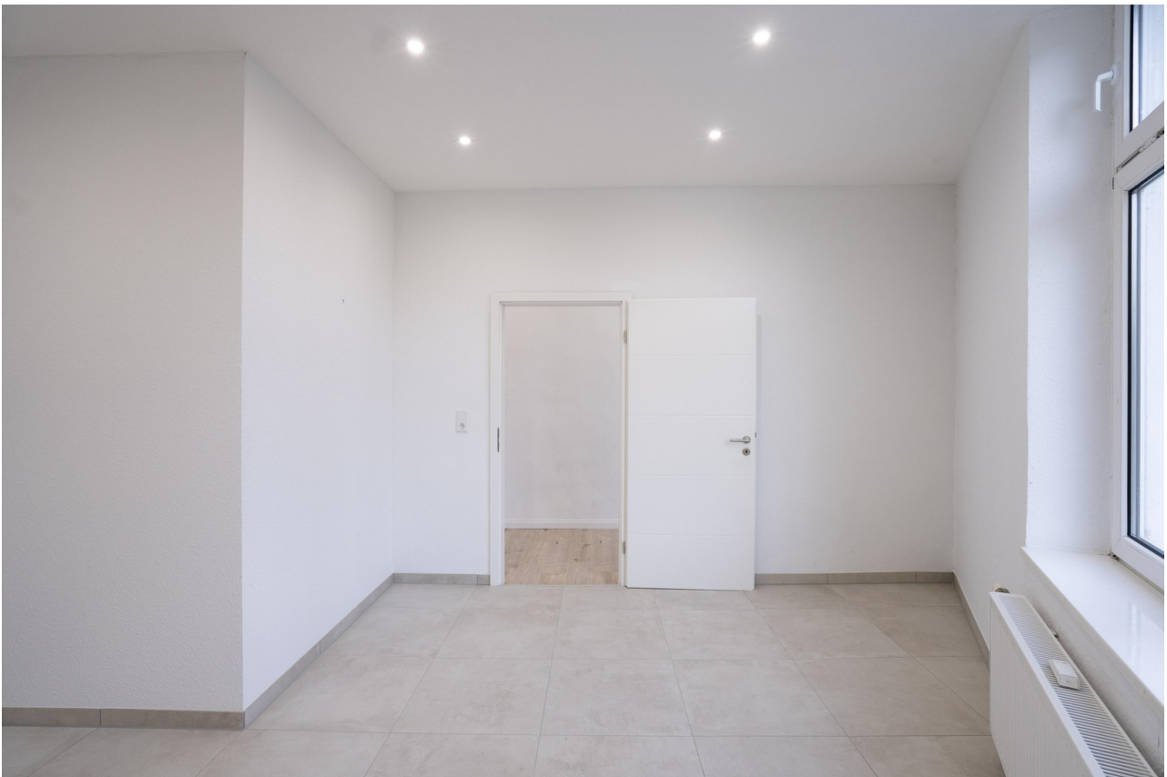
Küche - 2