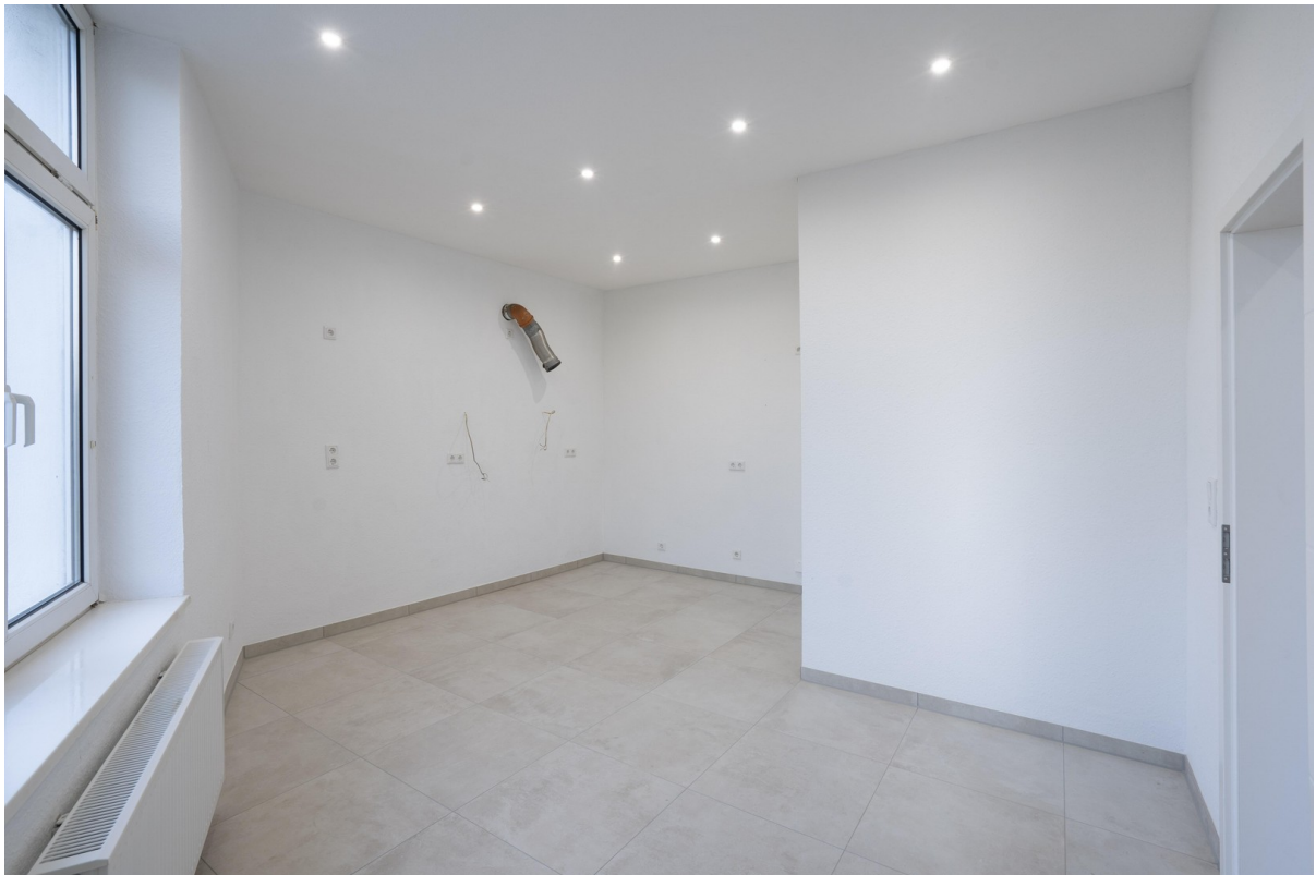
Küche - 4