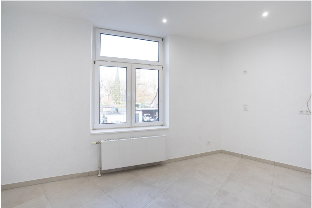
Küche - 3