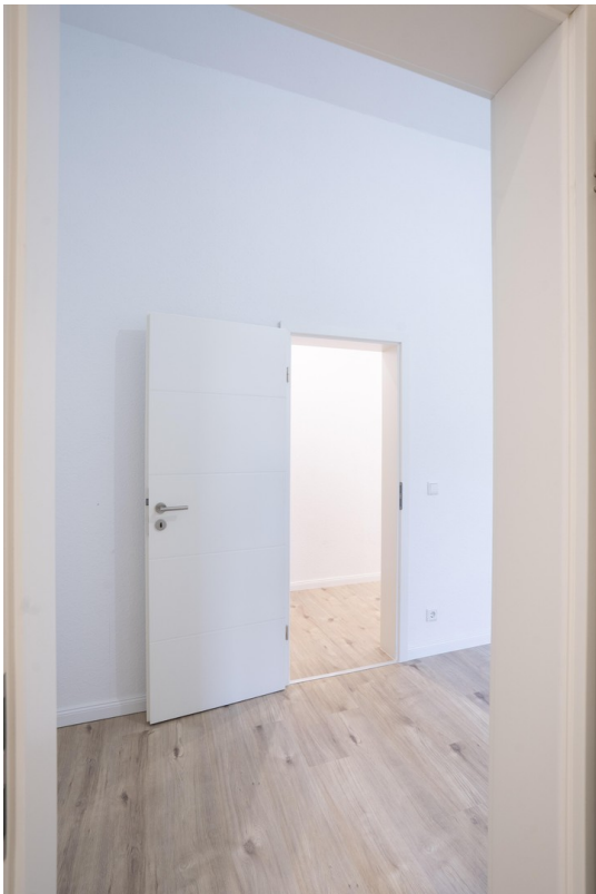
Schlafzimmer - 3 (vom Bad aus)