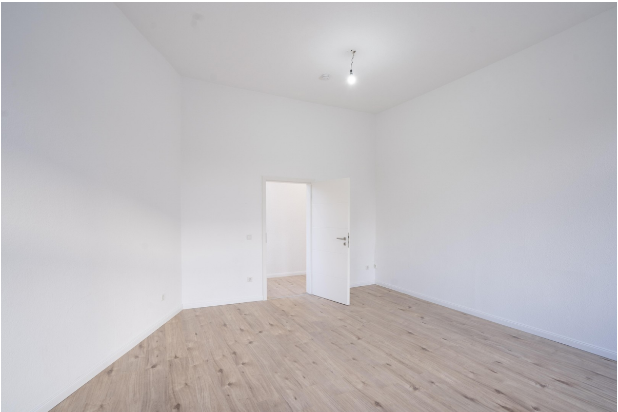
Wohnzimmer - 3