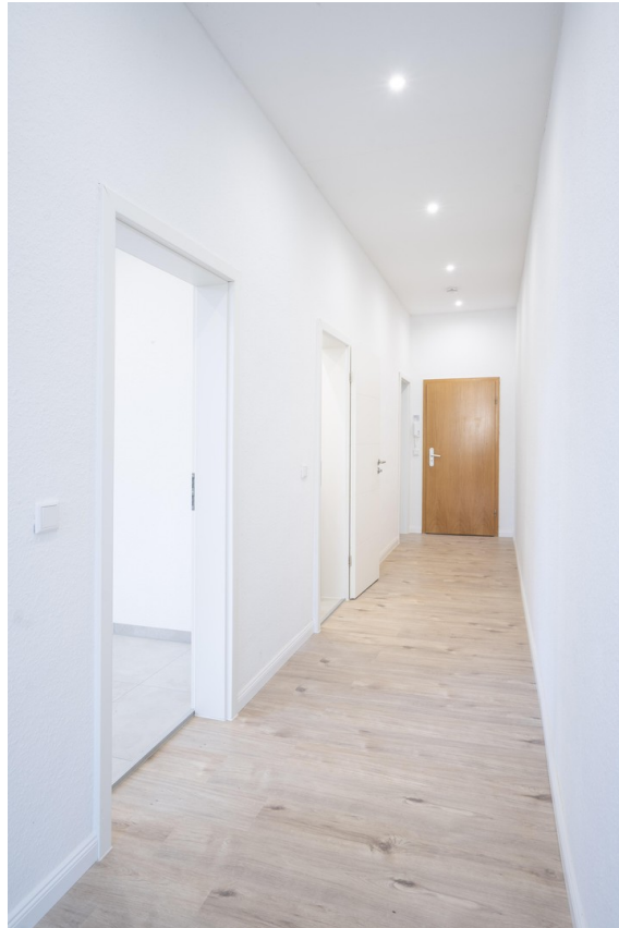
Flur - 3