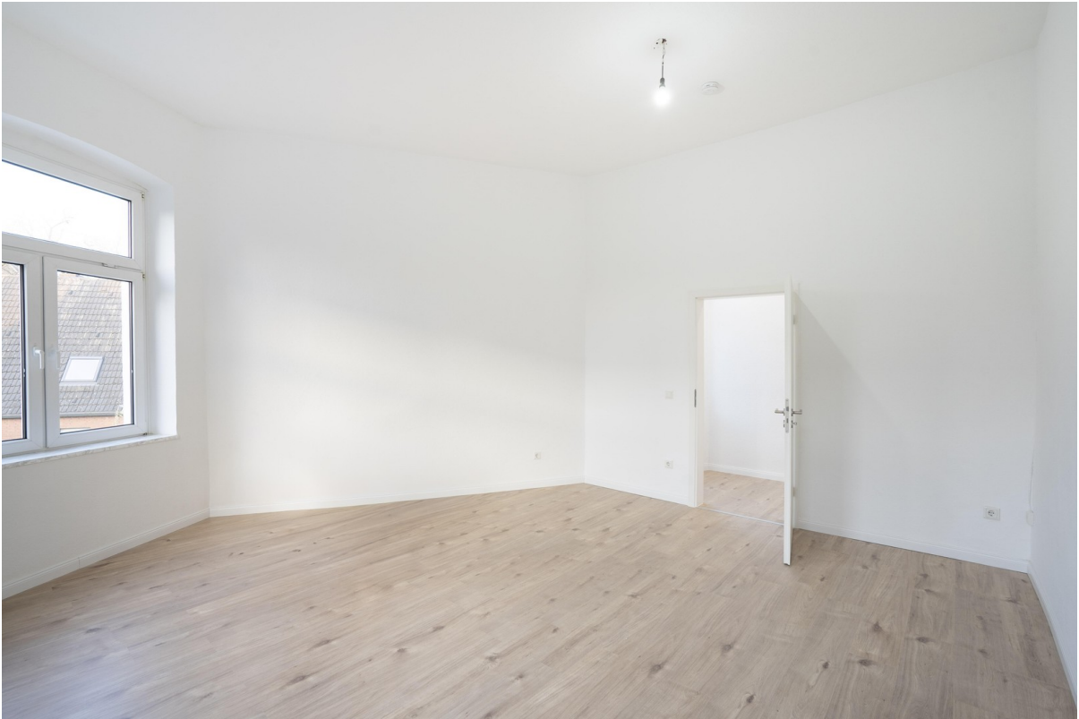
Wohnzimmer - 2