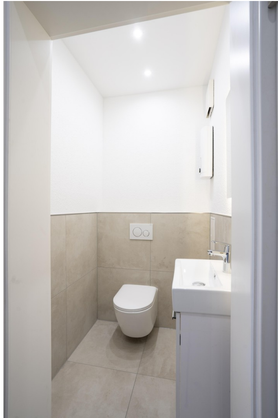
(Gäste-)WC - 2