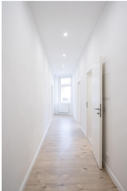
Flur - 2