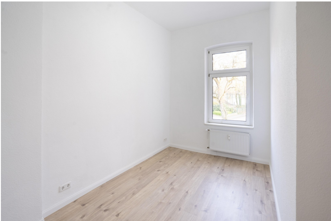
Schlafzimmer - 1