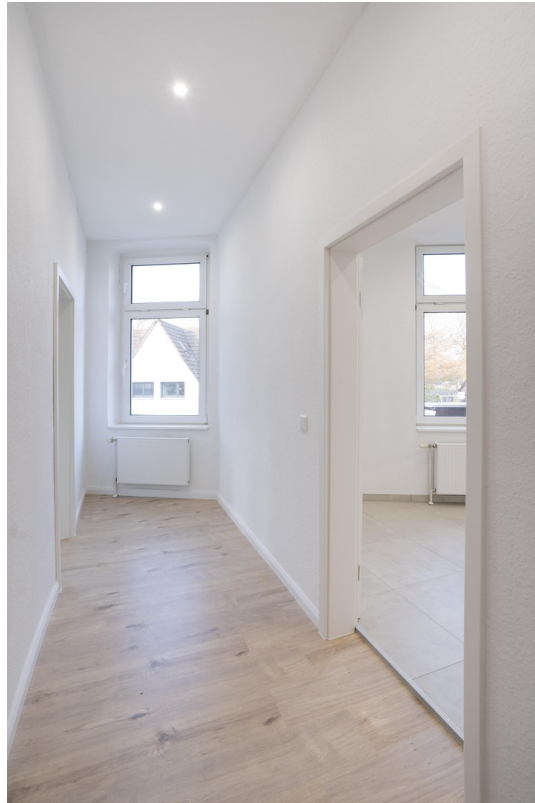
Flur - 1