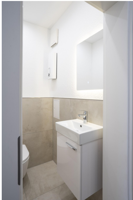
(Gäste-)WC - 1