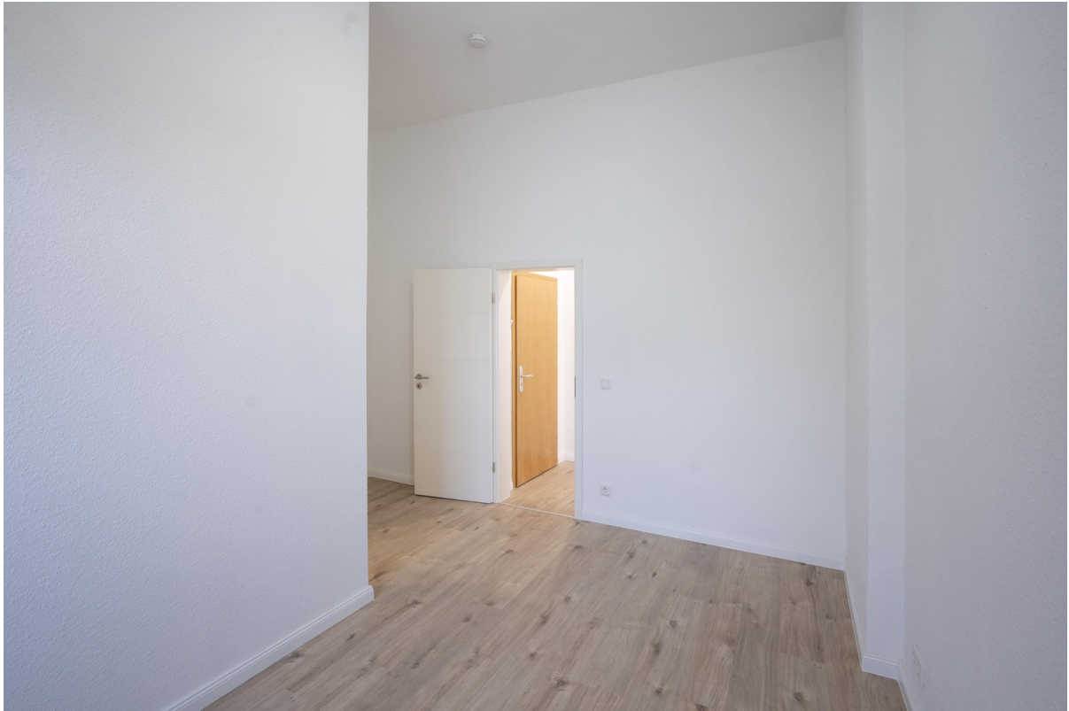
Schlafzimmer - 2