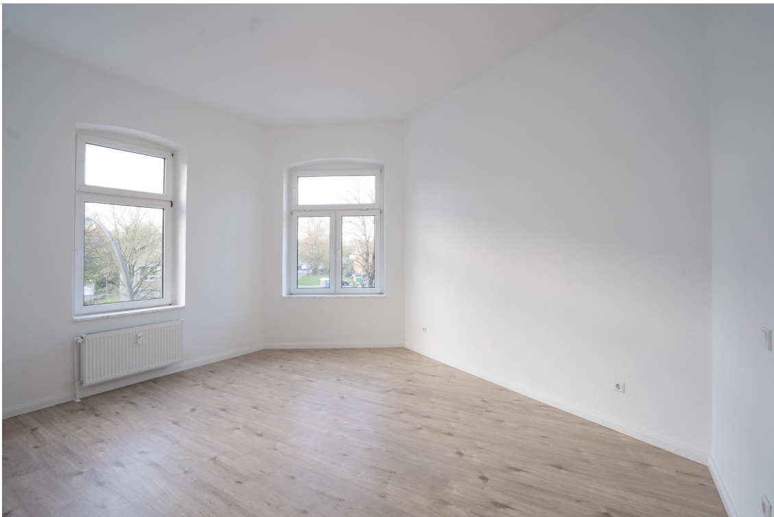
Wohnzimmer - 1