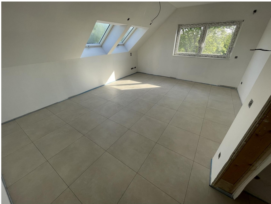
Kinderzimmer 1. OG