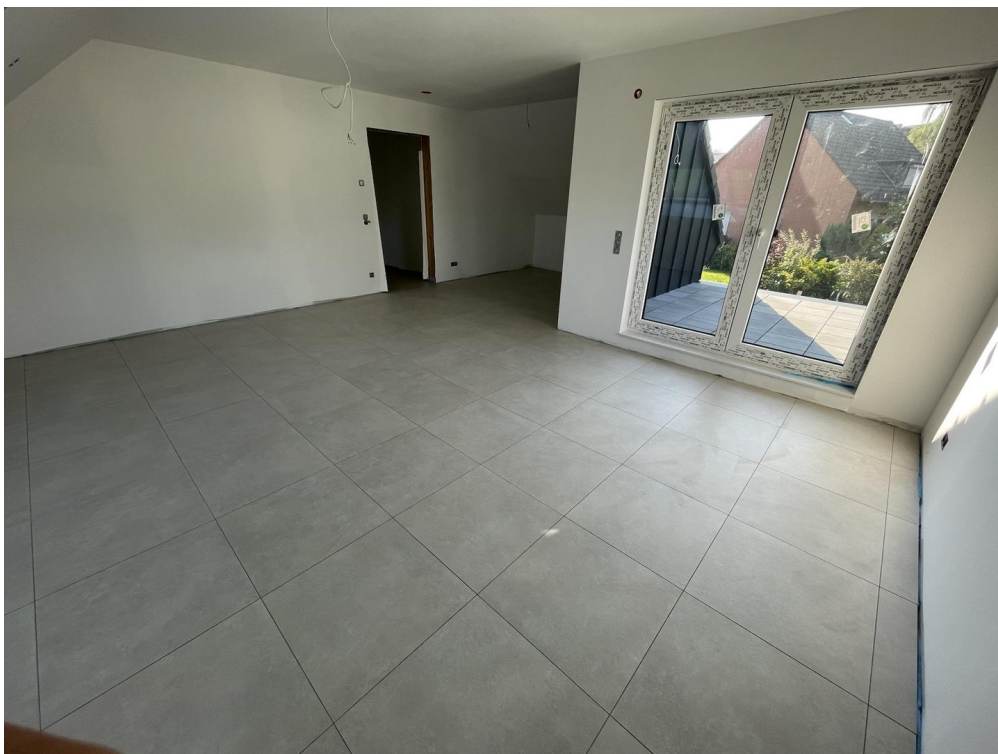
Schlafzimmer Zugang zur Loggia