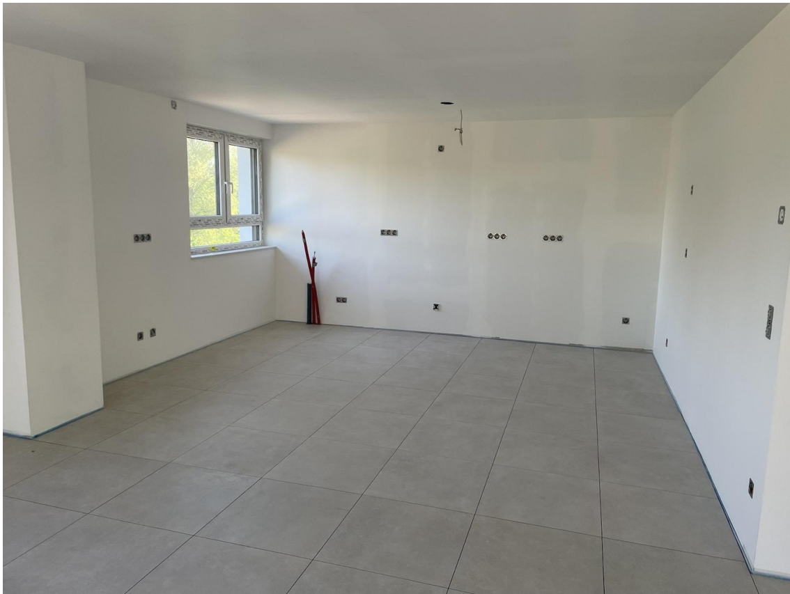
Küche, Kücheninsel möglich