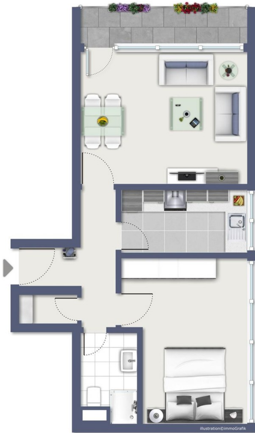
Illustration©immoGrafik Exposéplan, nicht maßstäblich