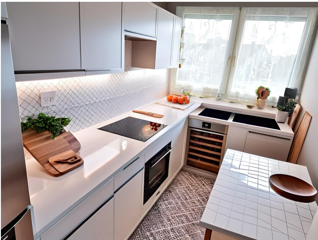
Einbauküche der Mieterin