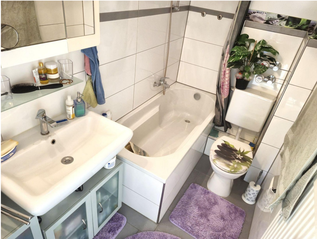
Bad mit Wanne zum Duschen