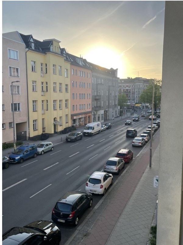
Blick Balkon zur Kaiserreiche