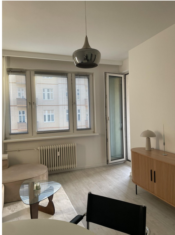
Wohnzimmer Zugang Balkon