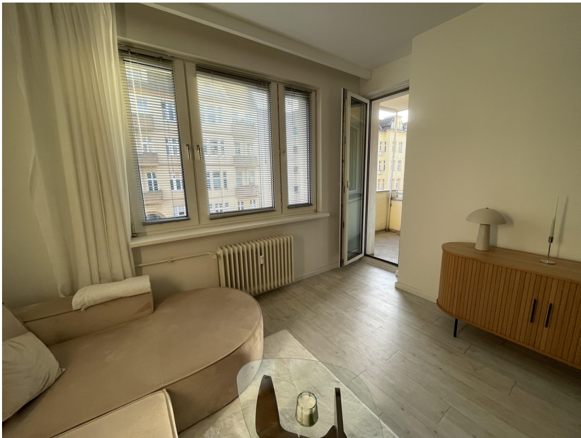
Wohnzimmer Zugang Balkon