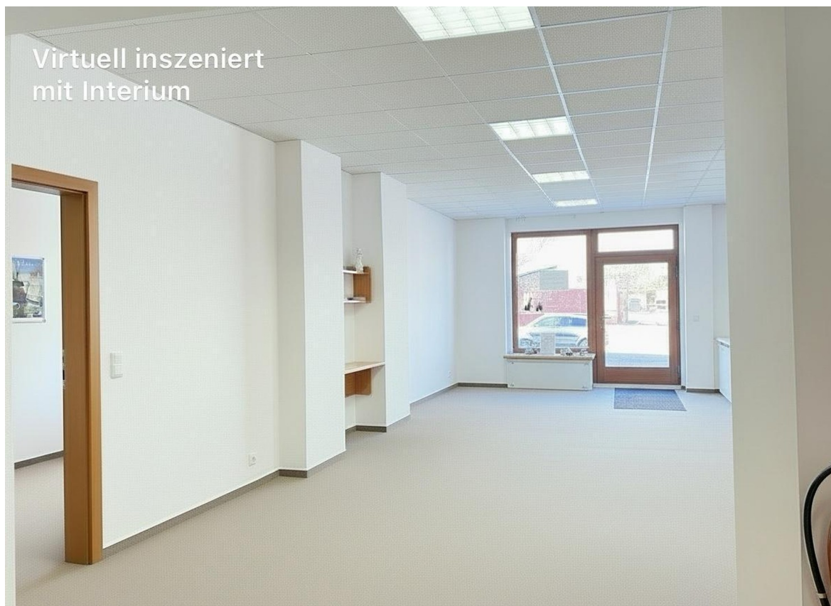
Visualisierung o. Einrichtung