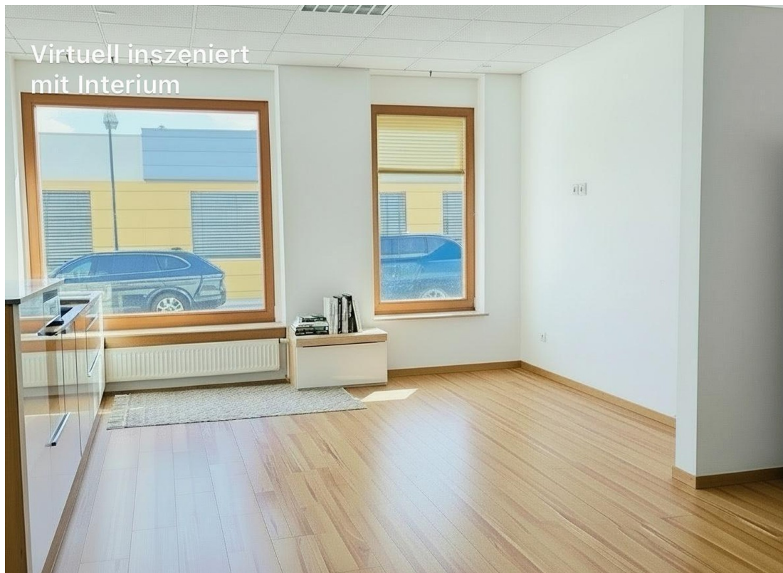
Visualisierung o. Einrichtung