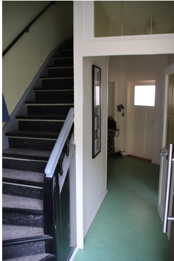
Flur und Treppe