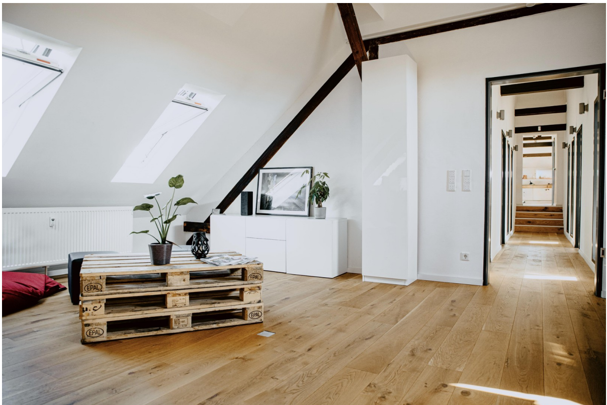
Empfang / Eingangsbereich