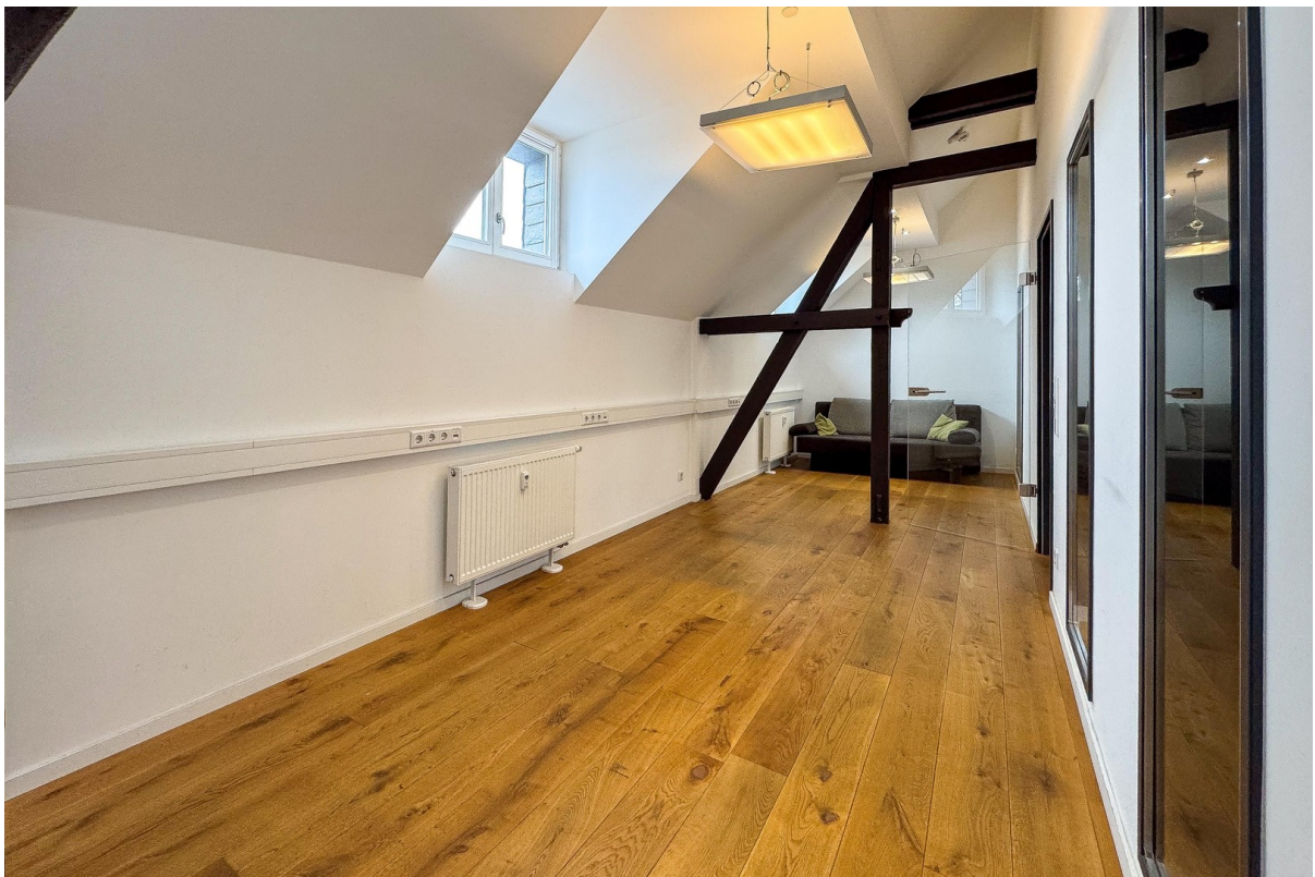
Büro 3 - andere Ansicht