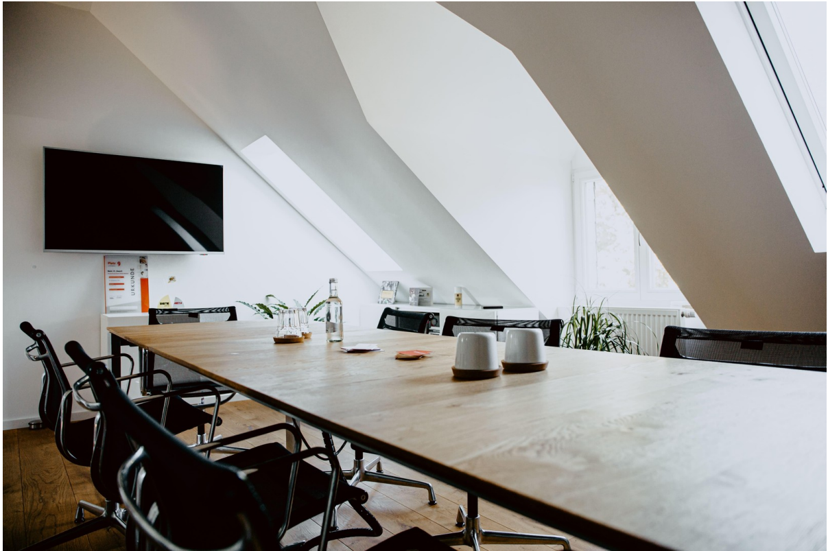
Besprechungsraum / Büro 2