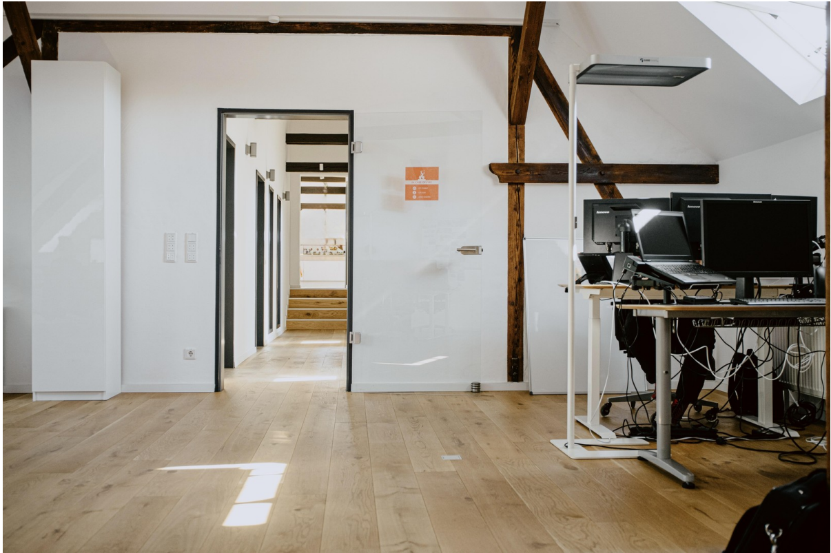
Großraumbüro - andere Ansicht