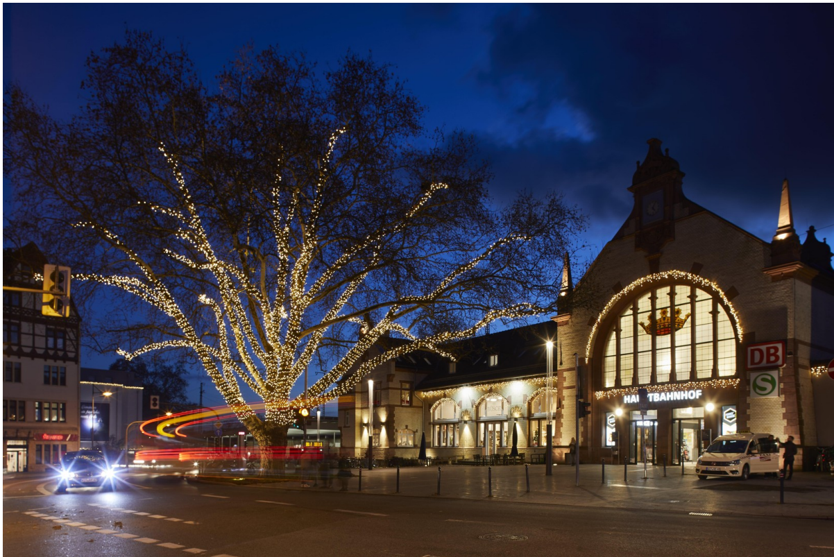
Impression Witten Hbf