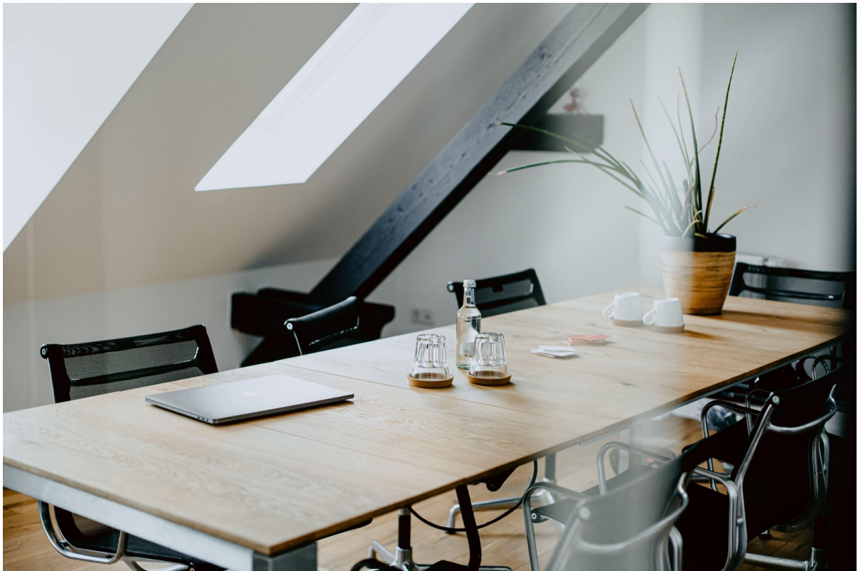
Besprechungsraum / Büro 2