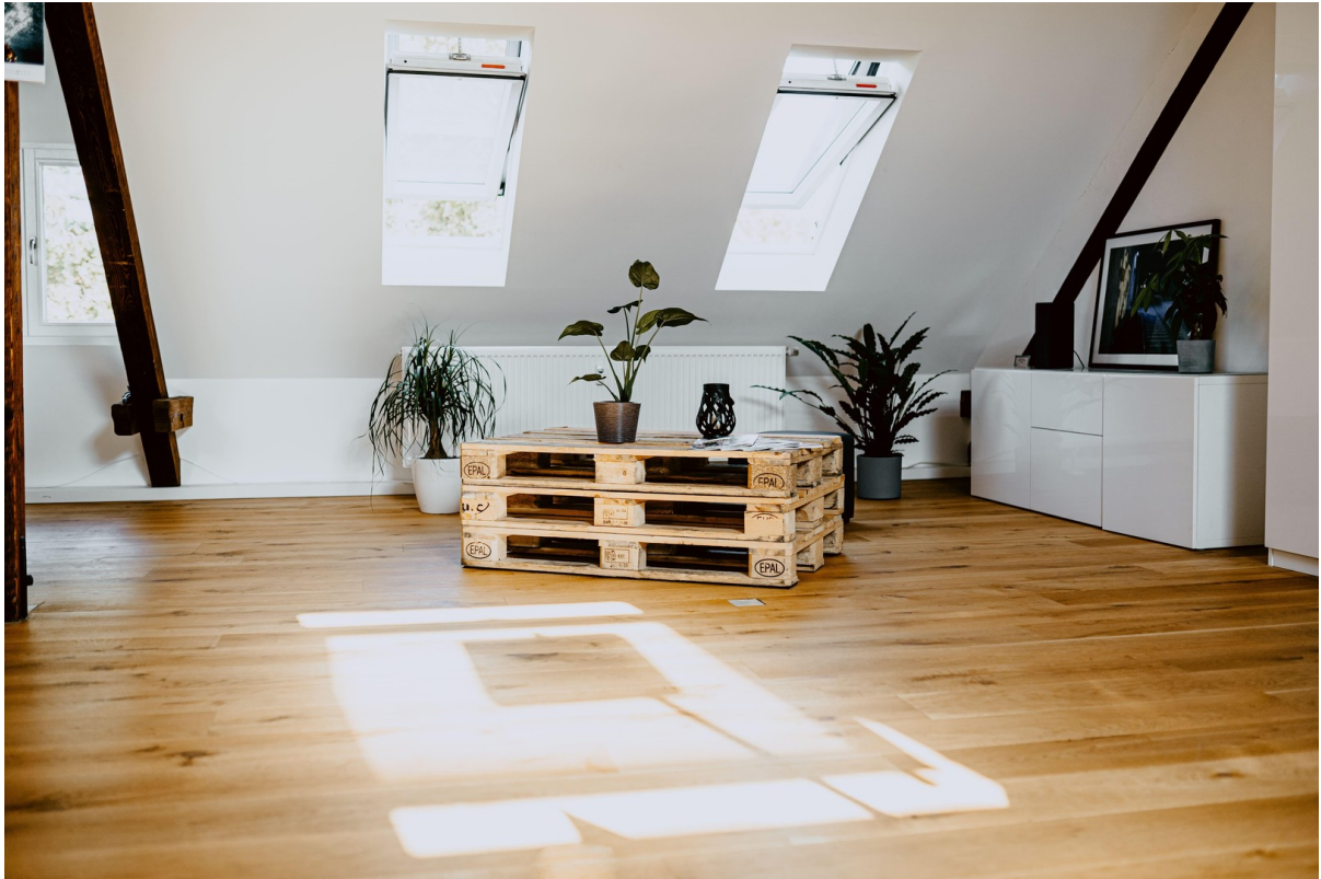
Empfang / Eingangsbereich