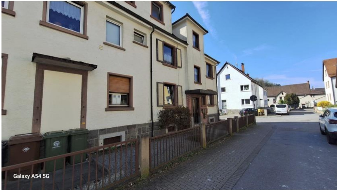
Frontansicht des Hauses