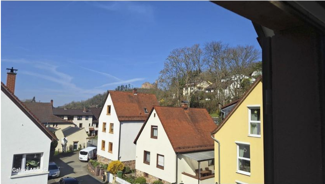
Ausblick auf Burg