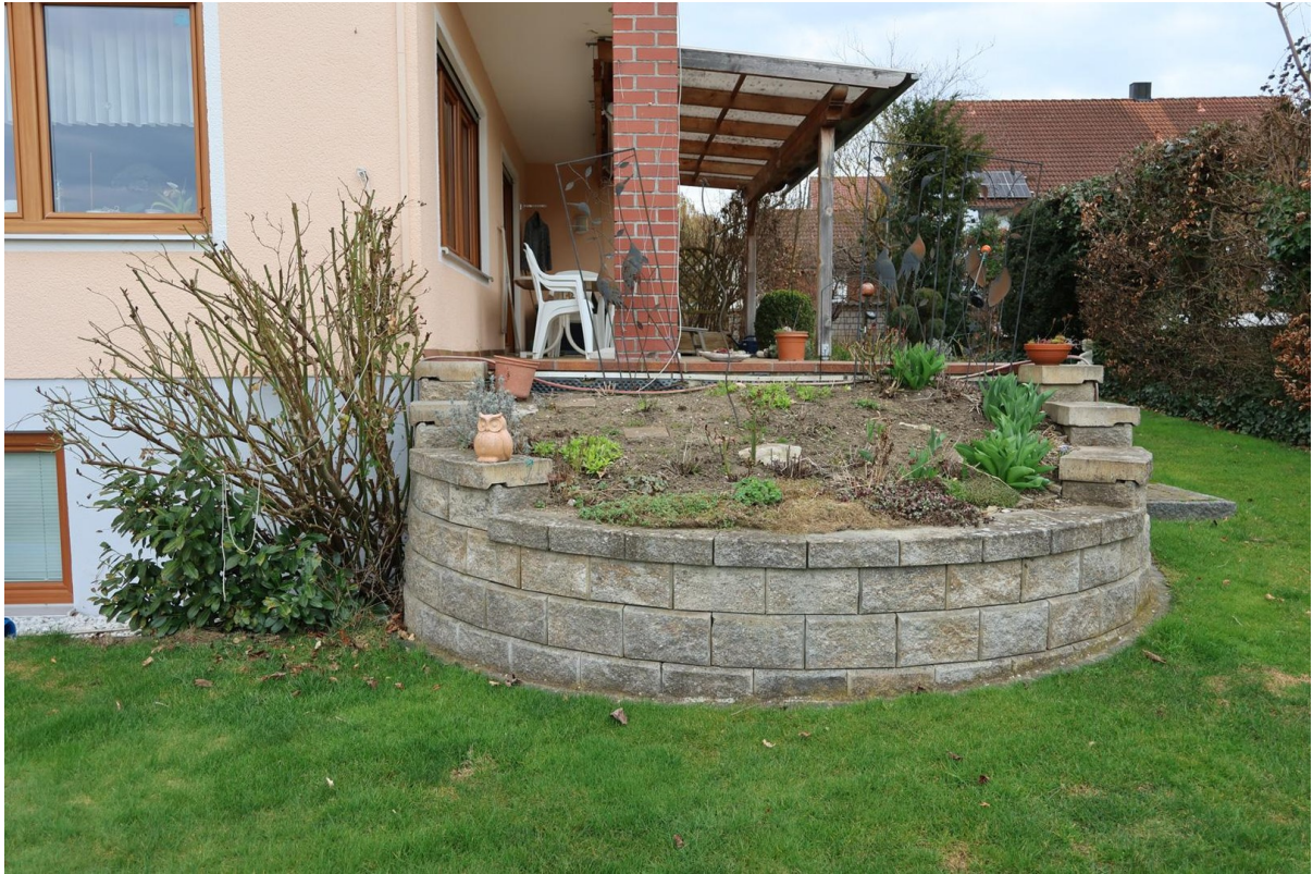
Blick auf Terrasse