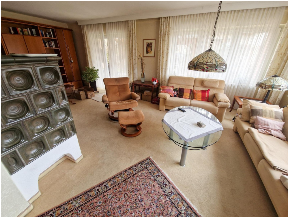
großes, helles Wohnzimmer