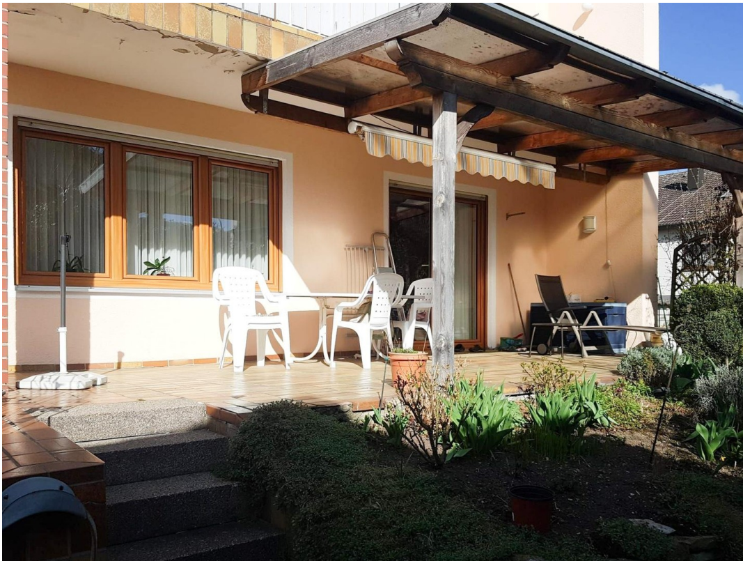
Blick auf Terrasse v. Süden