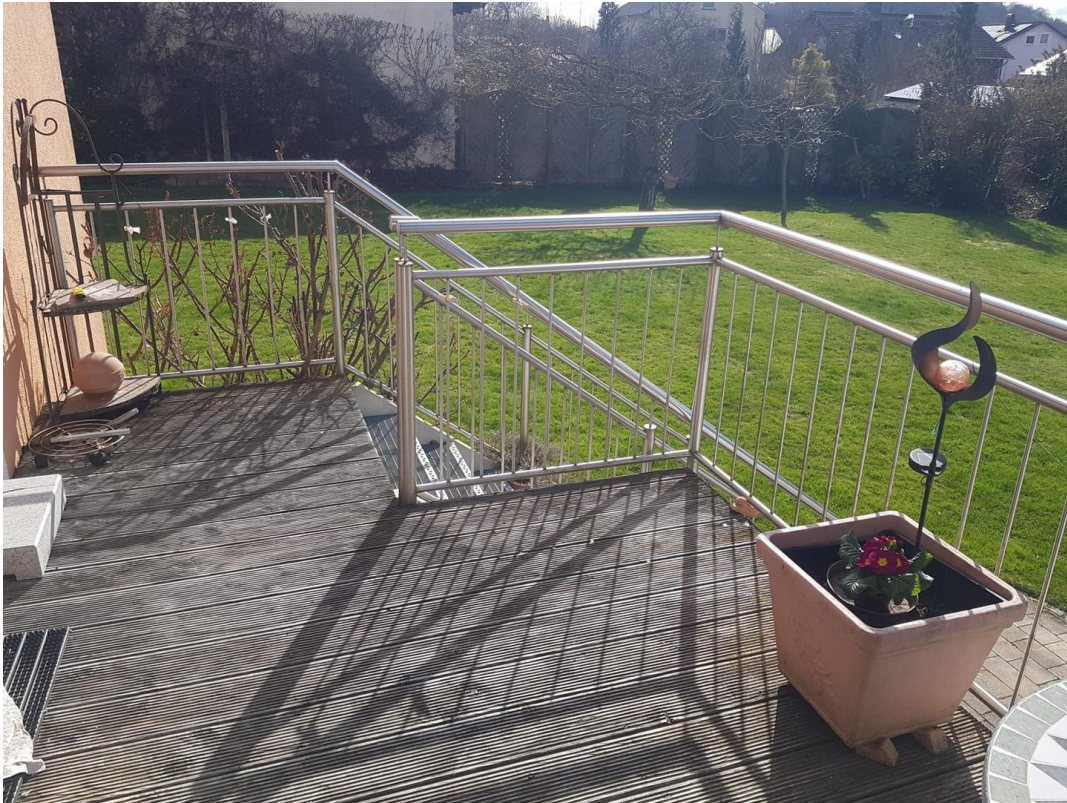
Terrasschen vor Küche