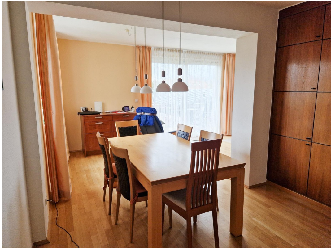
Esszimmer, Blick auf Anbau