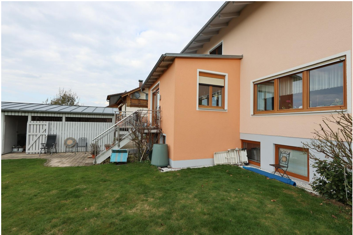
Blick auf Terrasse, Carport