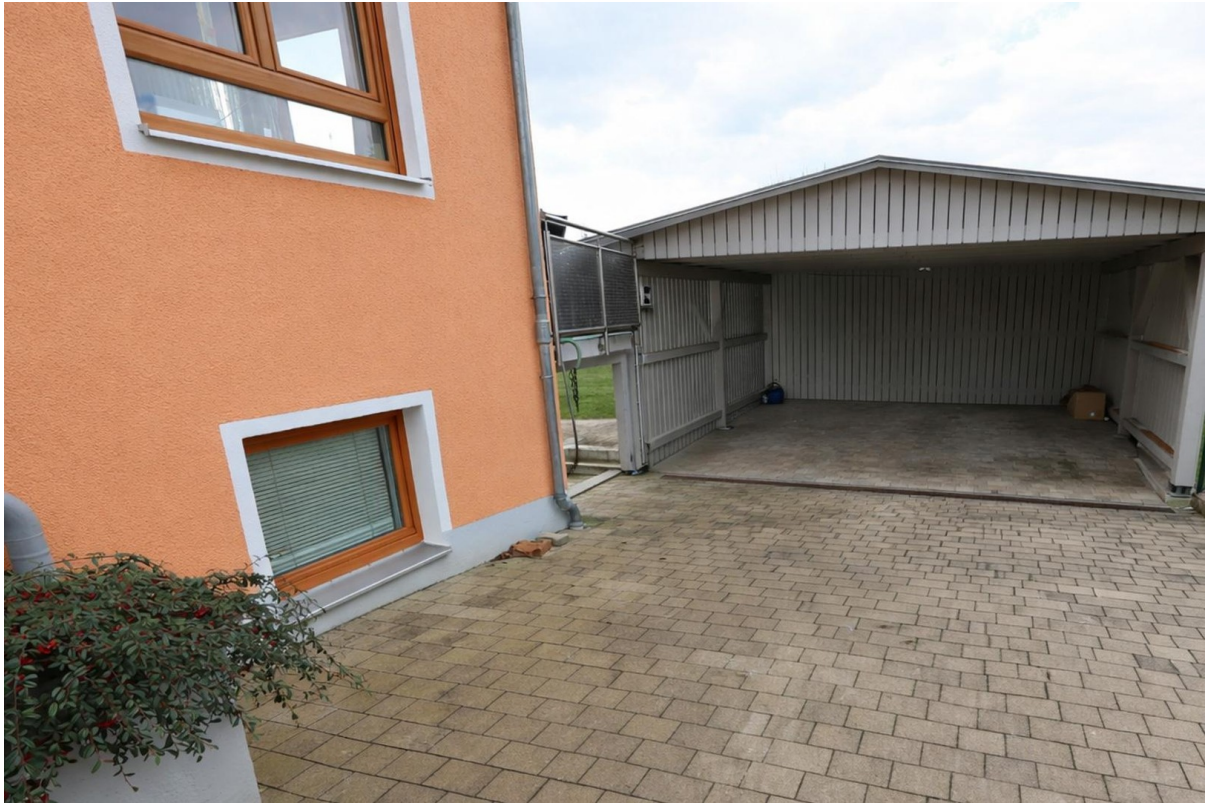
Einfahrt, Carport, Anbau