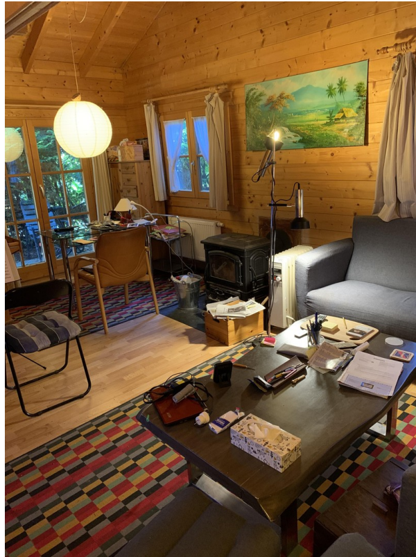
Innenraum mit Kamin