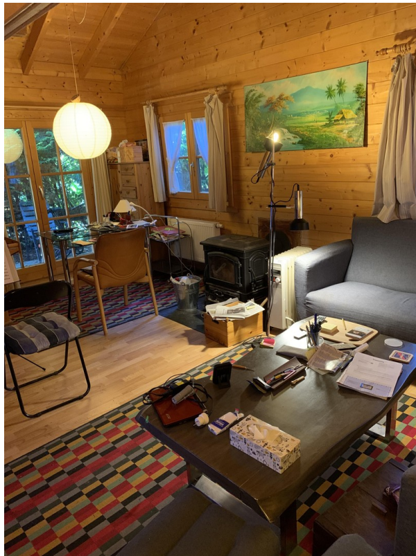
Innenraum mit Kamin