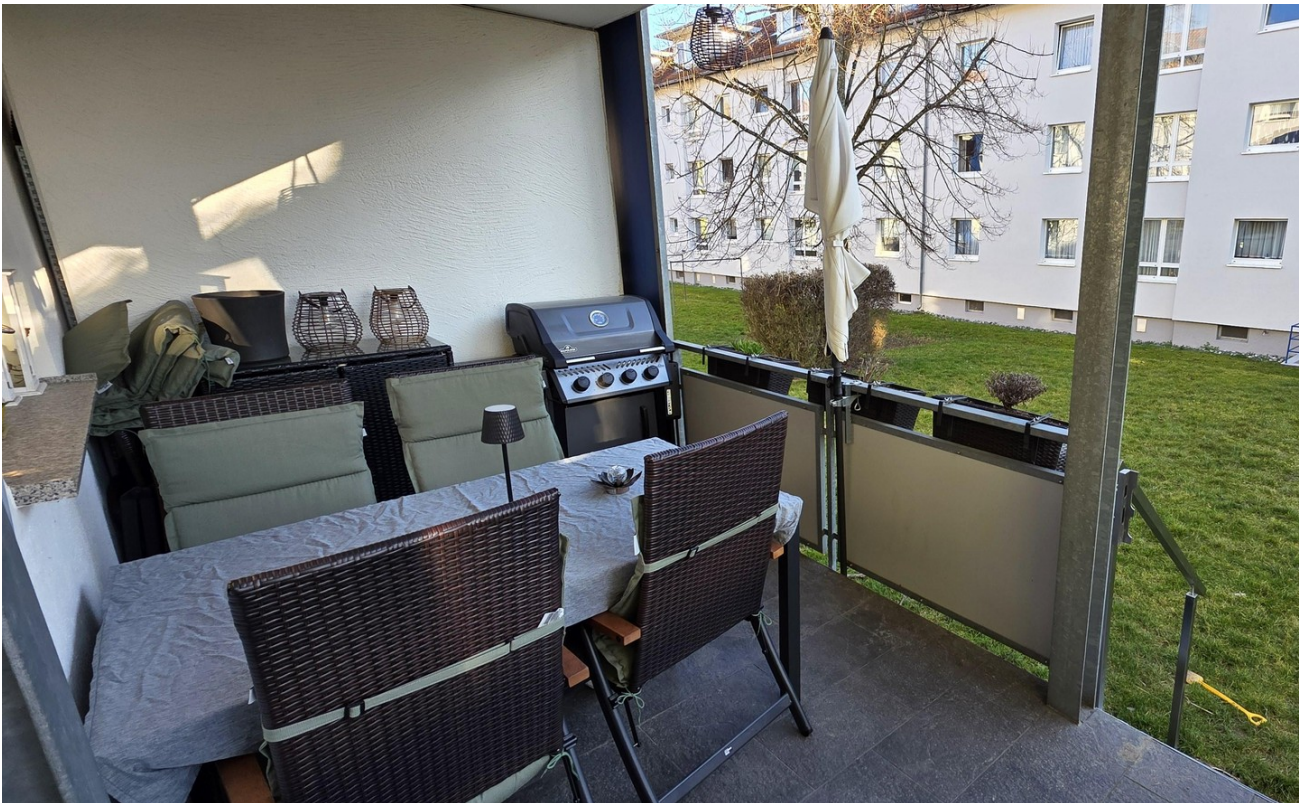
Balkon mit Gartenzugang