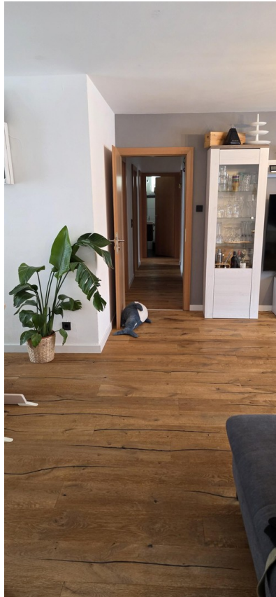
Blick zu den Räumlichkeiten