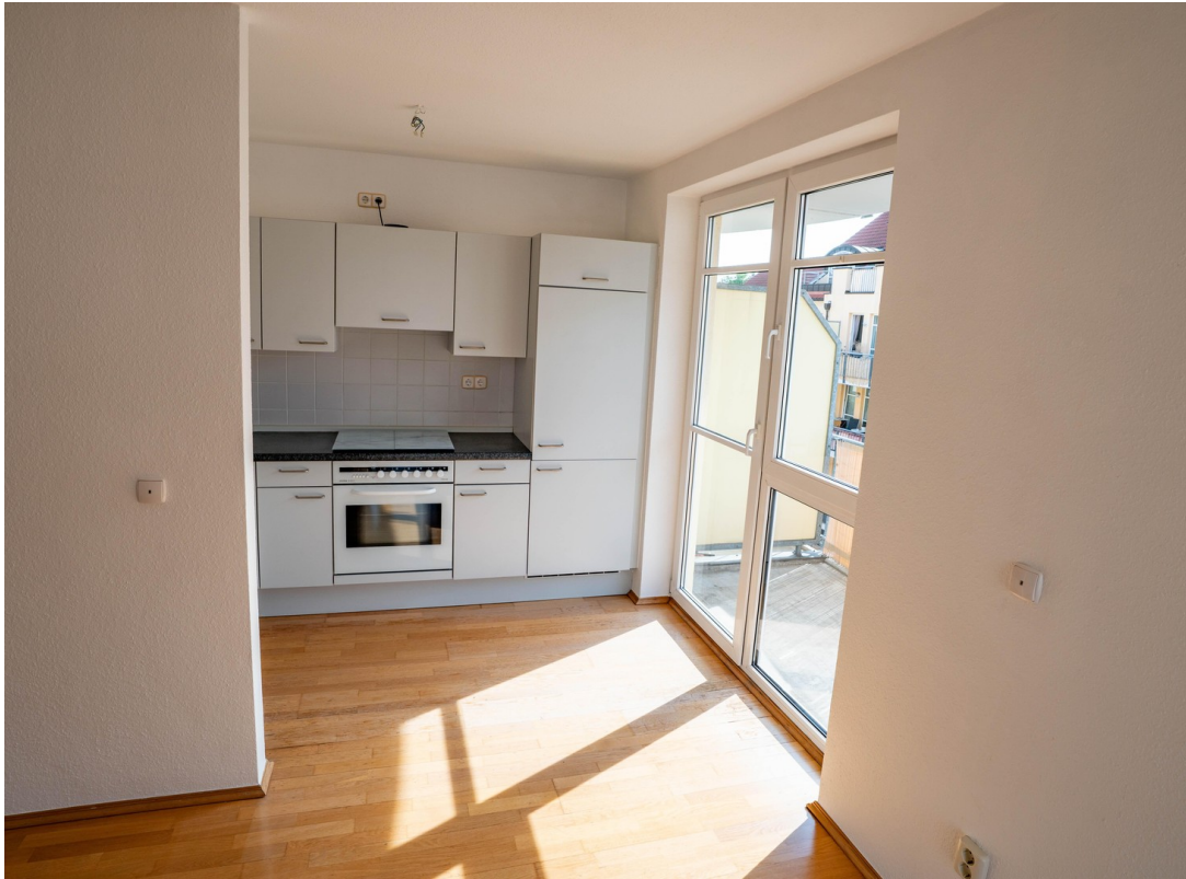
Küche mit Balkon