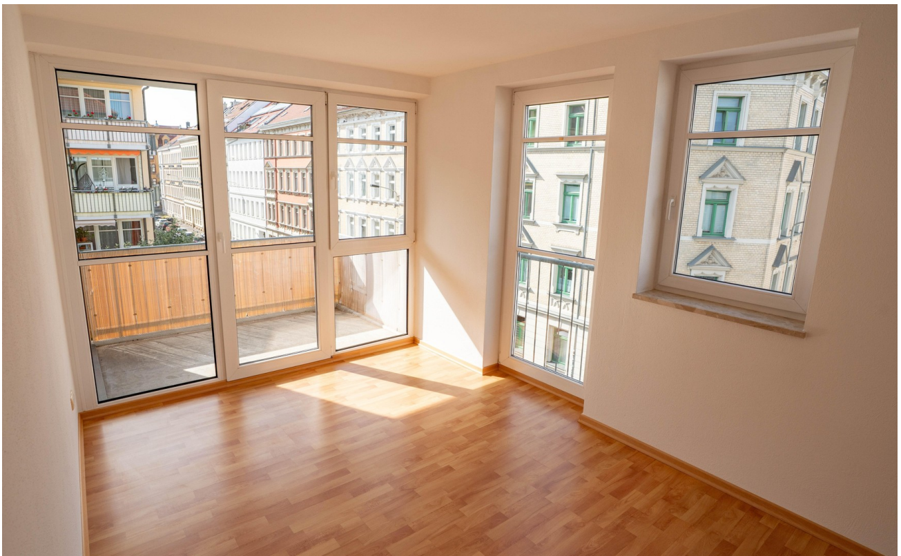
Blick Arbeits- /Kinderzimmer