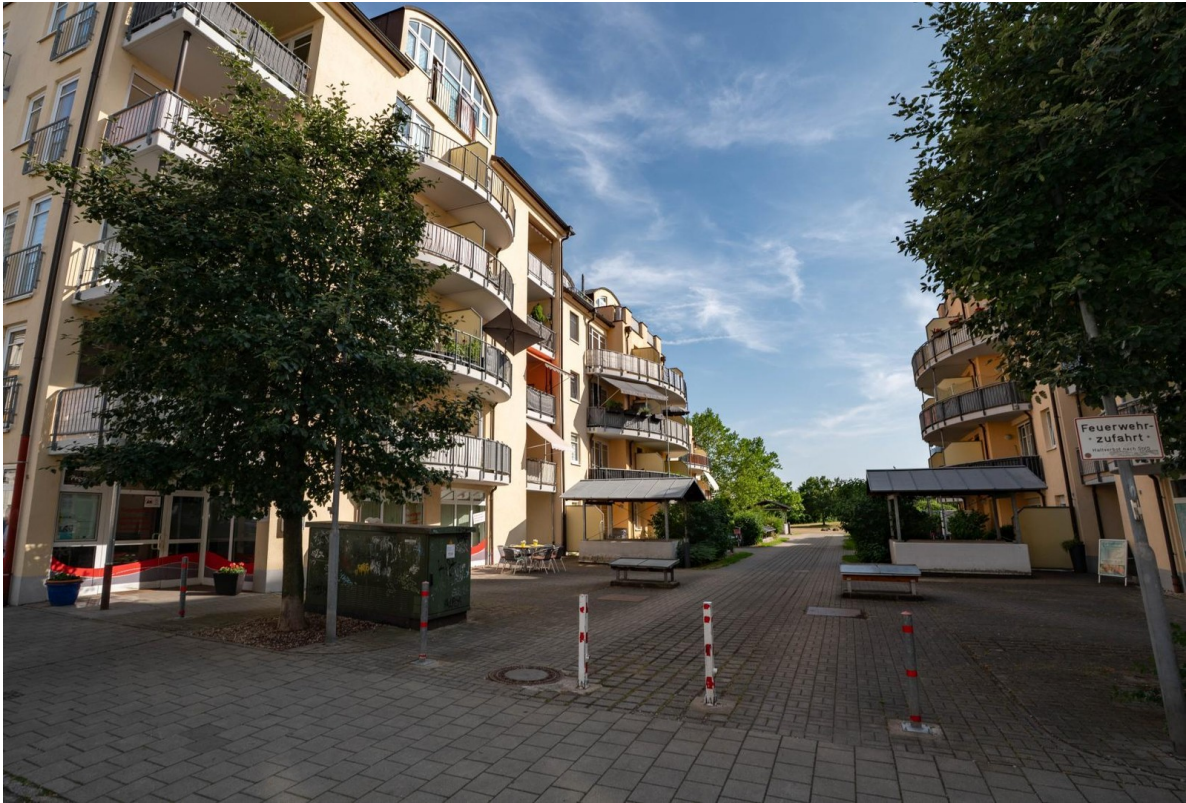
Blick in die Wohnanlage