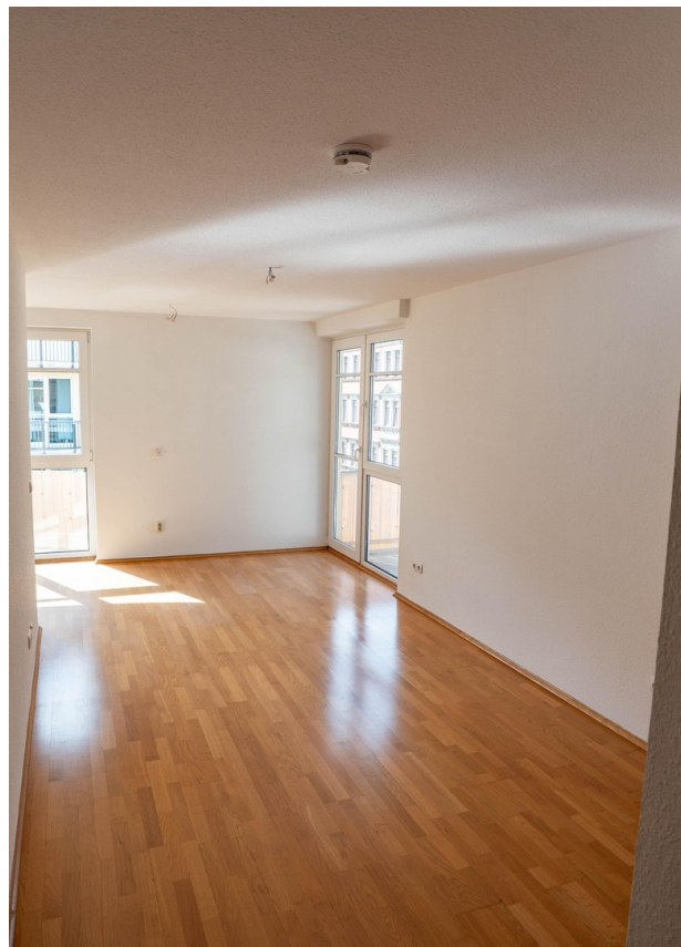
Blick ins Wohnzimmer