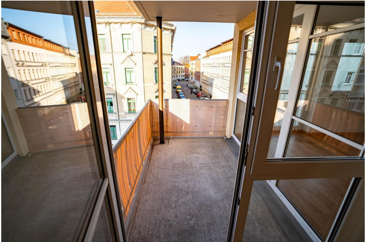
Balkon Zugang vom WoZi & AZi