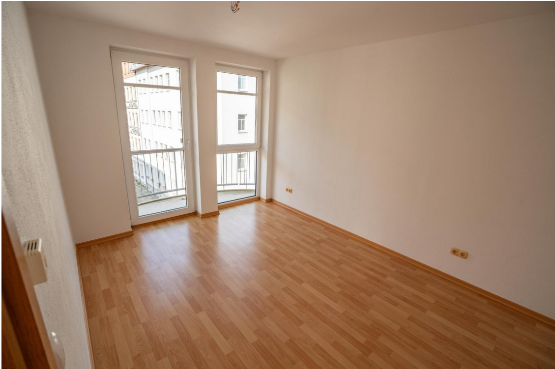
Schlafzimmer mit kl. Balkon