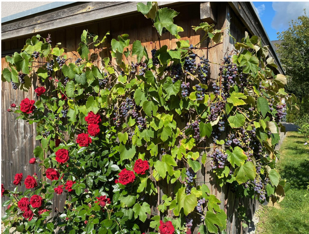
Schuppen mit Weinstock