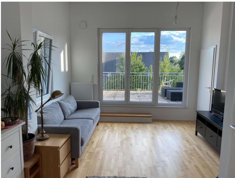
Dachgeschoss mit Dachterrasse