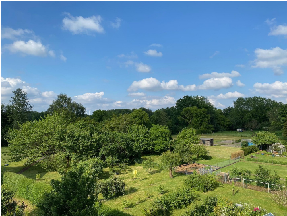
Aussicht von der Dachterrasse