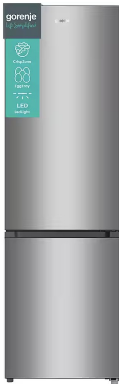
Kühls. oder Waschm. geschenkt!