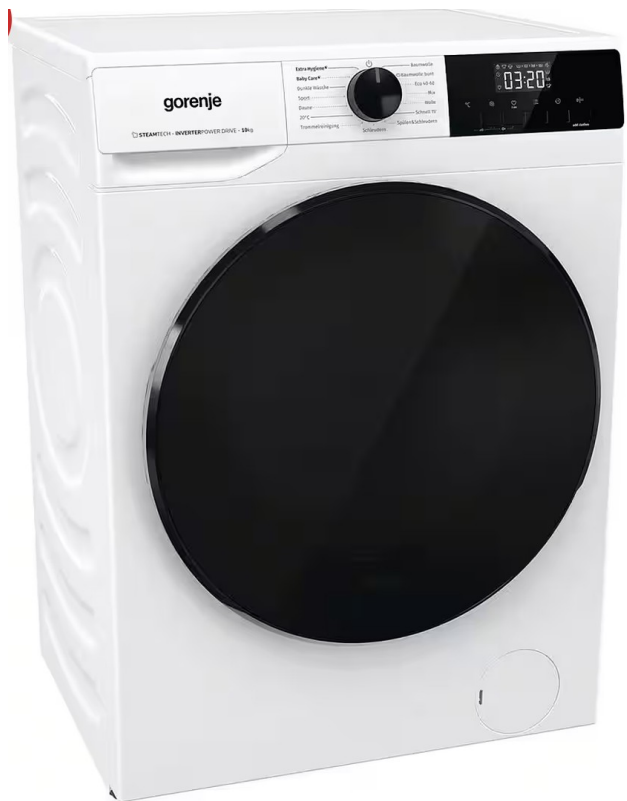
Kühls. oder Waschm. geschenkt!