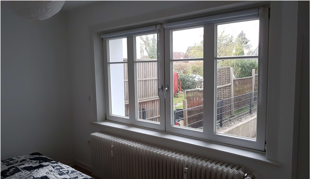
Blick aus Wohn-/Schlafzimmer