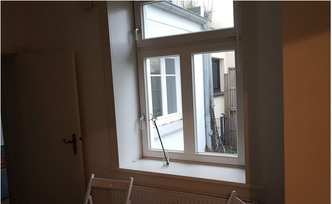
Blick aus der Küche