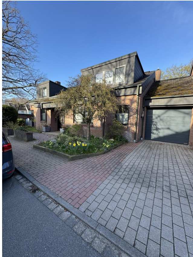
Haus von vorn