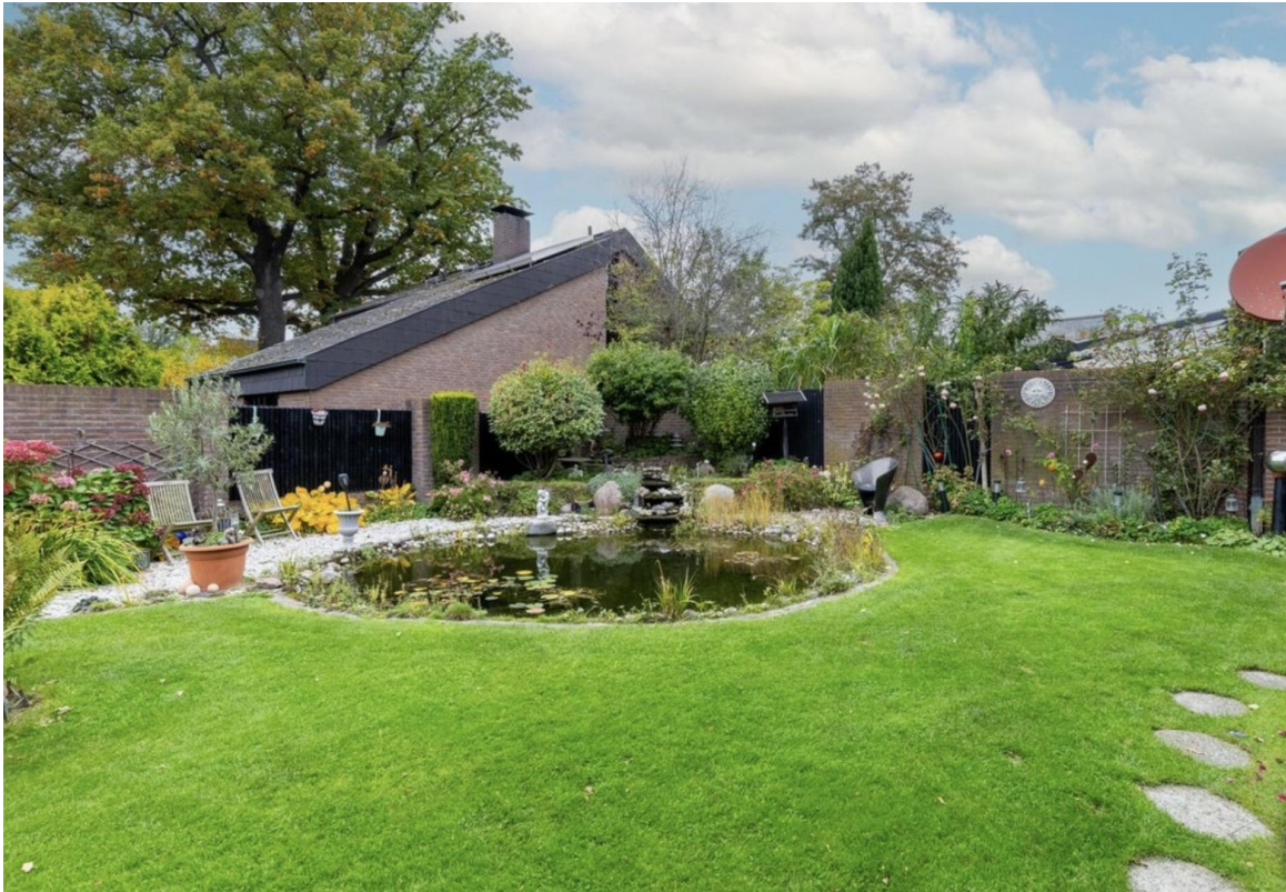
Blick Terrasse auf den Teich