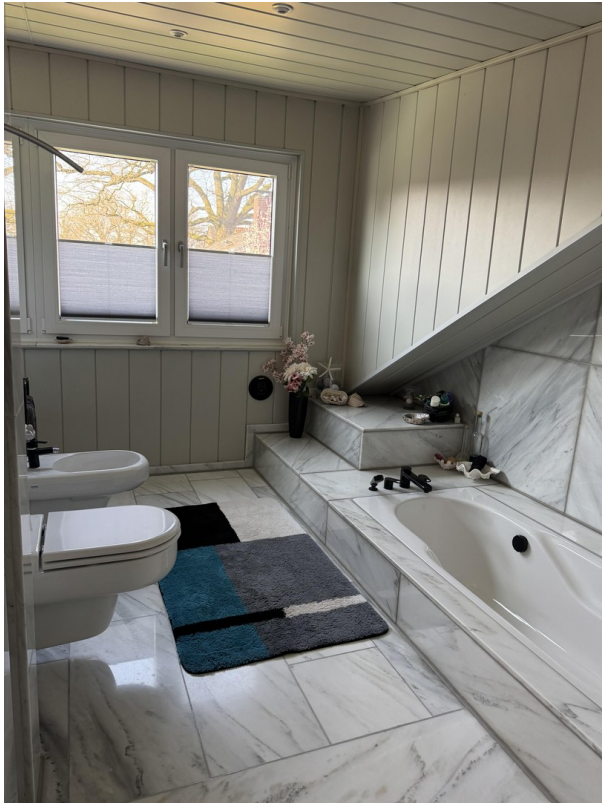
Badezimmer OG Badewanne