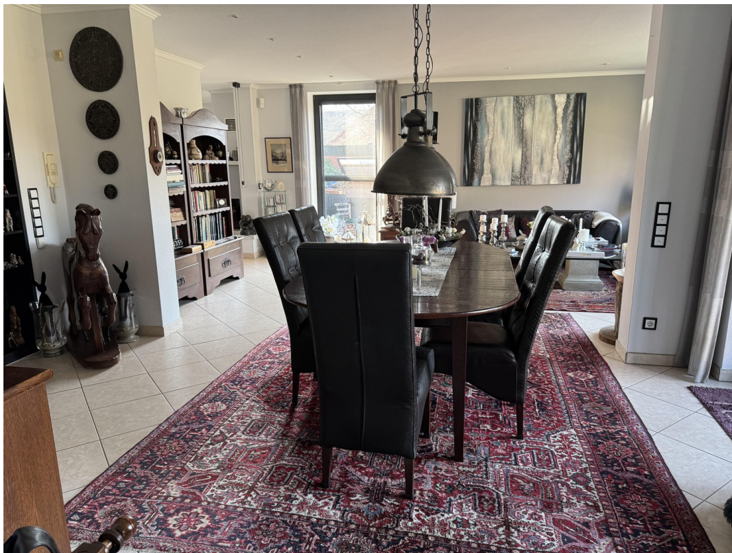
Esszimmer m. Blick Wohnzimmer