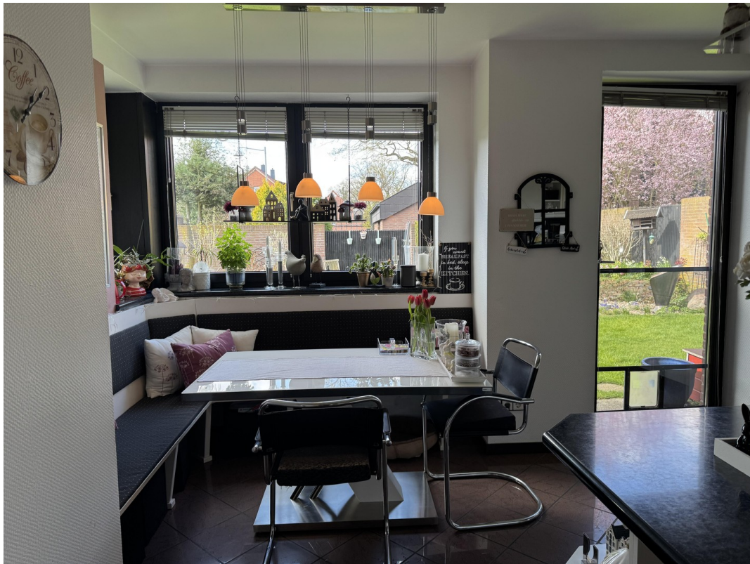
Sitzplatz mit Eckbank