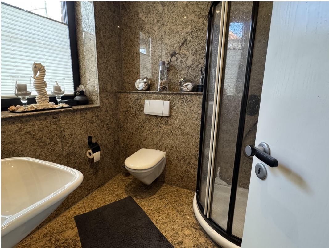
Gästebad mit Dusche