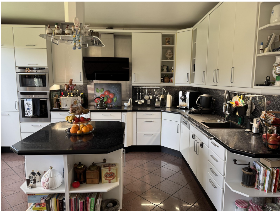
Einbauküche mit Mitteltresen