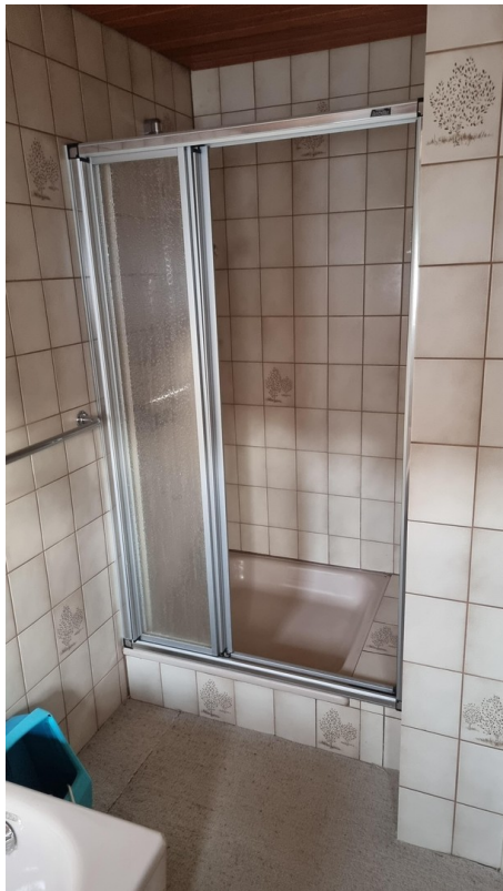
Dusche Bad DG