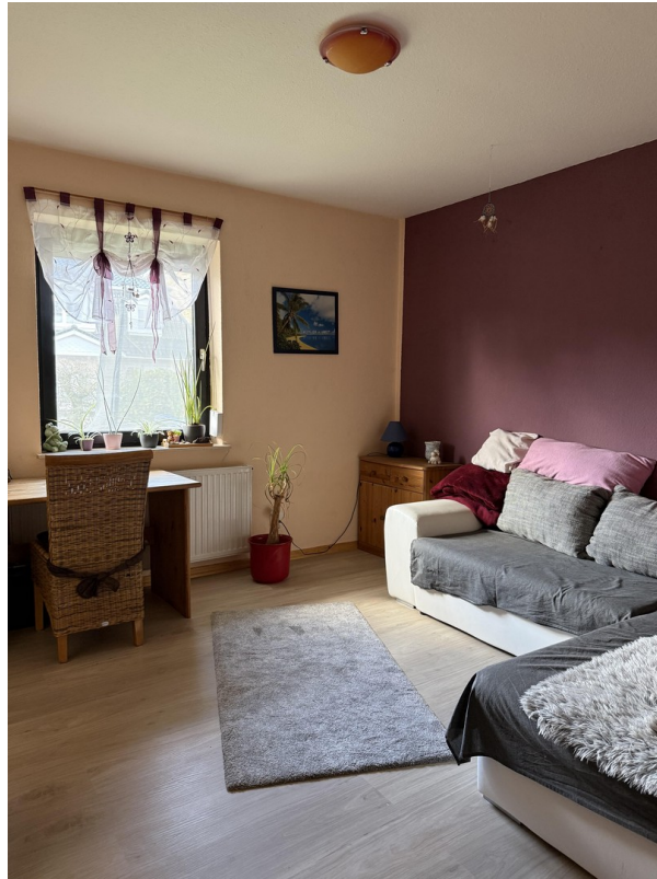
Zweites Zimmer unten