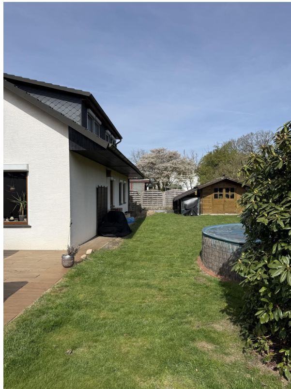
Rückseite Richtung Osten