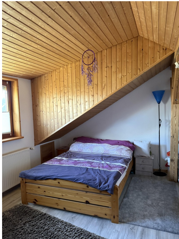
Zweites Zimmer oben