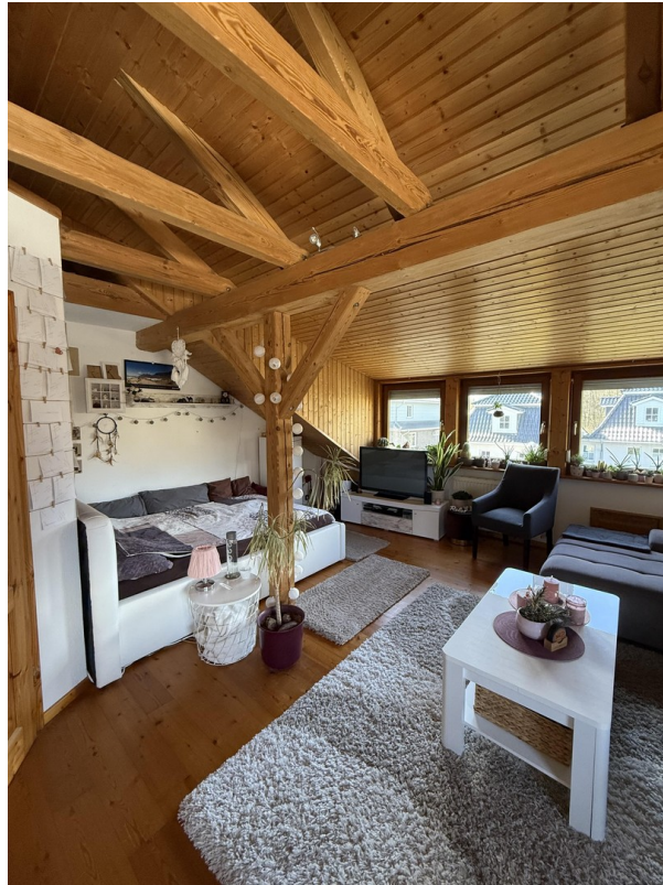
Erstes Zimmer oben