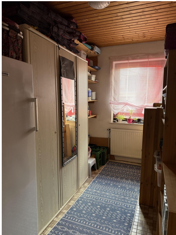
Kleines Zimmer unten