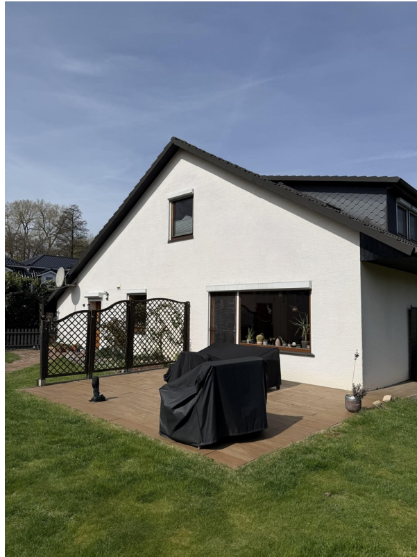
Südseite mit Terrasse