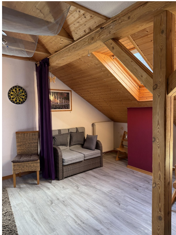
Drittes Zimmer oben