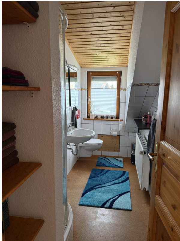
Badezimmer mit Dusche oben