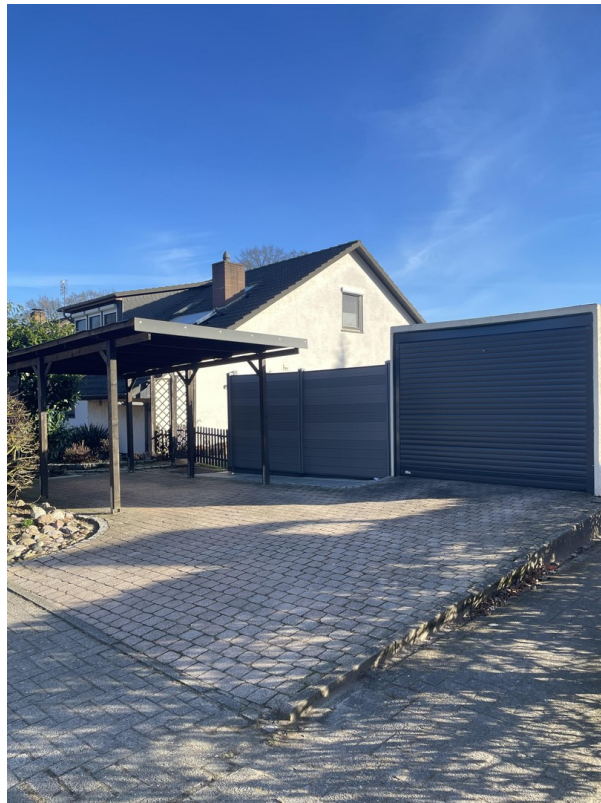
Carport und Garage