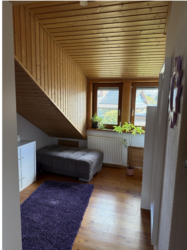
Kleines Zimmer oben