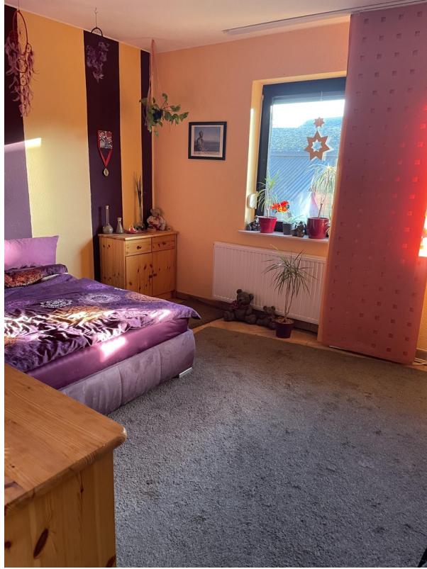
Erstes Zimmer unten