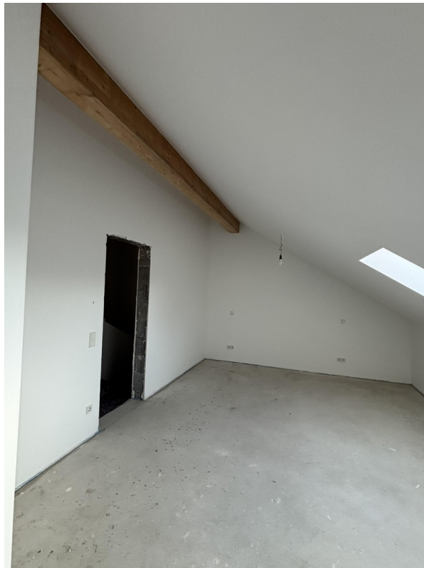
W2 Grundriss DG