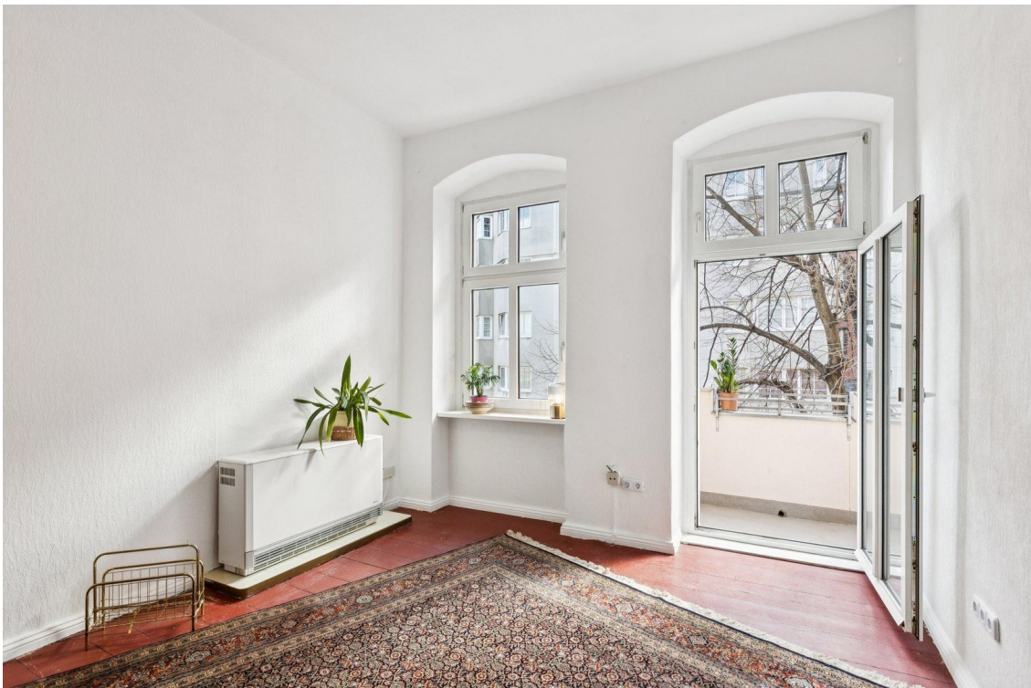
Zimmer 1, Balkon