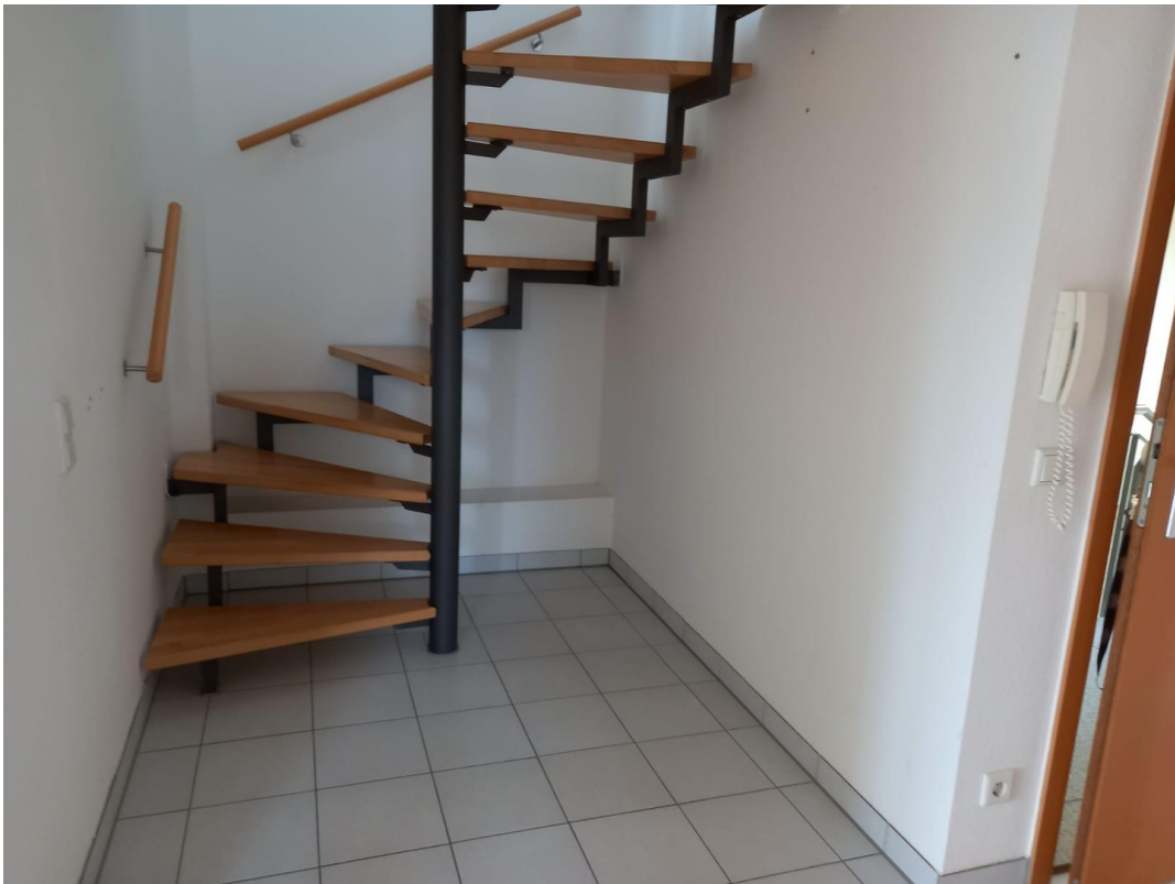
Treppenaufgang in Dachgeschoss