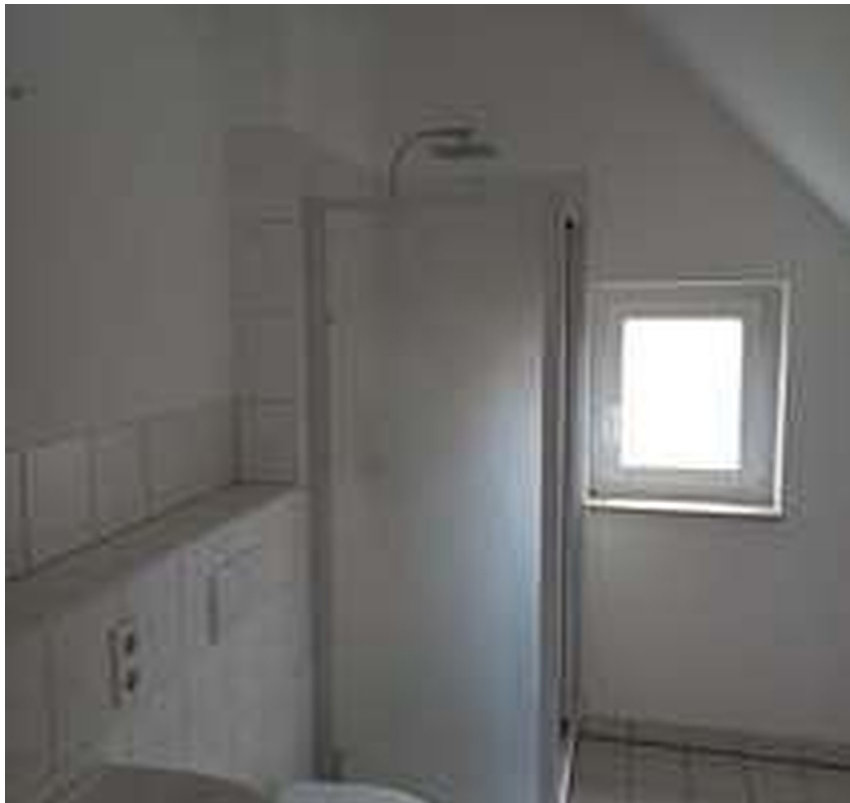
2. Bad im Dachgeschoß