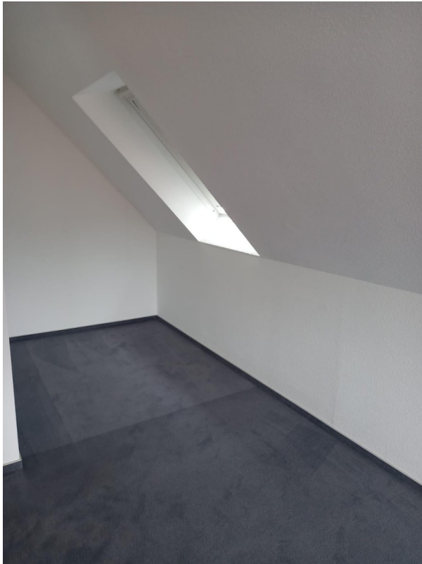
Vorraum im Dachgeschoß