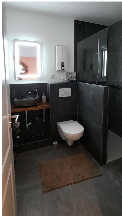
Bad und Dusche