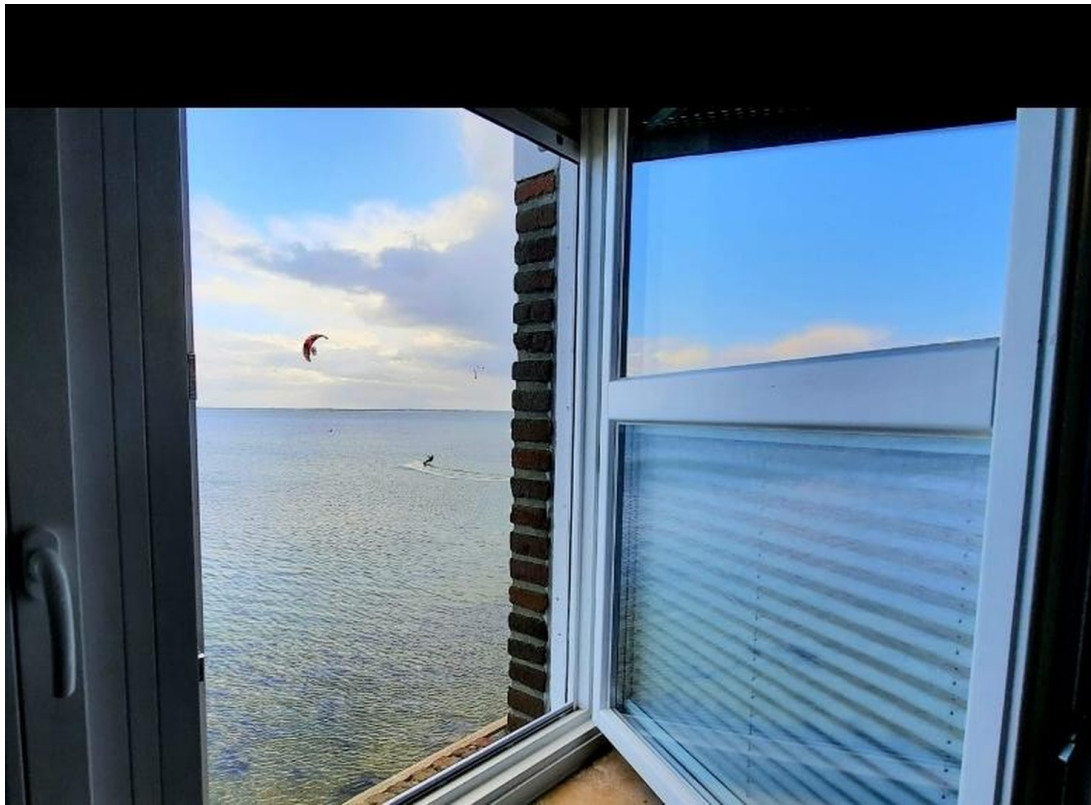
Blick auf Ostsee und Kiter