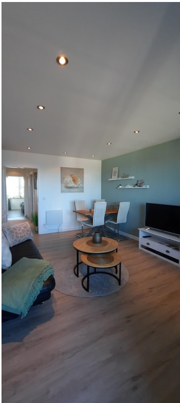
Wohnzimmer m Blick z SZ