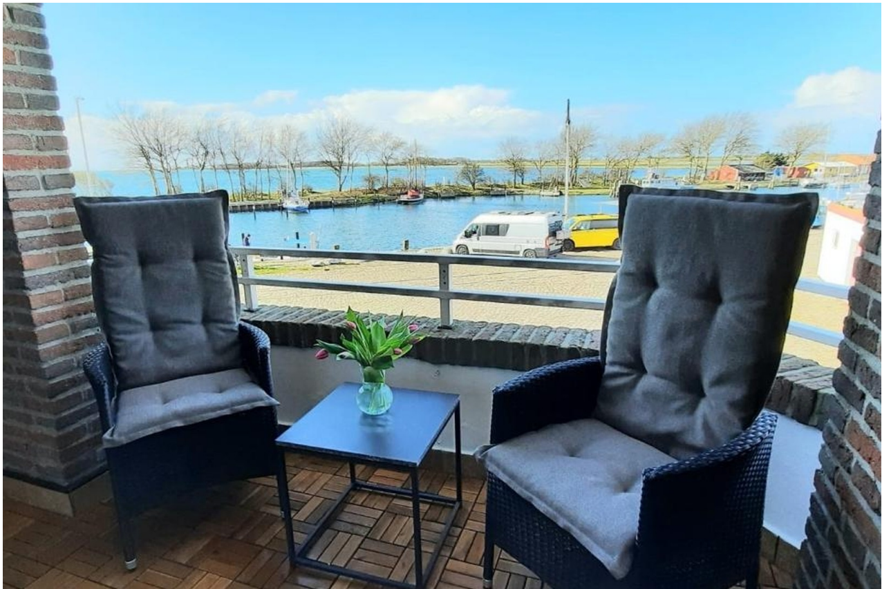
Blick vom Balkon auf den Hafen