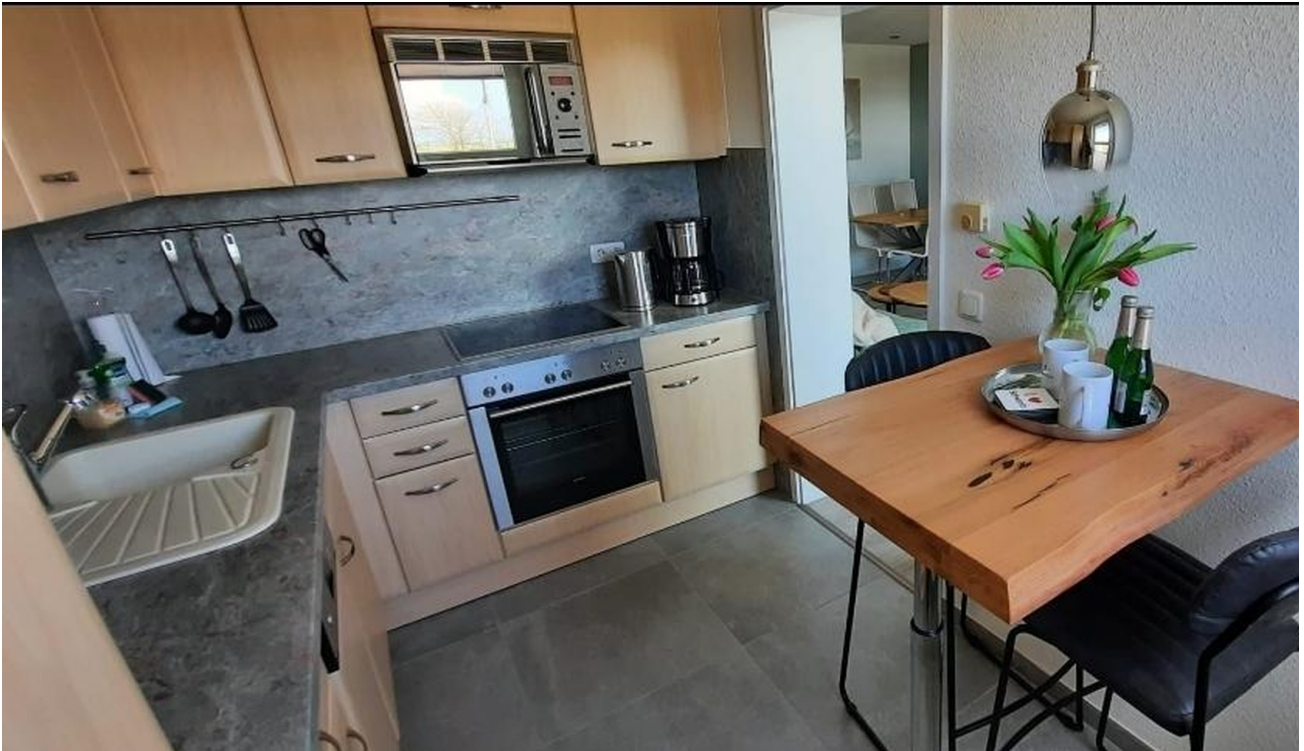
Küche mit Blick auf den Hafen