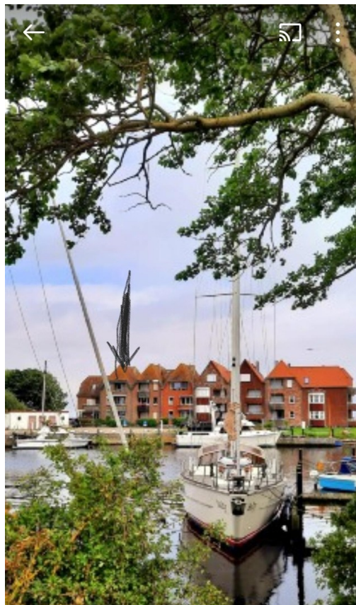
vom Hafen m Blick zum Haus