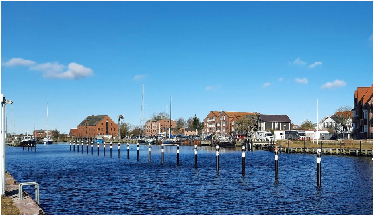
Segeleinfahrt zum Hafen