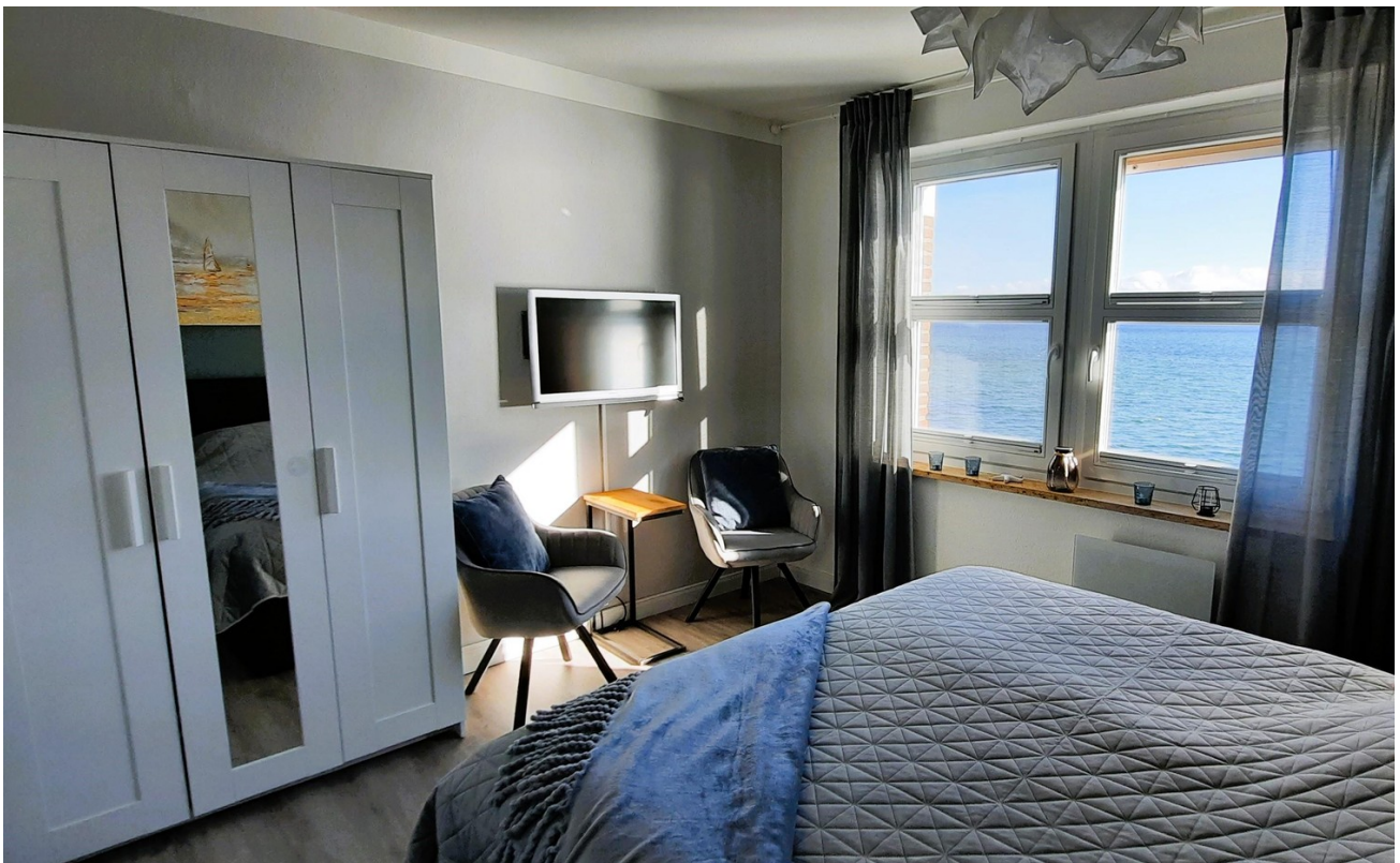
Schlafzimmer, Sonne am Morgen