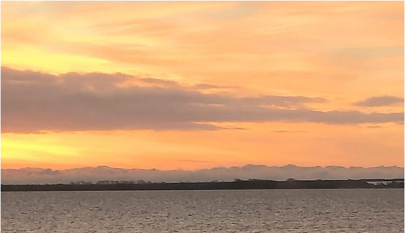
Blick auf die Fehmarnsundbrück