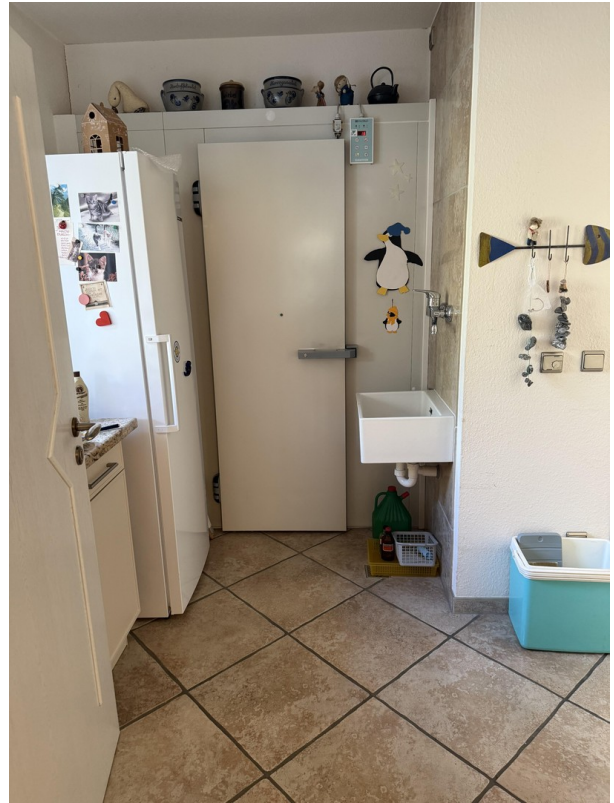
HWR mit Kühlzelle