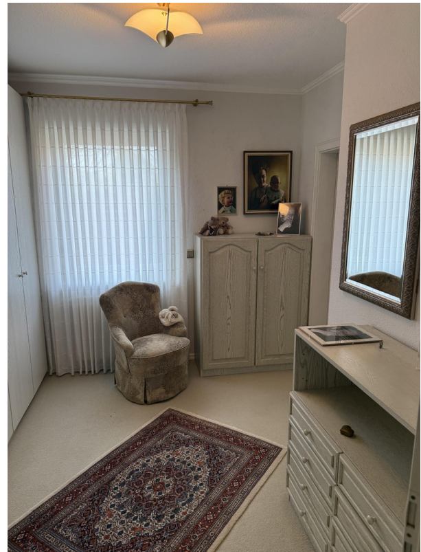
Zugang zum Bad/Ankleidebereich