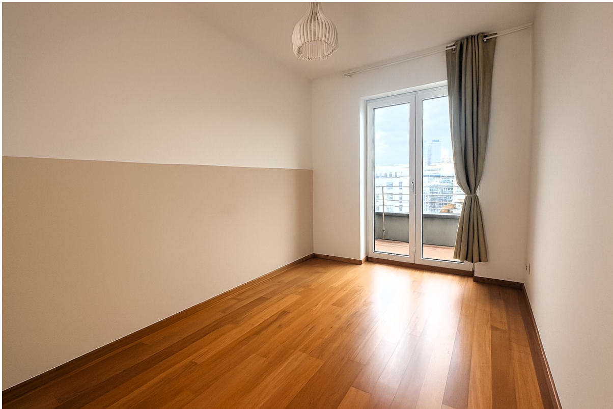
Kinderzimmer 1 leer