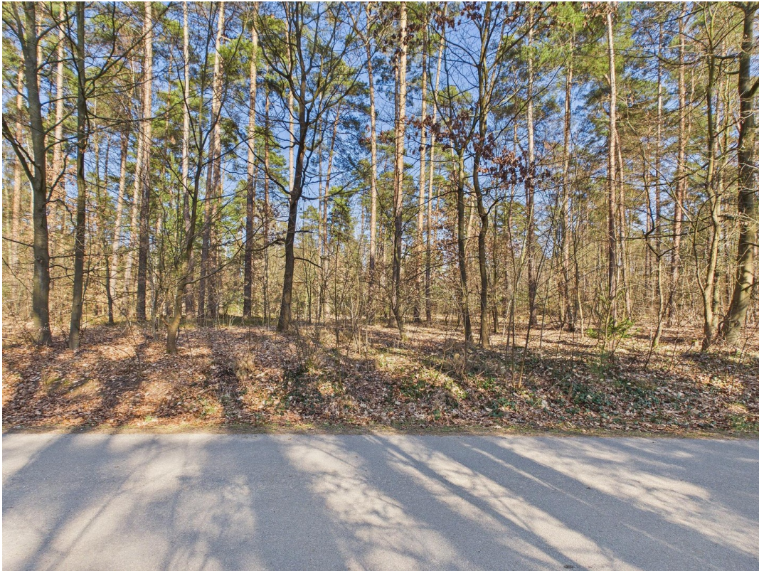
Blick ins Grüne (waldnähe)