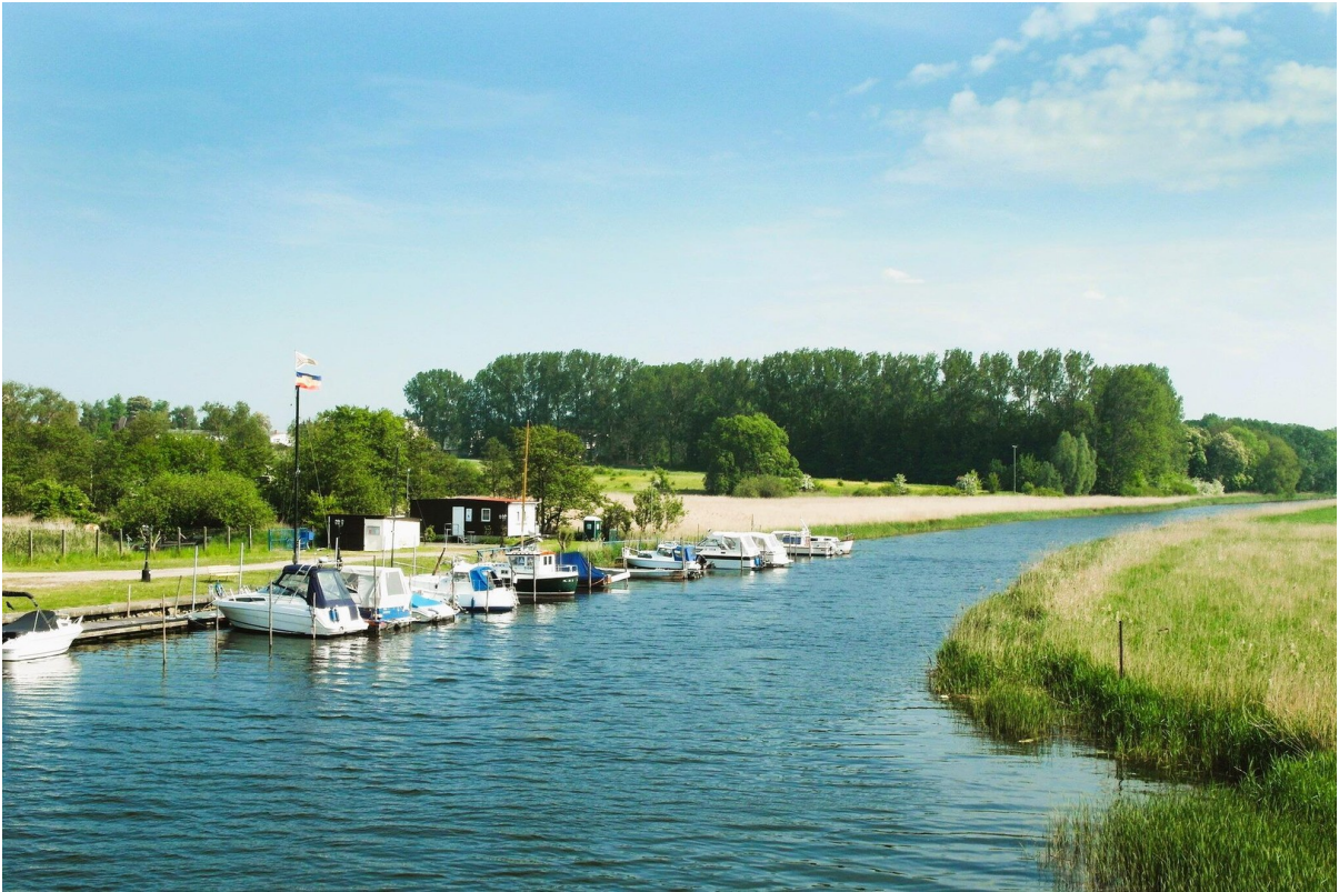
Marina mit Zugang zur Ostsee