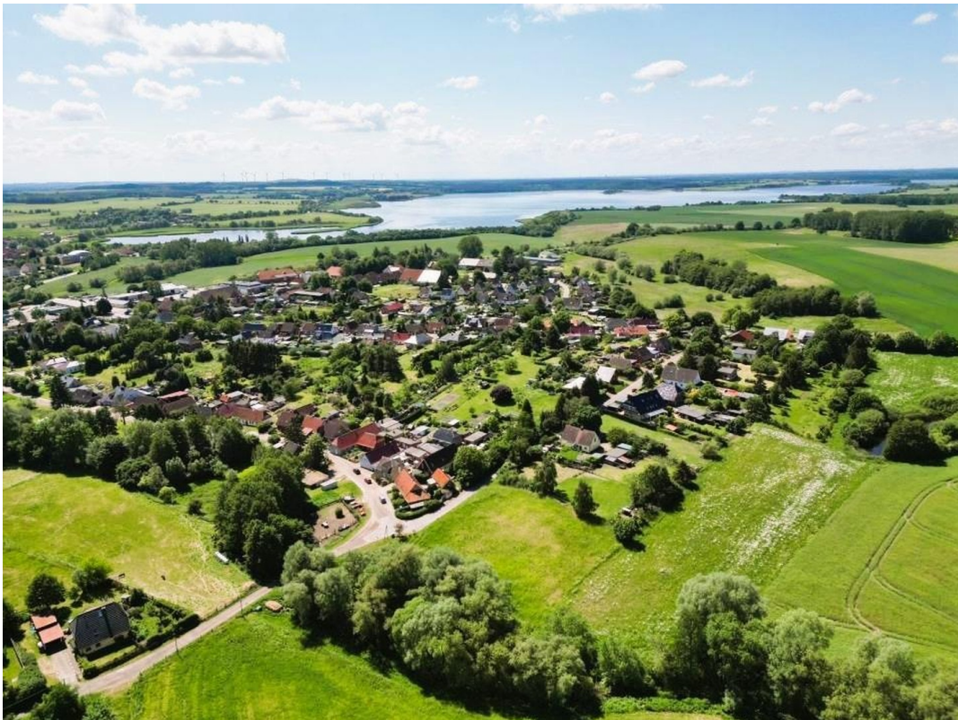
Reichweite bis Travemünde