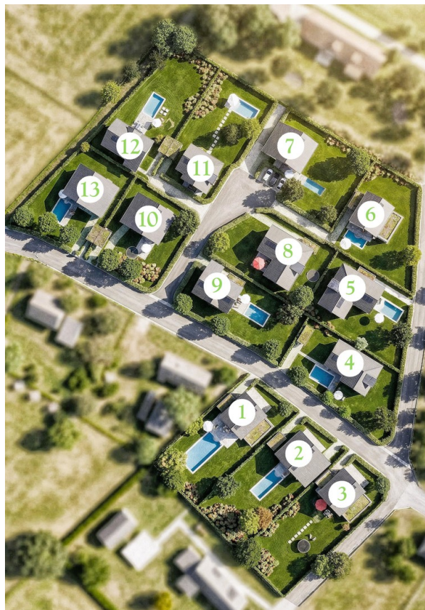
Lageplan / Bezeichnung