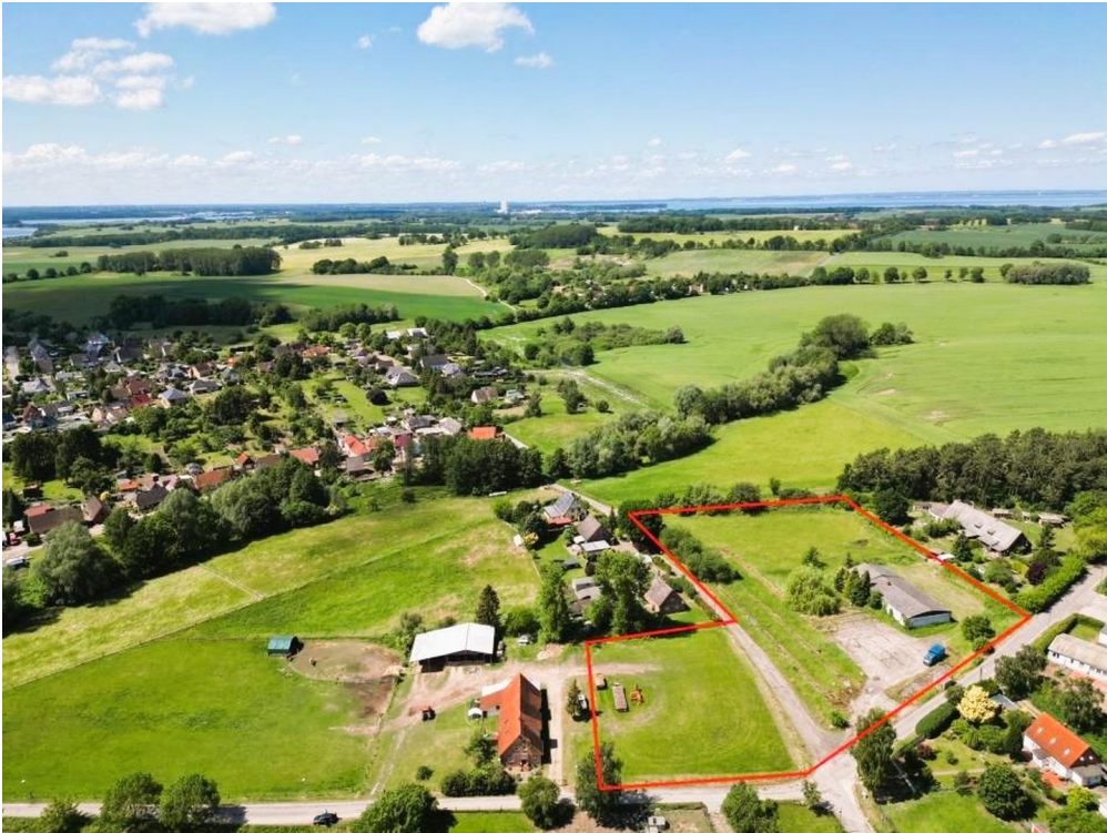
Baufeld Richtung Travemünde