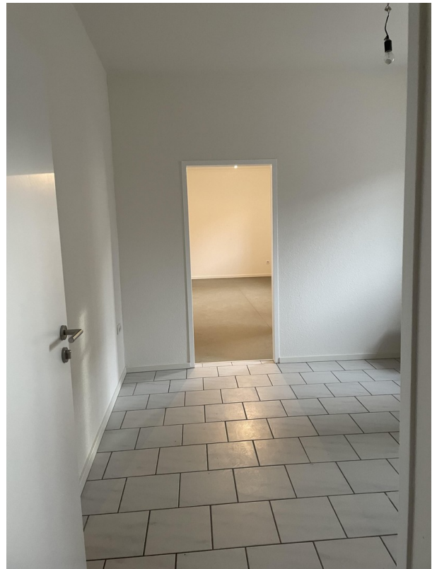
Büro 2.) Eingang