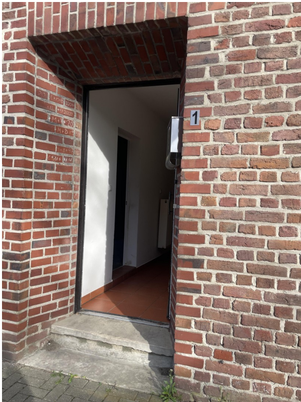
Nebeneingang zu Büro 2.)