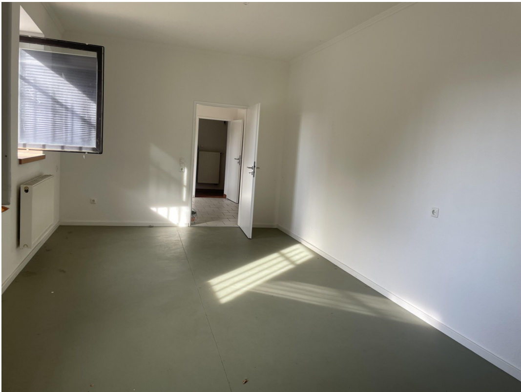
Büro 2.) zweites Zimmer