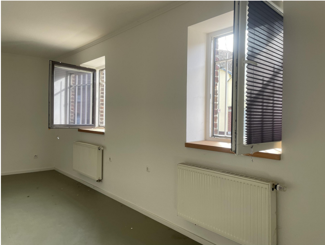
Büro 2.) helle Räumlichkeiten