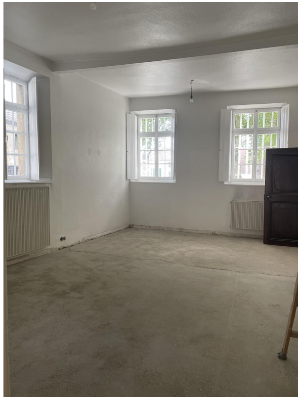
Büro 1.) kleineres Zimmer