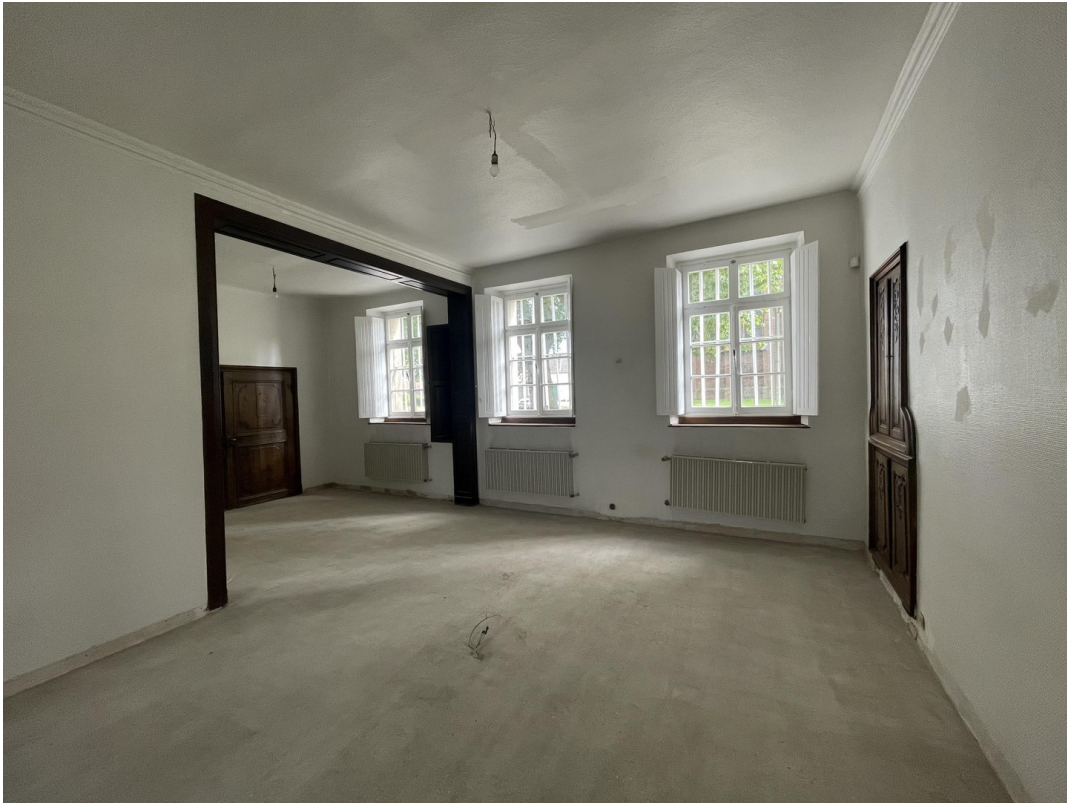
Büro 1.) großes Zimmer