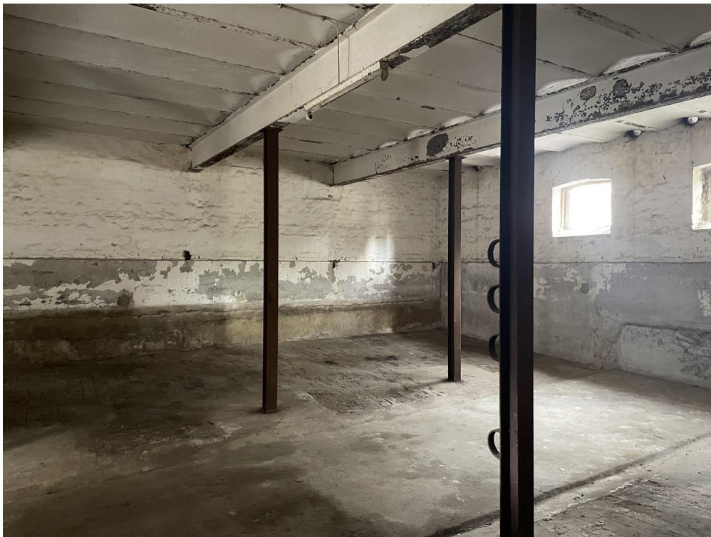
Lagerfläche Ca. 100m 2