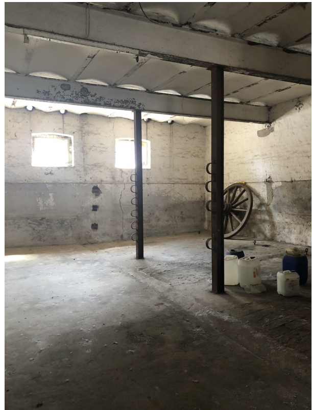
Lagerfläche Ca. 100m 2