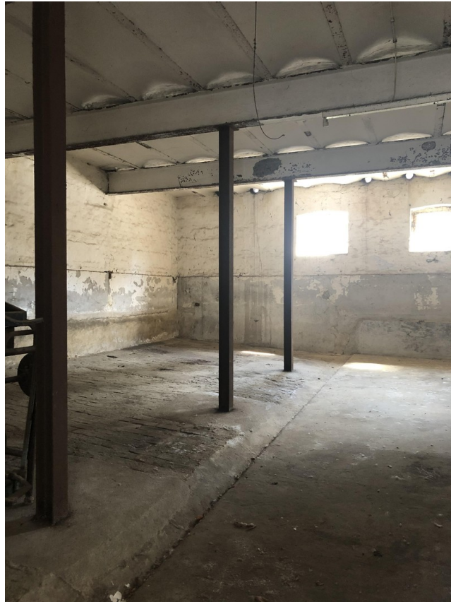
Lagerfläche Ca. 100m 2