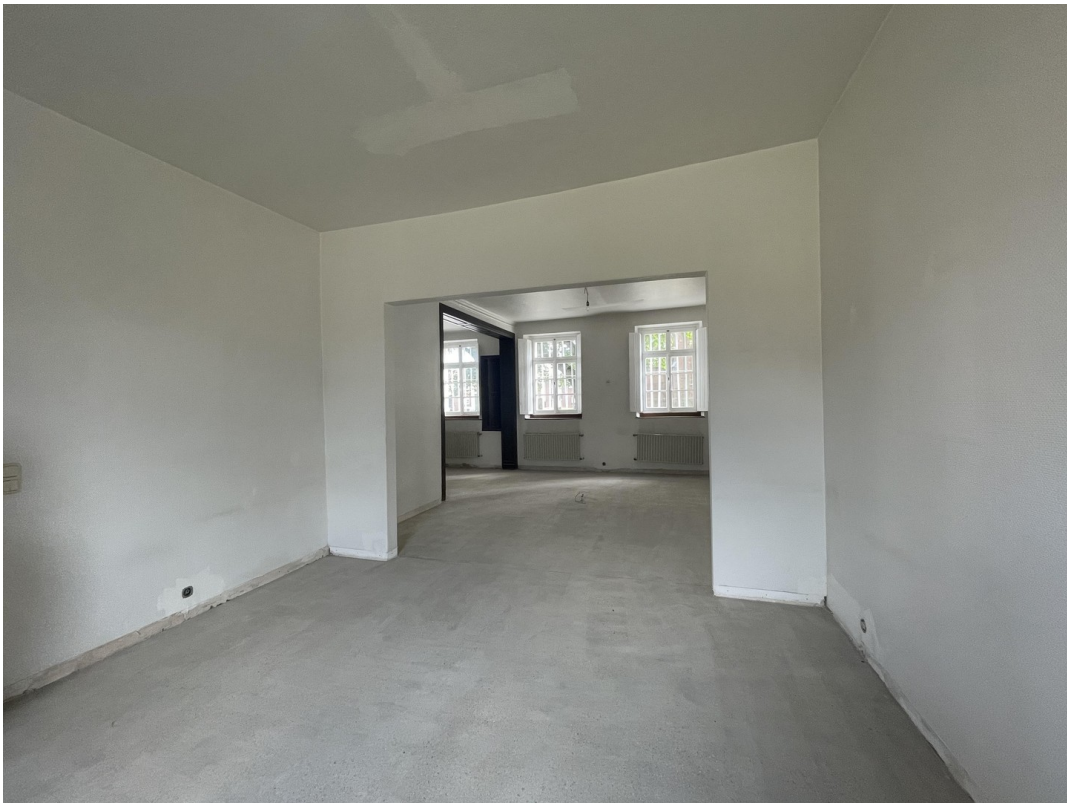
Büro 1.) großes Zimmer