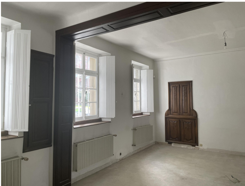
Büro 1.) großes Zimmer