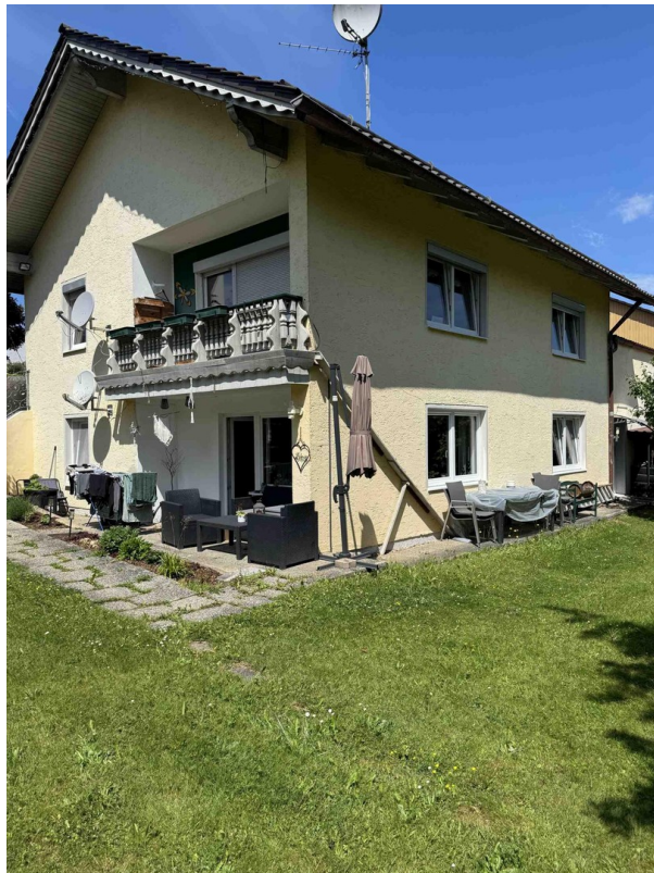
Sicht Wohnung vom Garten aus