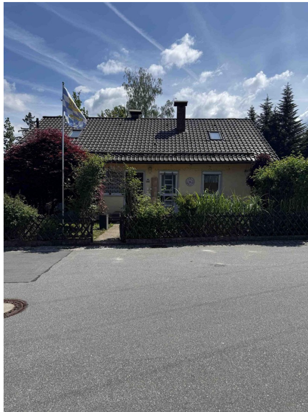
Haus Waldstrasse 33