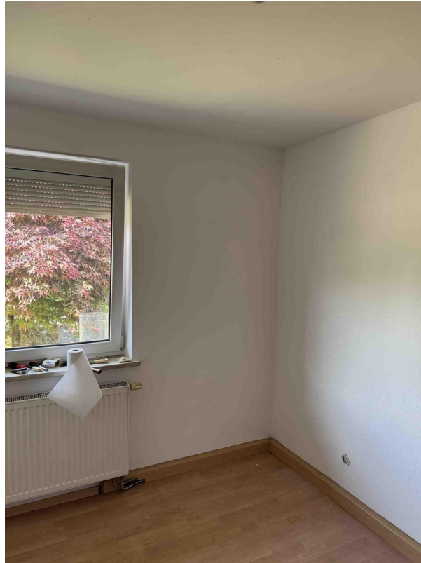
Büro oder Kinderzimmer