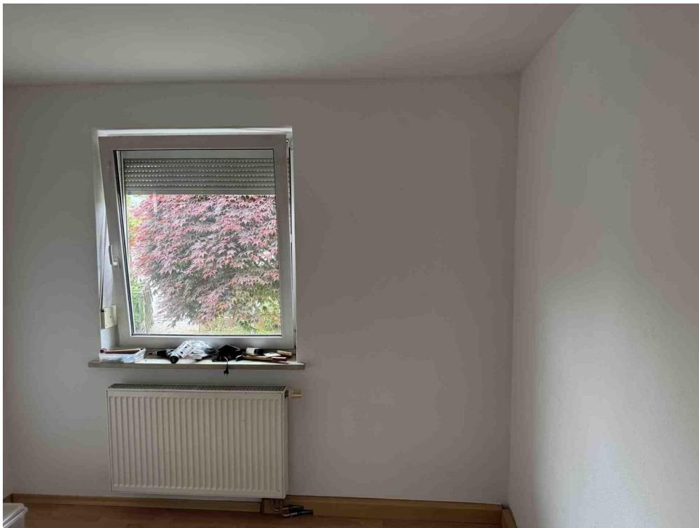
Büro oder Kinderzimmer