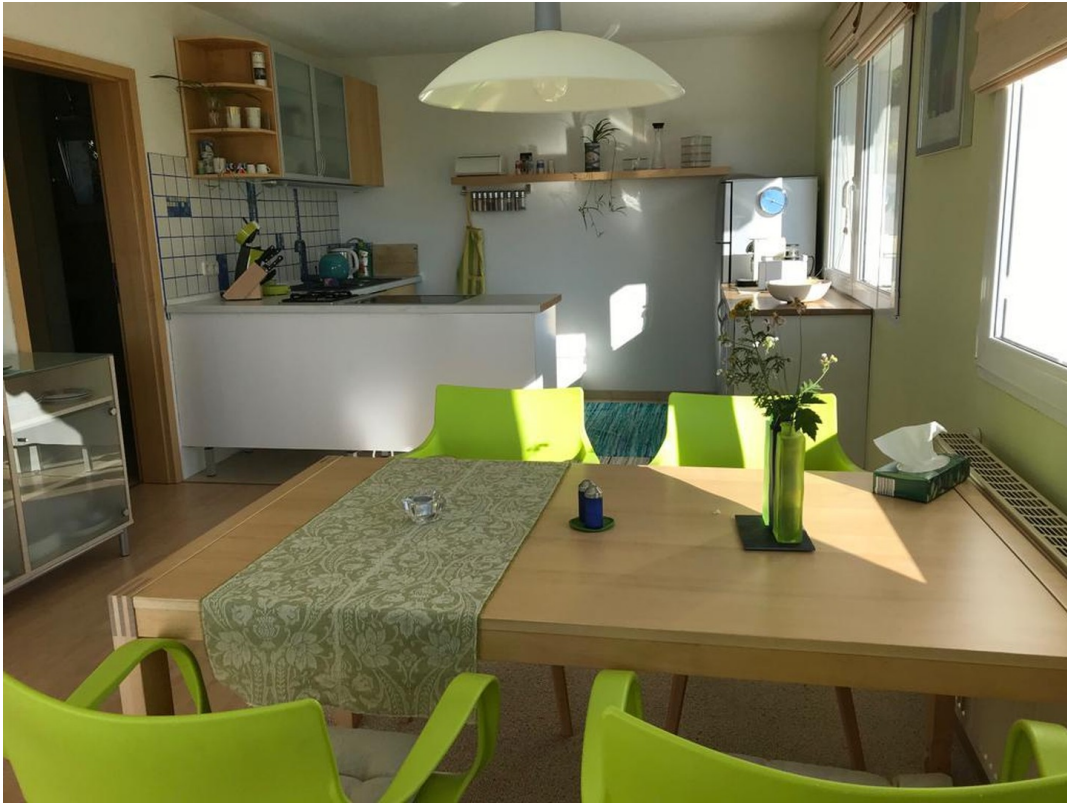
EG Küche und Essen