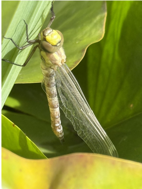
neues Leben am Teich