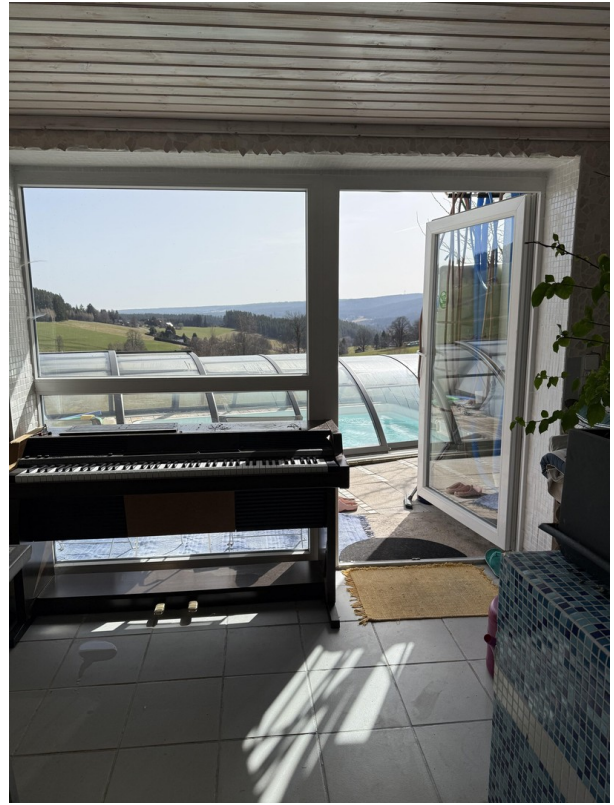
UG Blick von Wellness nach Süd