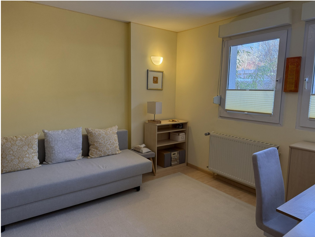
EG Büro / Gästezimmer