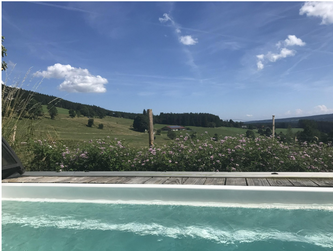
Training mit Schwimmgürtel