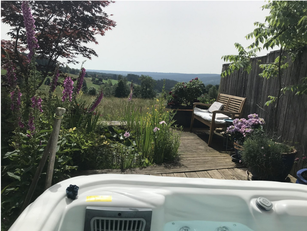
Sicht Whirlpool zu den Alpen