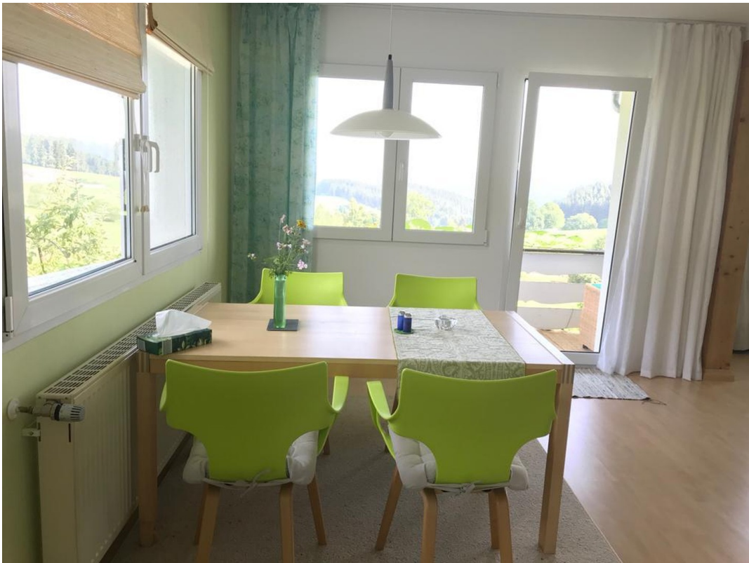
EG Essen und Balkon