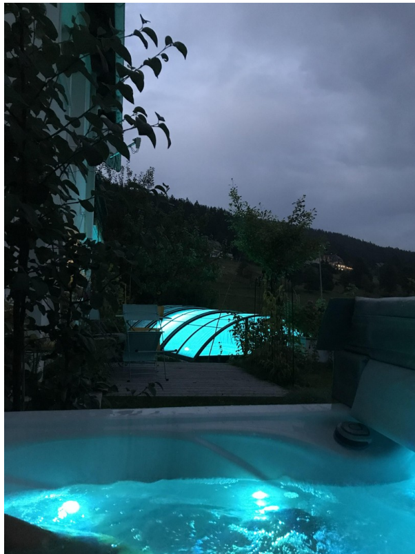
Wellness bei Nacht