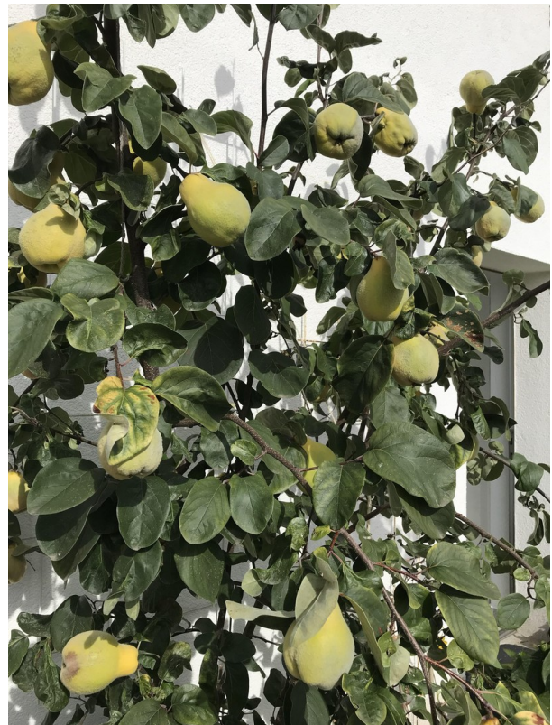
Garten: Quitten beim Whirlpool