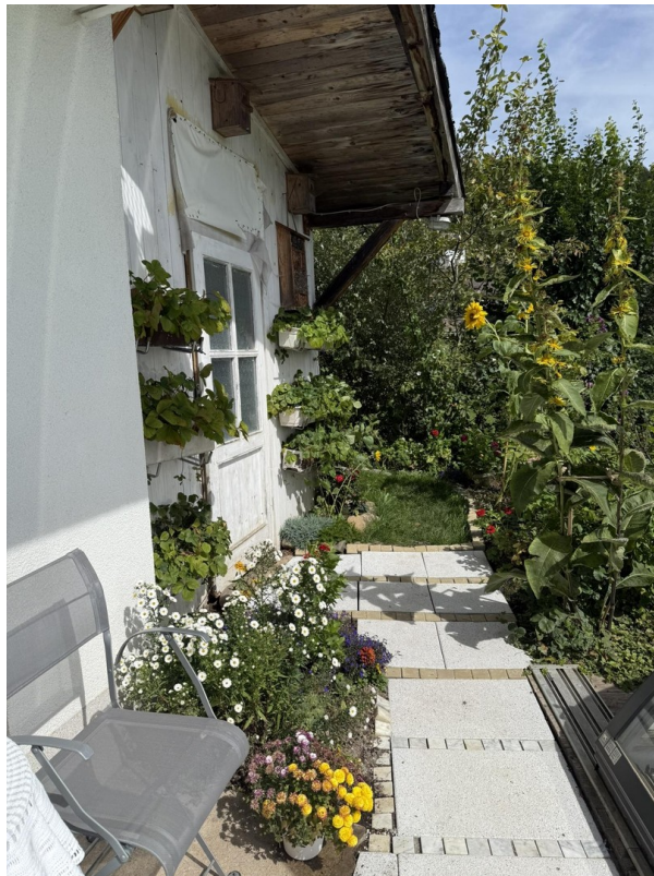
regengeschützt sitzen + Erdbee