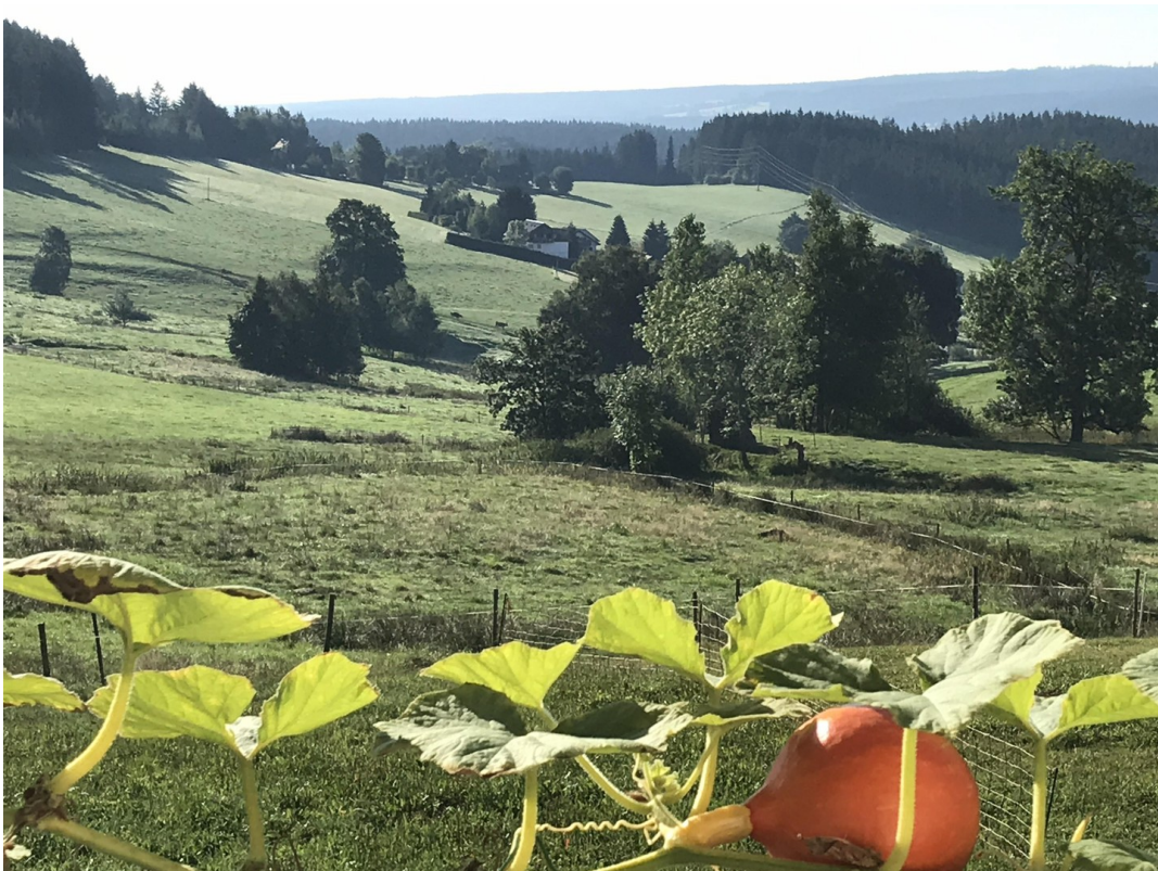
EG Hokkaido + Balkon nach Süde