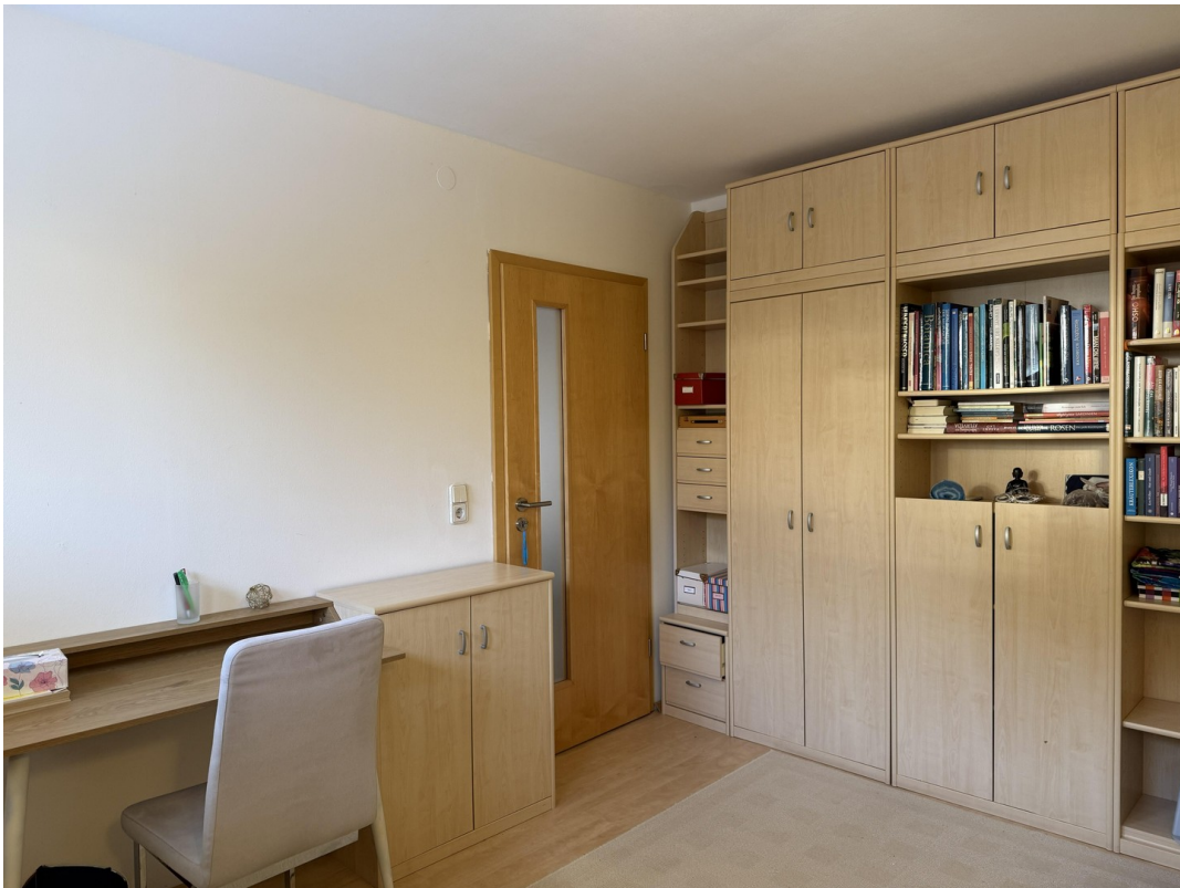
EG Büro / G.