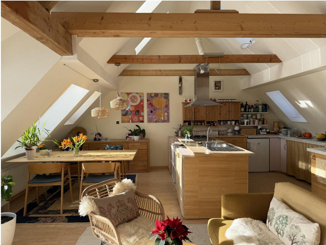
OG Küche / Essen / Wohnen