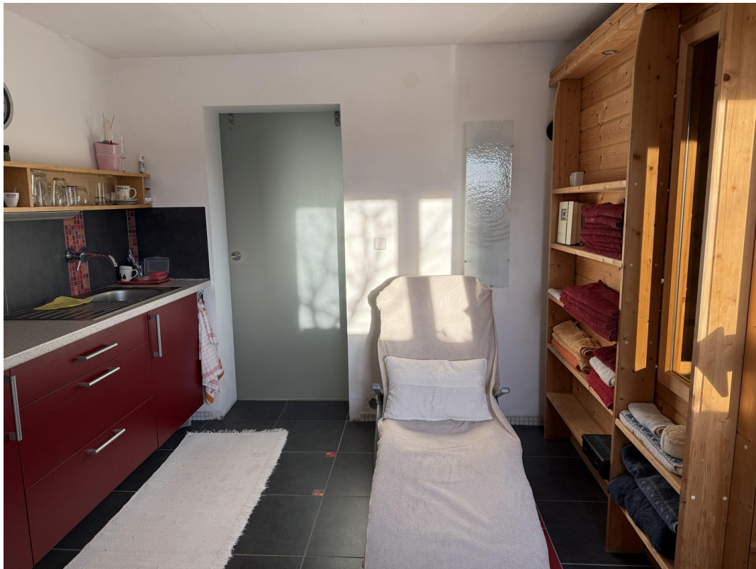
Teeküche + Sauna