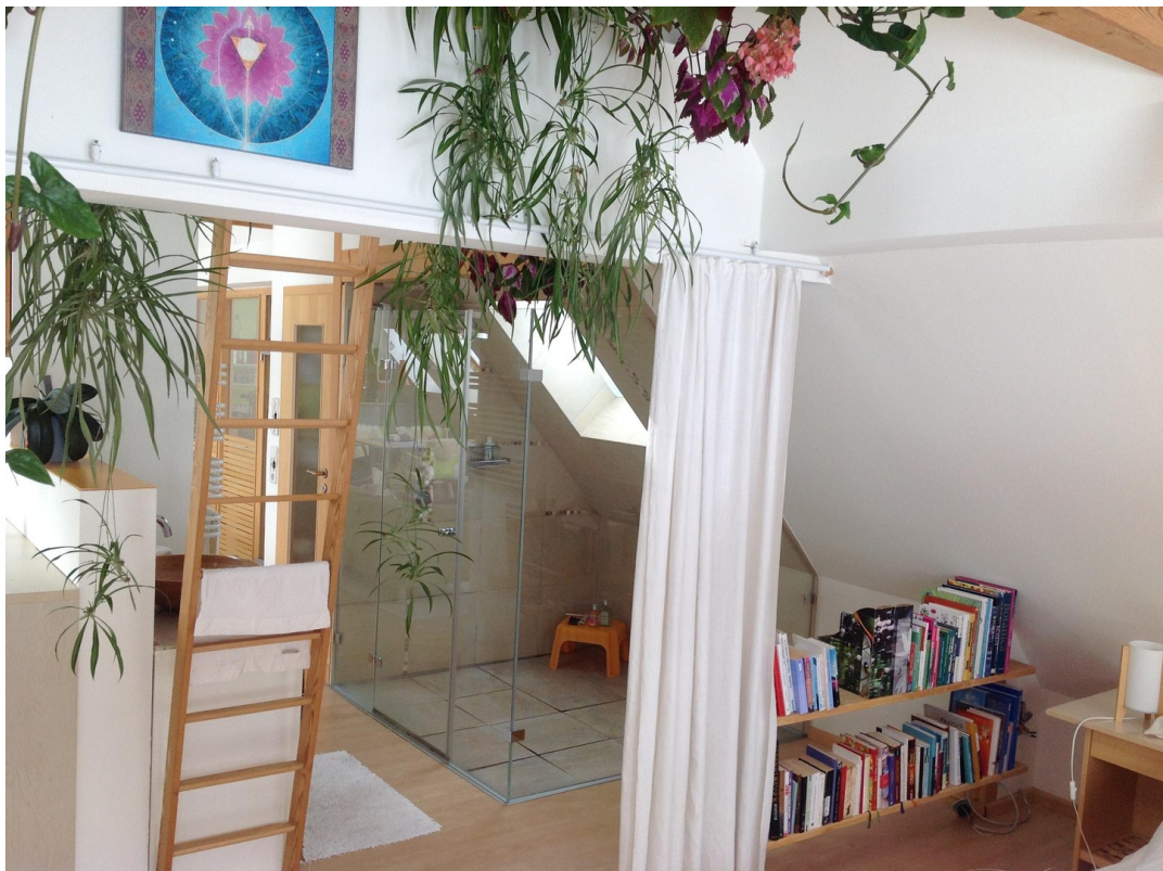
OG Dusche + Waschbecken