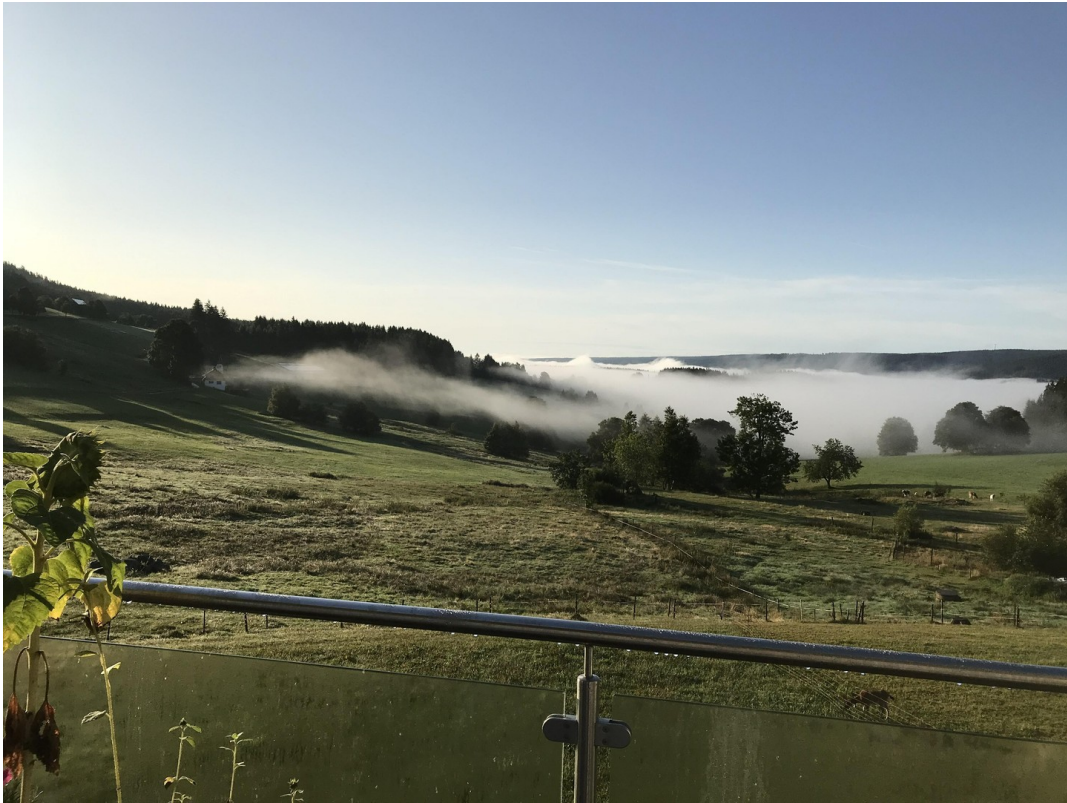
Blick nach Süden vom OG