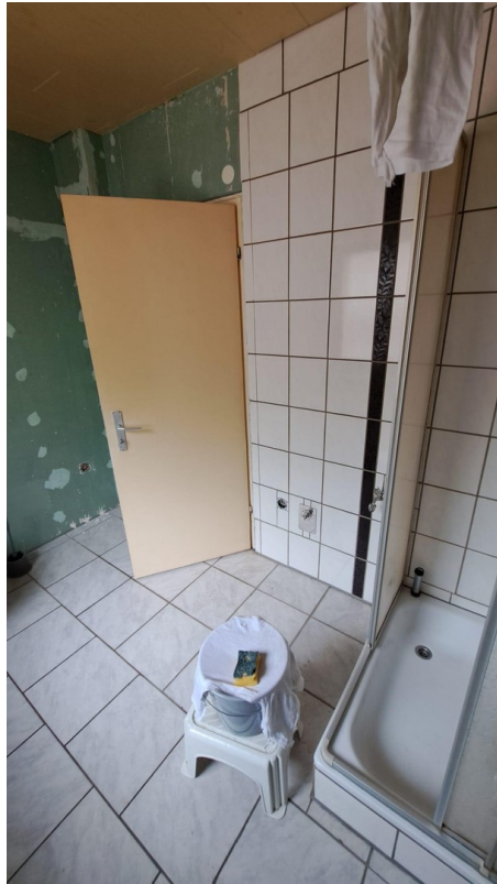
Bad Anschl. Waschmaschine