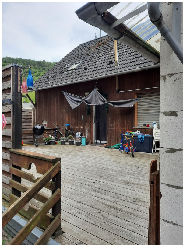
Eingang mit Terrasse