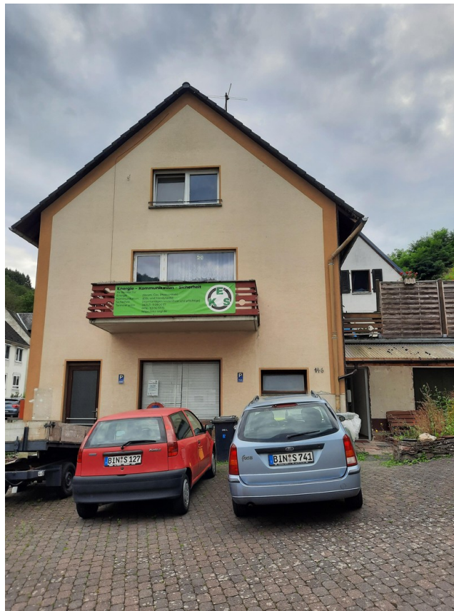
Hausansicht mit Balkon