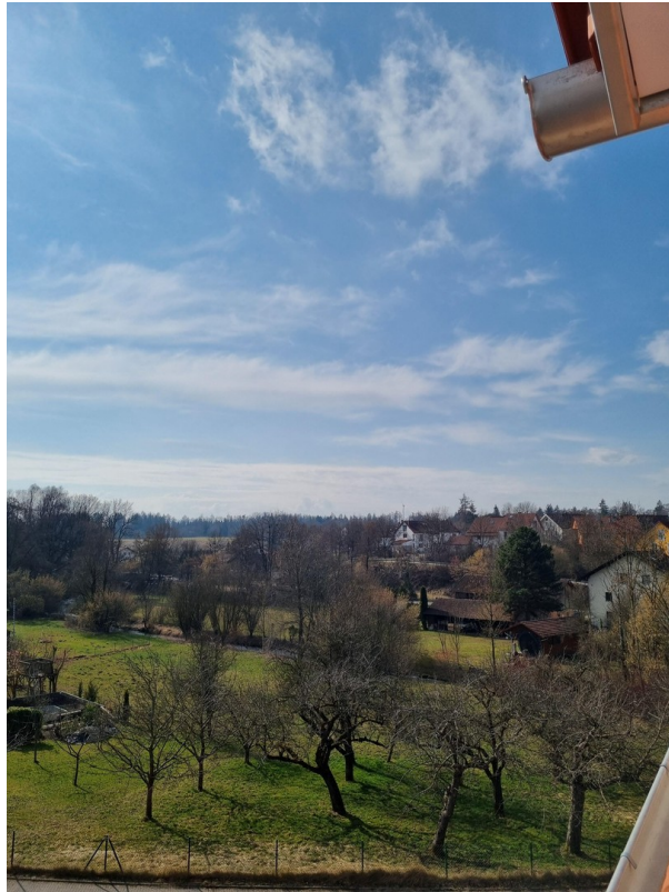
Blick auf kleinen Bach