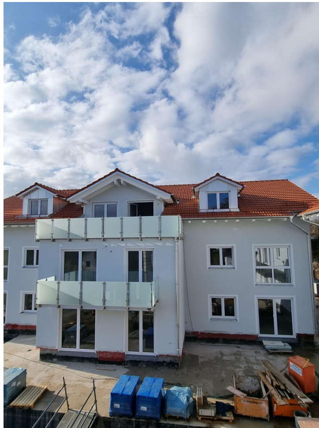
Blick in Tal und Berge