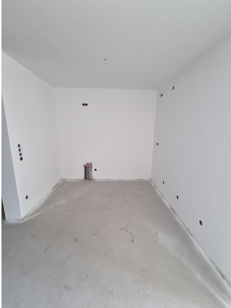
Küchenbereich derz. ohne Belag