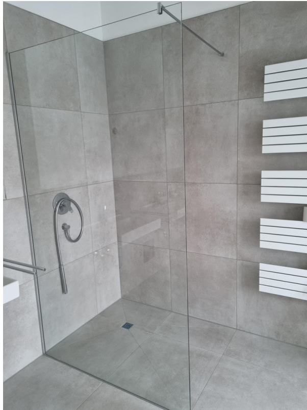
ebene Dusche m. Handtuchheizk.