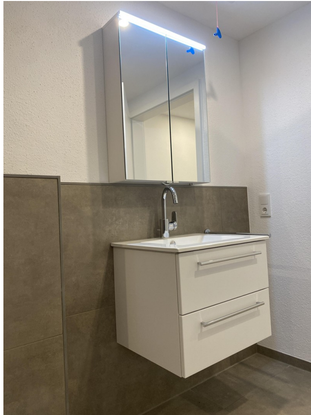
Waschbecken mit Spiegelschrank