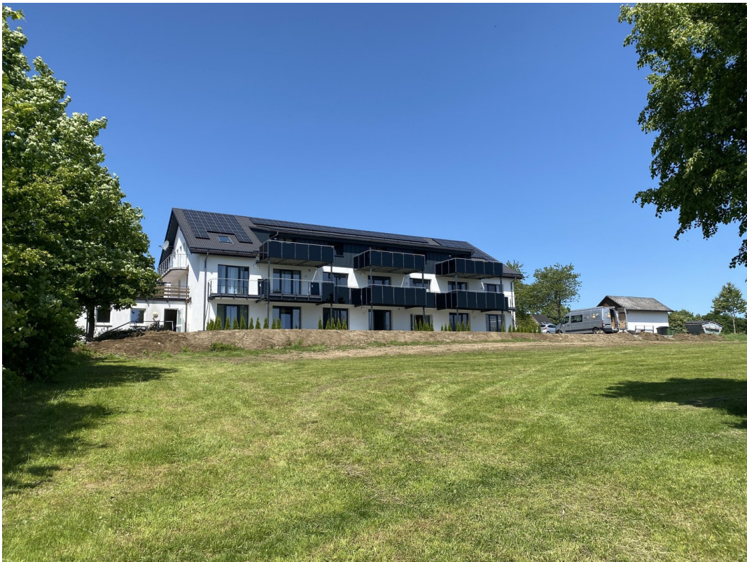
Hausansicht von unten