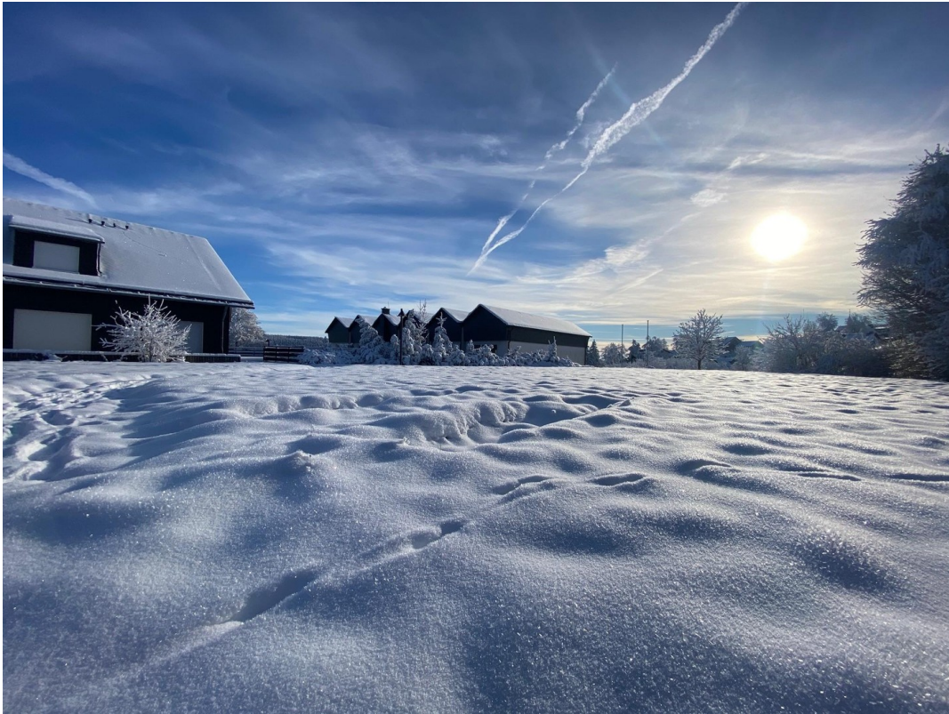
Winteraussicht oberhalb 2