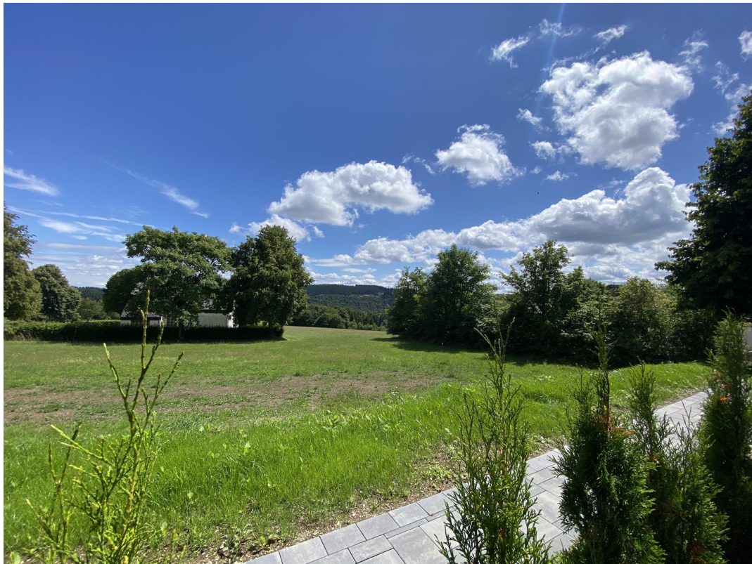
Blick nach unten