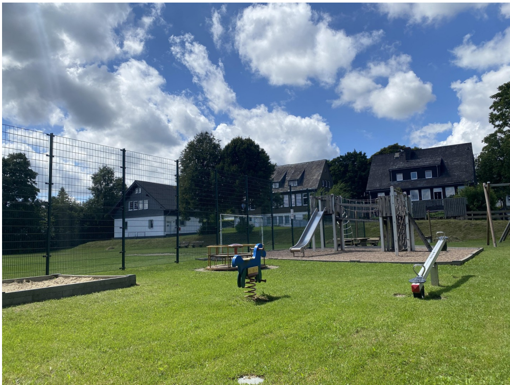
Spielplatz oberhalb des Hauses