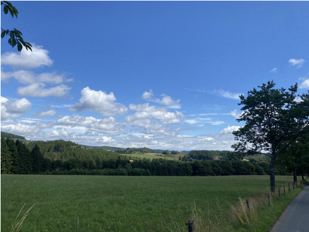
Blick seitlich 2