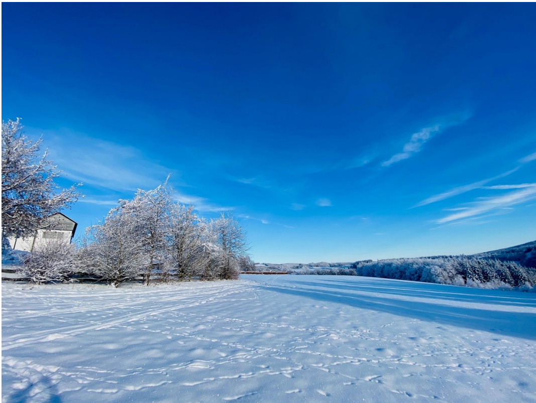
Winteraussicht unterhalb 2