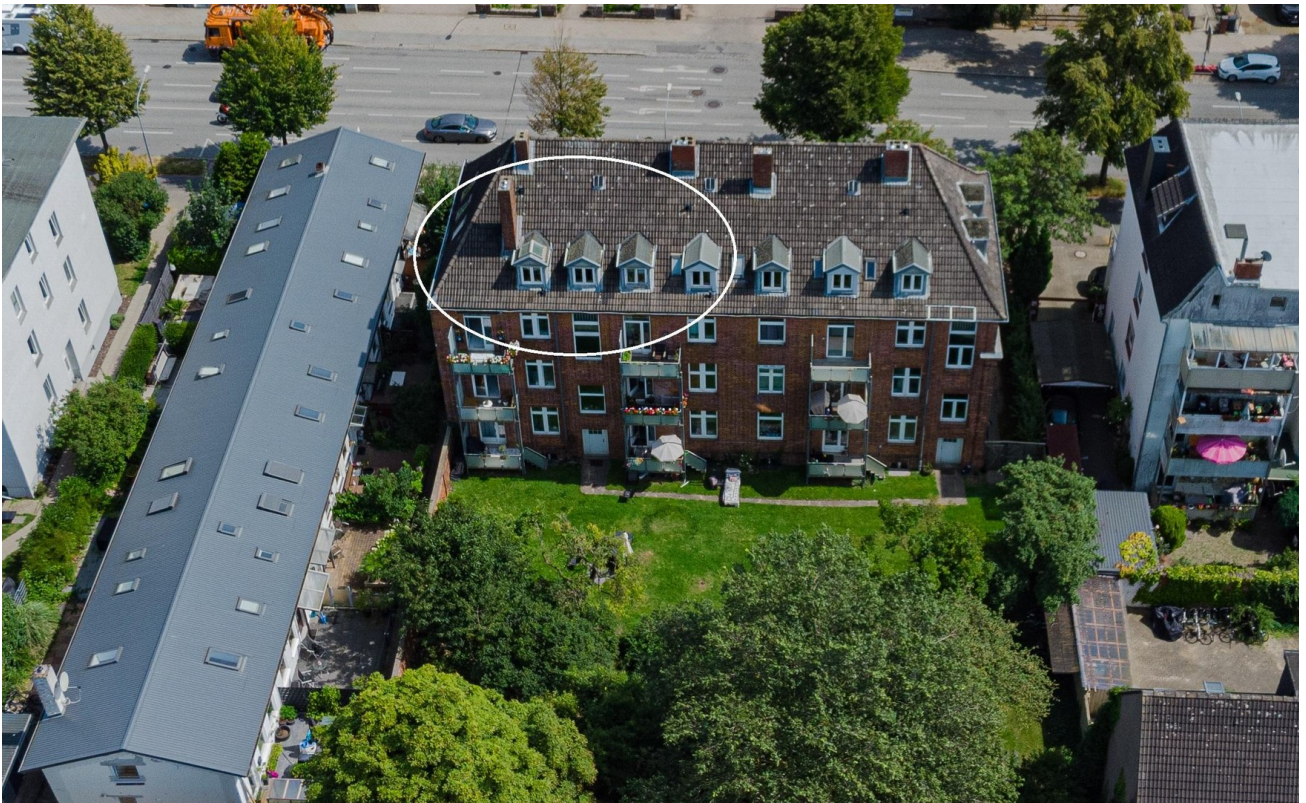
Luftbild mit Markierung