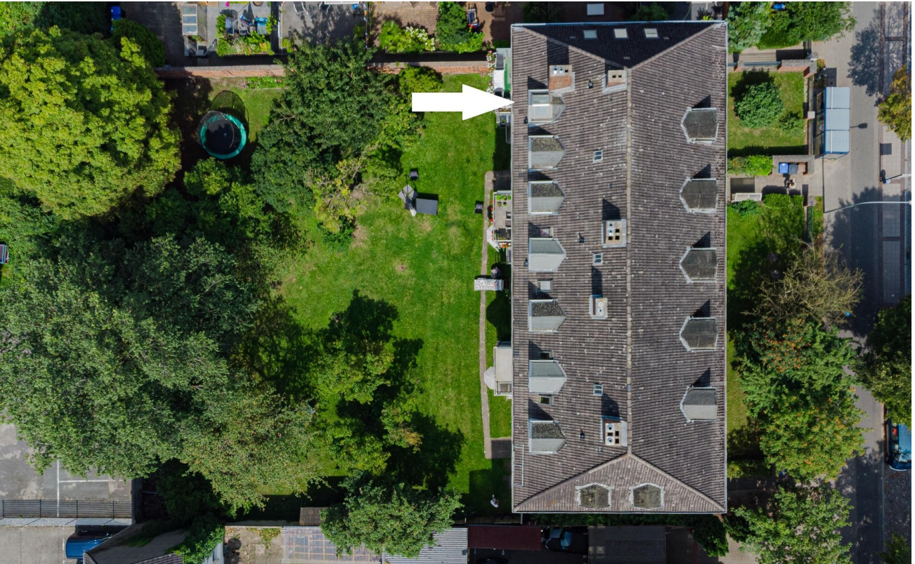
Luftbild mit Garten