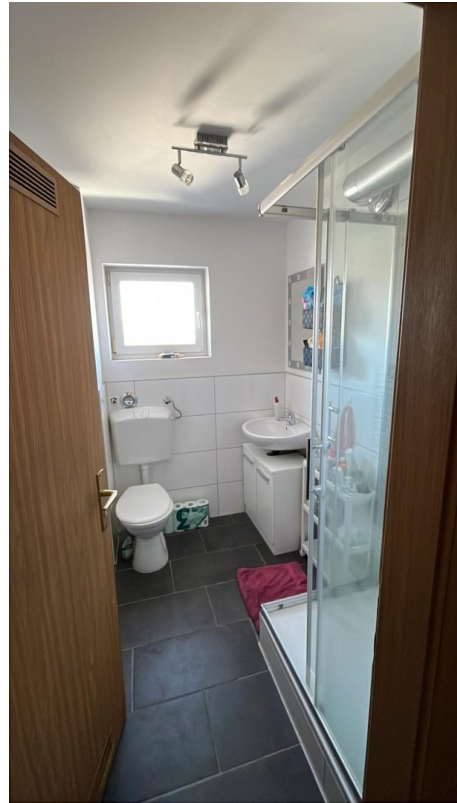
Tageslichtbad mit Dusche