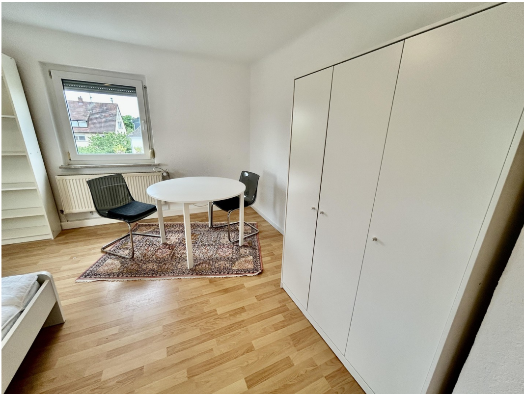
Sitzplatz am Fenster