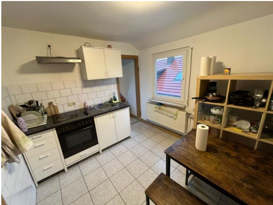
Neuer Herd und Backofen