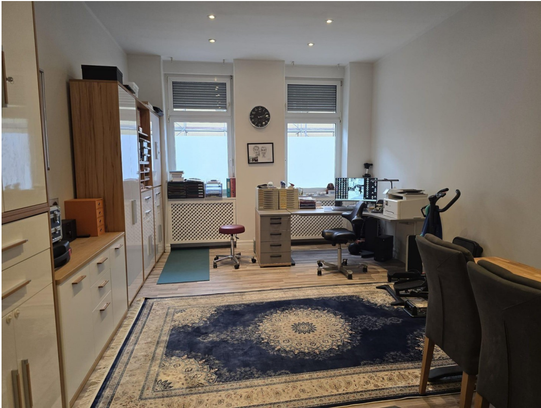
Büro/ggf. zusätz. Schlafzimmer