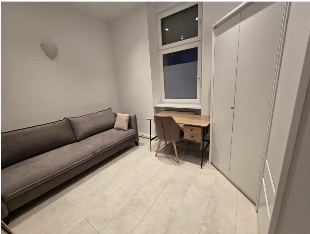
kleines Zimmer mit Schlafsofa