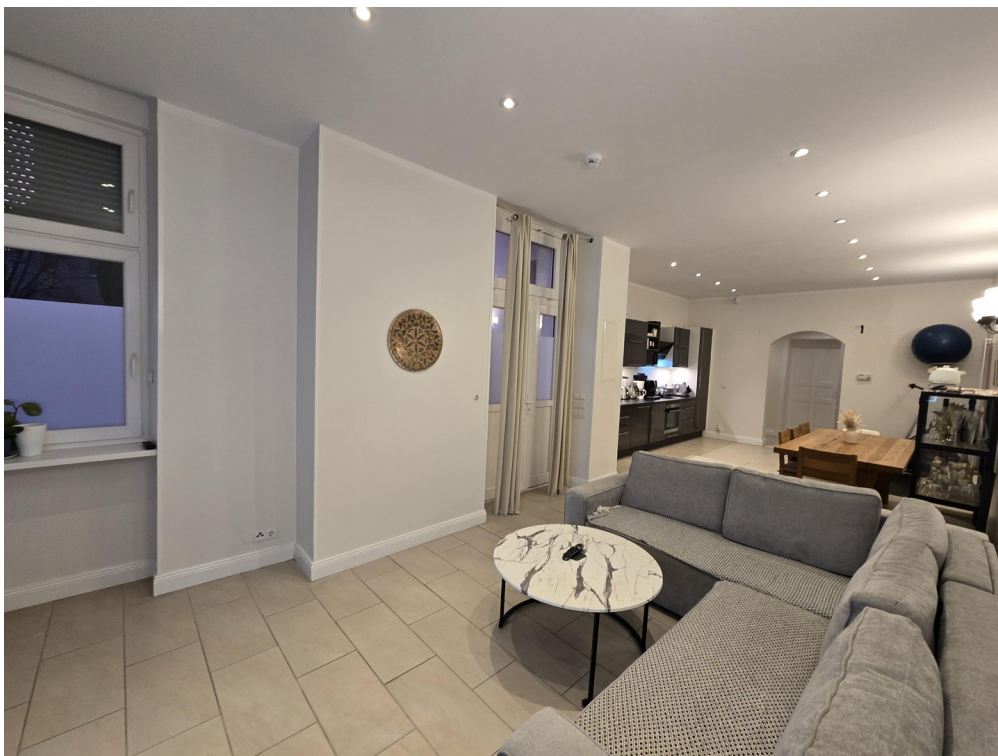
Zugang zum Gemeinschaftsgarten