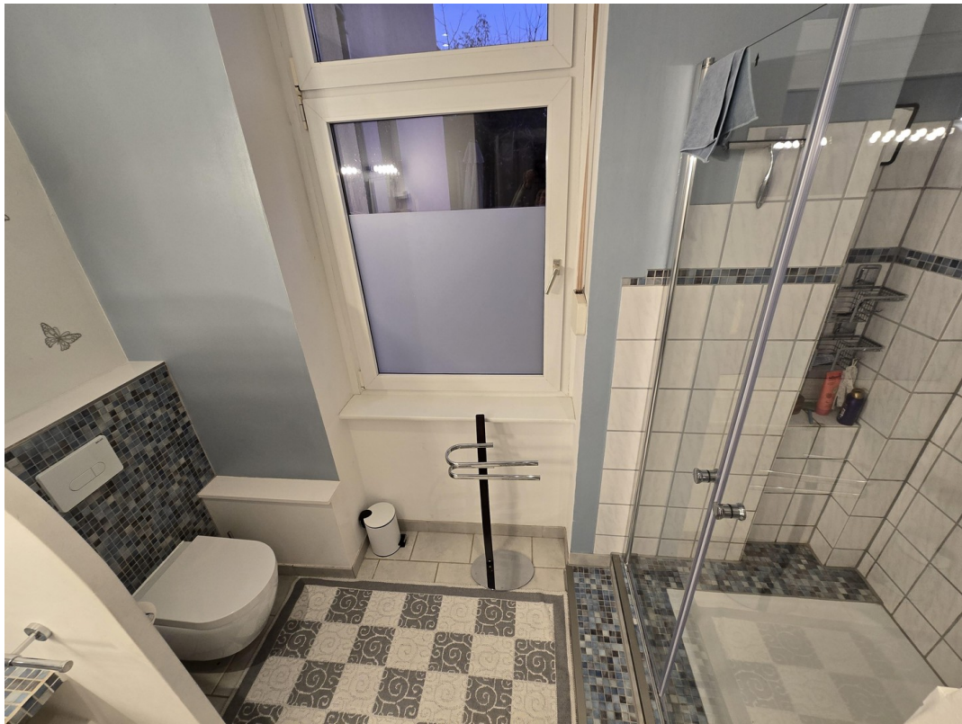
WC mit Bidetfunktion