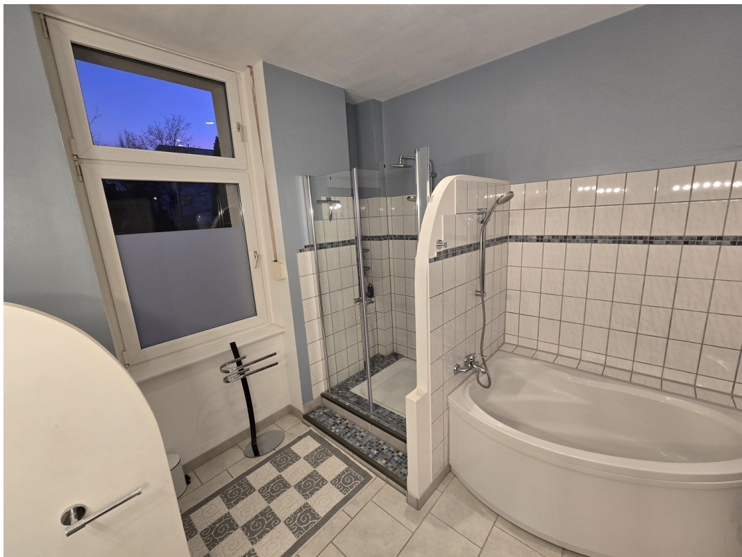
Dusche und Badewanne