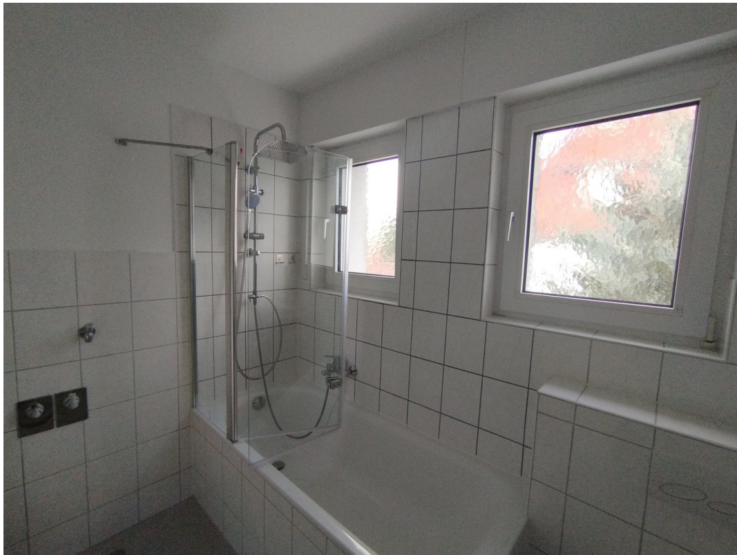
Badezimmer (Blick a. Dusche)