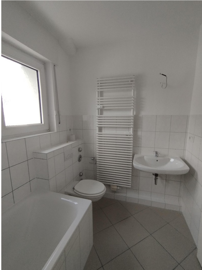
Bazimmer (Waschtisch, WC)