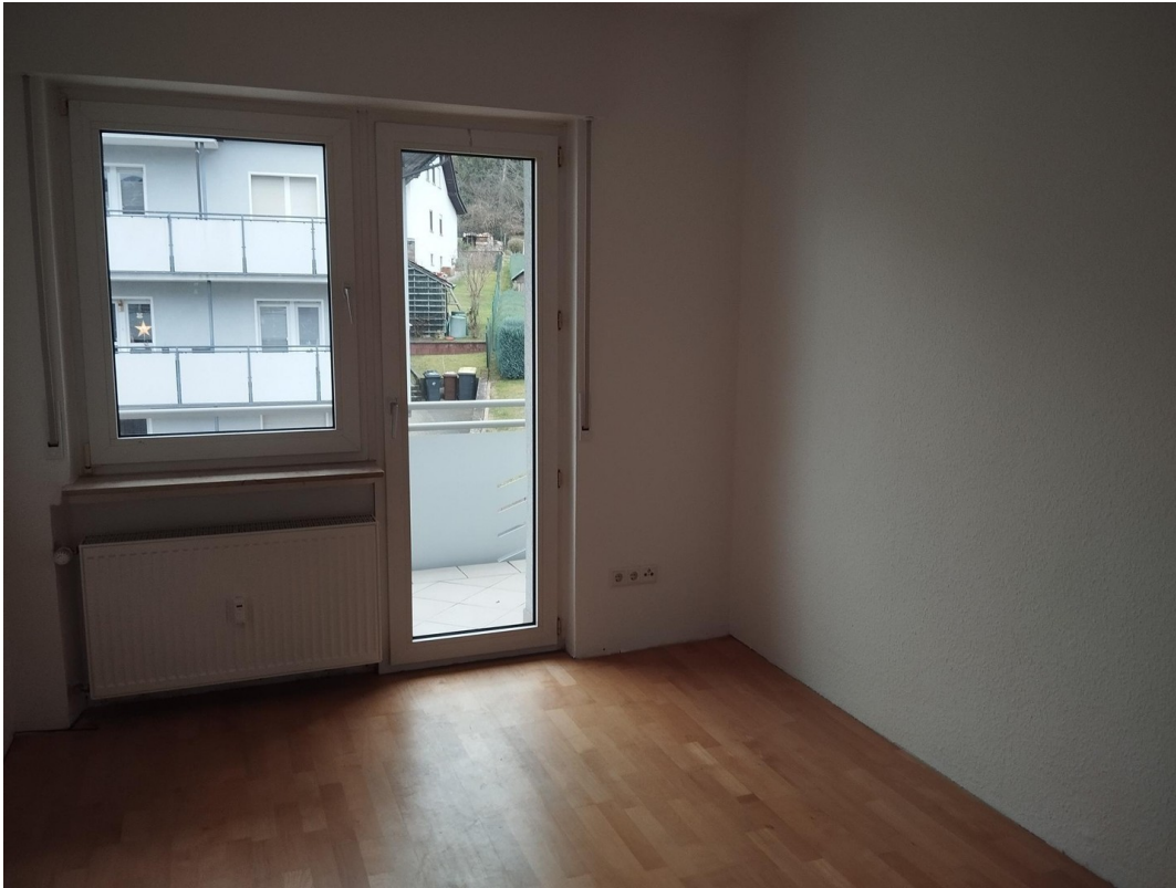
Schlafzimmer klein / Büro