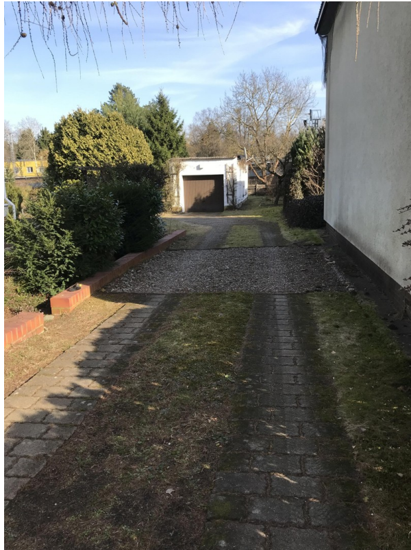
Geh-, Fahr- und Leitungsrecht