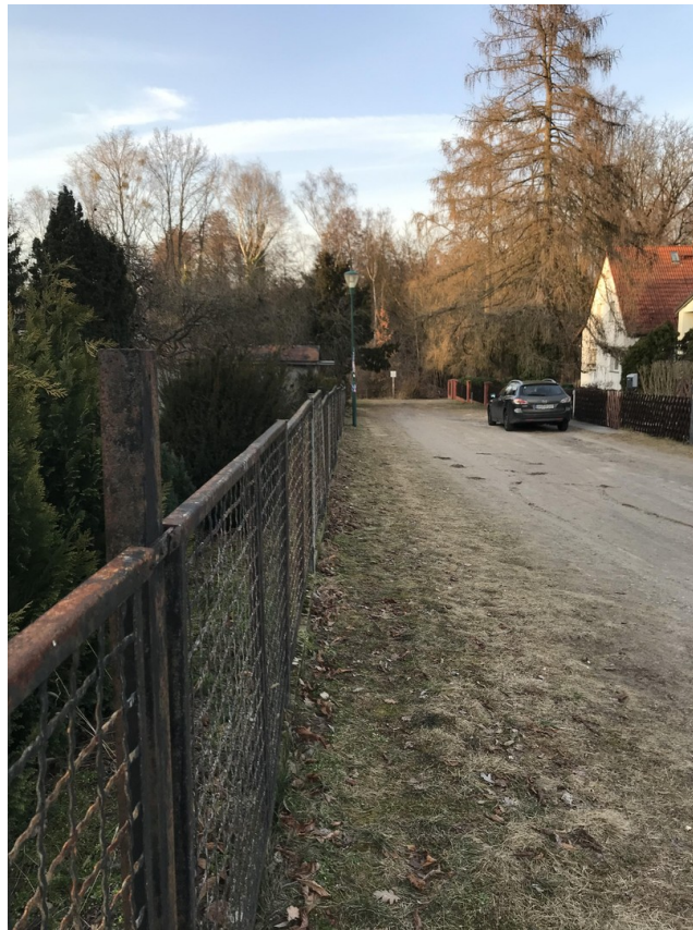
Umfeld mit Blick in Sackgasse