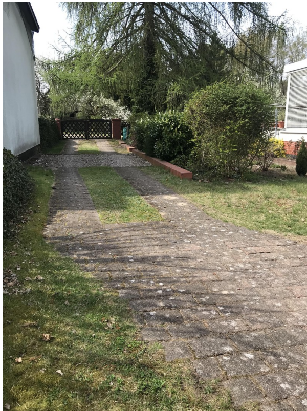
Fläche Zufahrt Richtung Straße