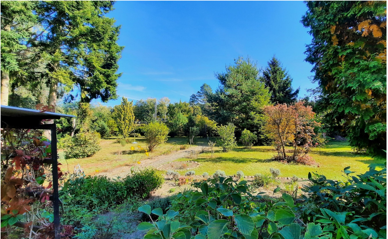
Blick nach Osten