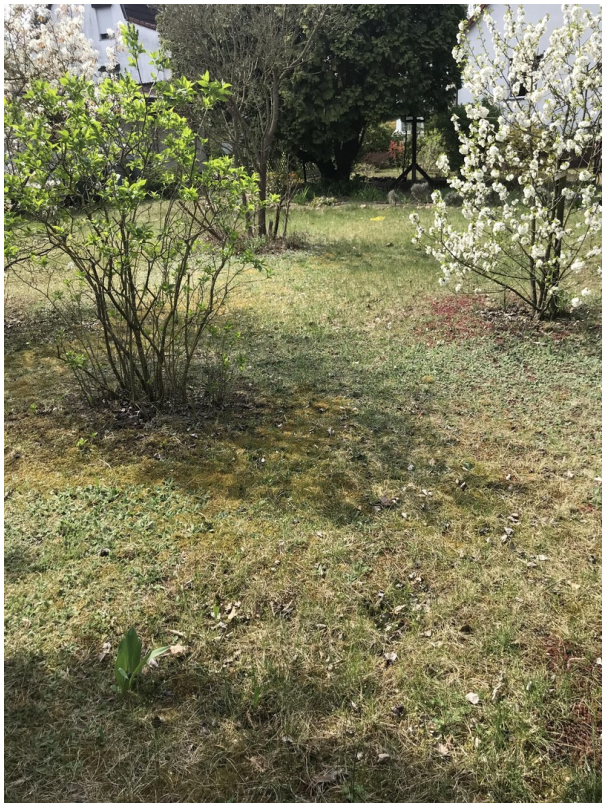
Frühling in Hohen Neuendorf