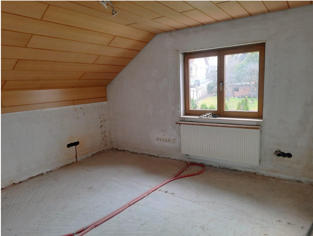
Schlafzimmer 3 OG