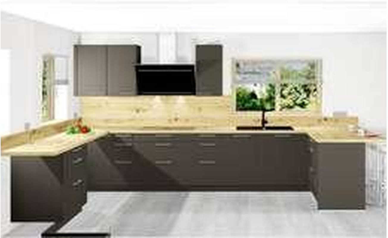
Einbauküche Plan 1