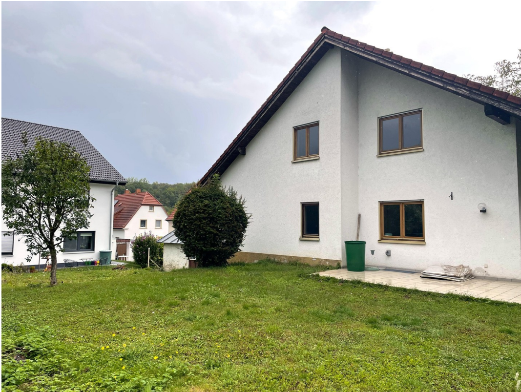
Außenansicht Rückseite / West