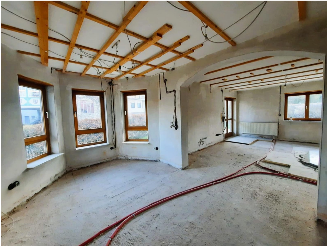
Esszimmer / Wohnzimmer EG