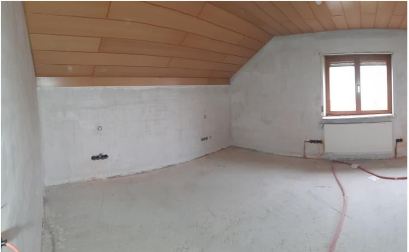
Schlafzimmer 1 OG