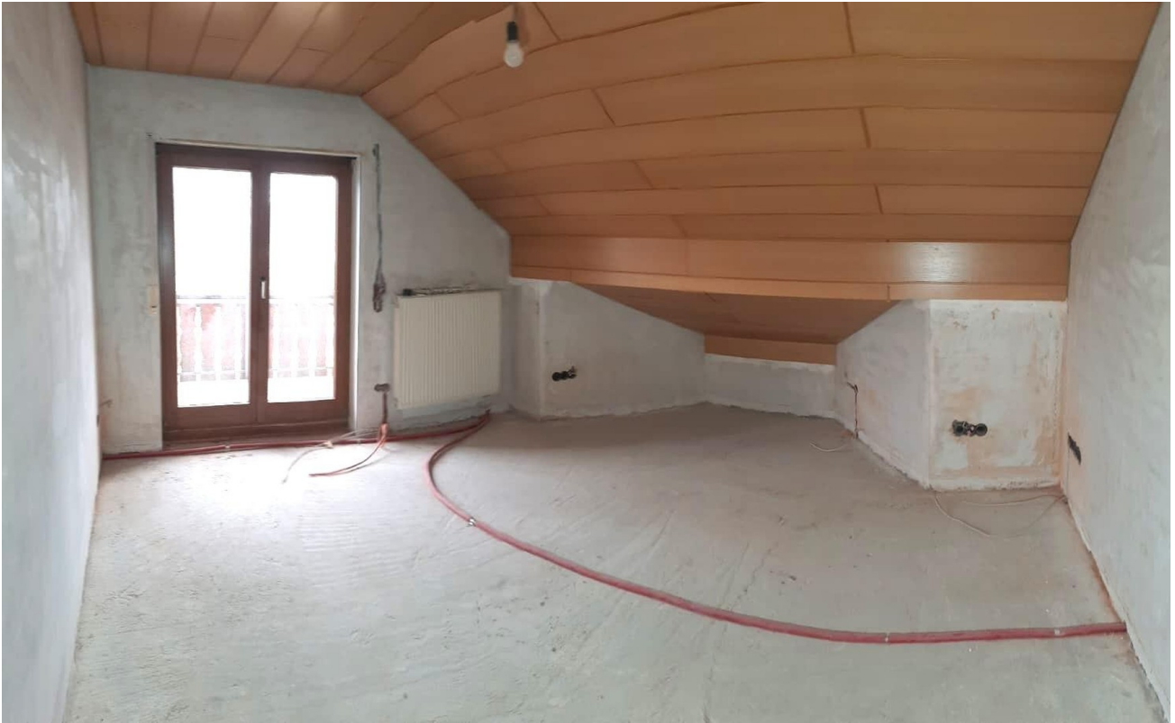
Schlafzimmer 2 OG