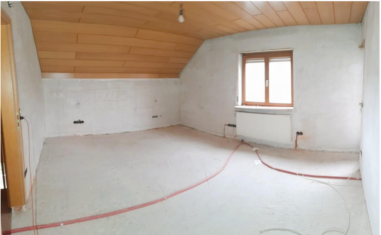
Schlafzimmer 3 OG