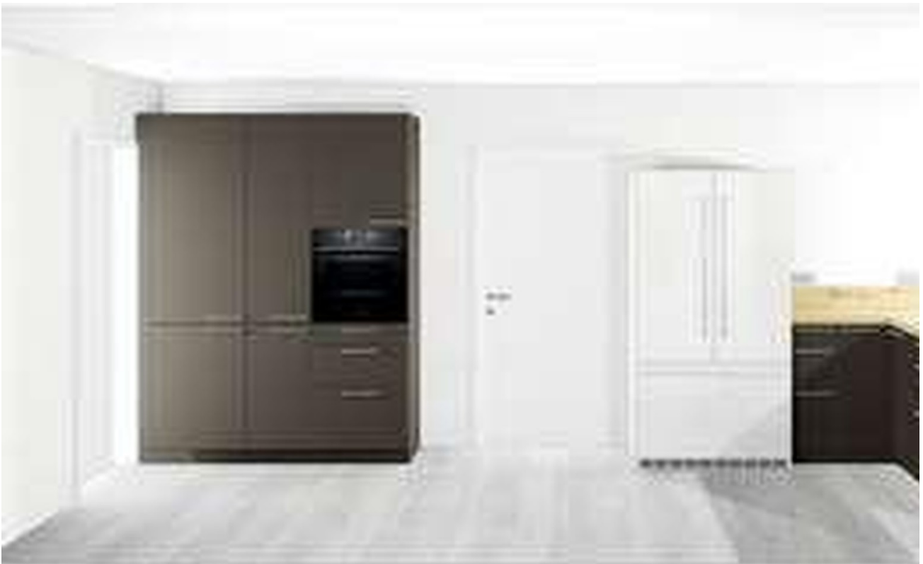
Einbauküche Plan 2