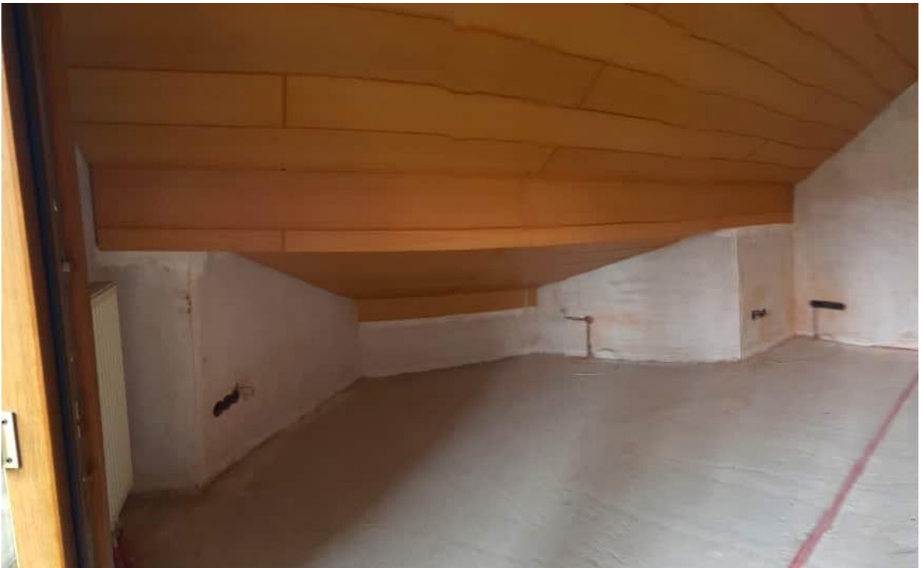
Schlafzimmer 2 OG