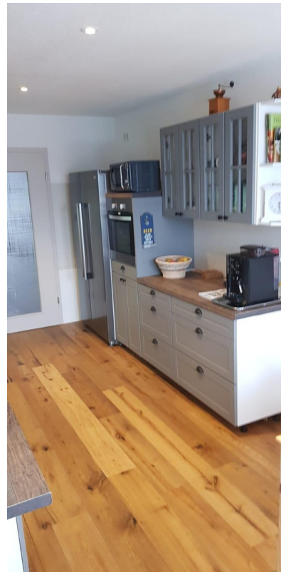
Einbauküche 2. OG