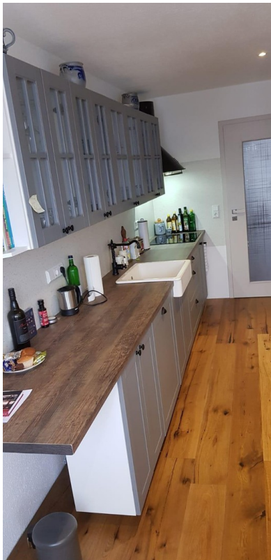
Einbauküche 2. OG