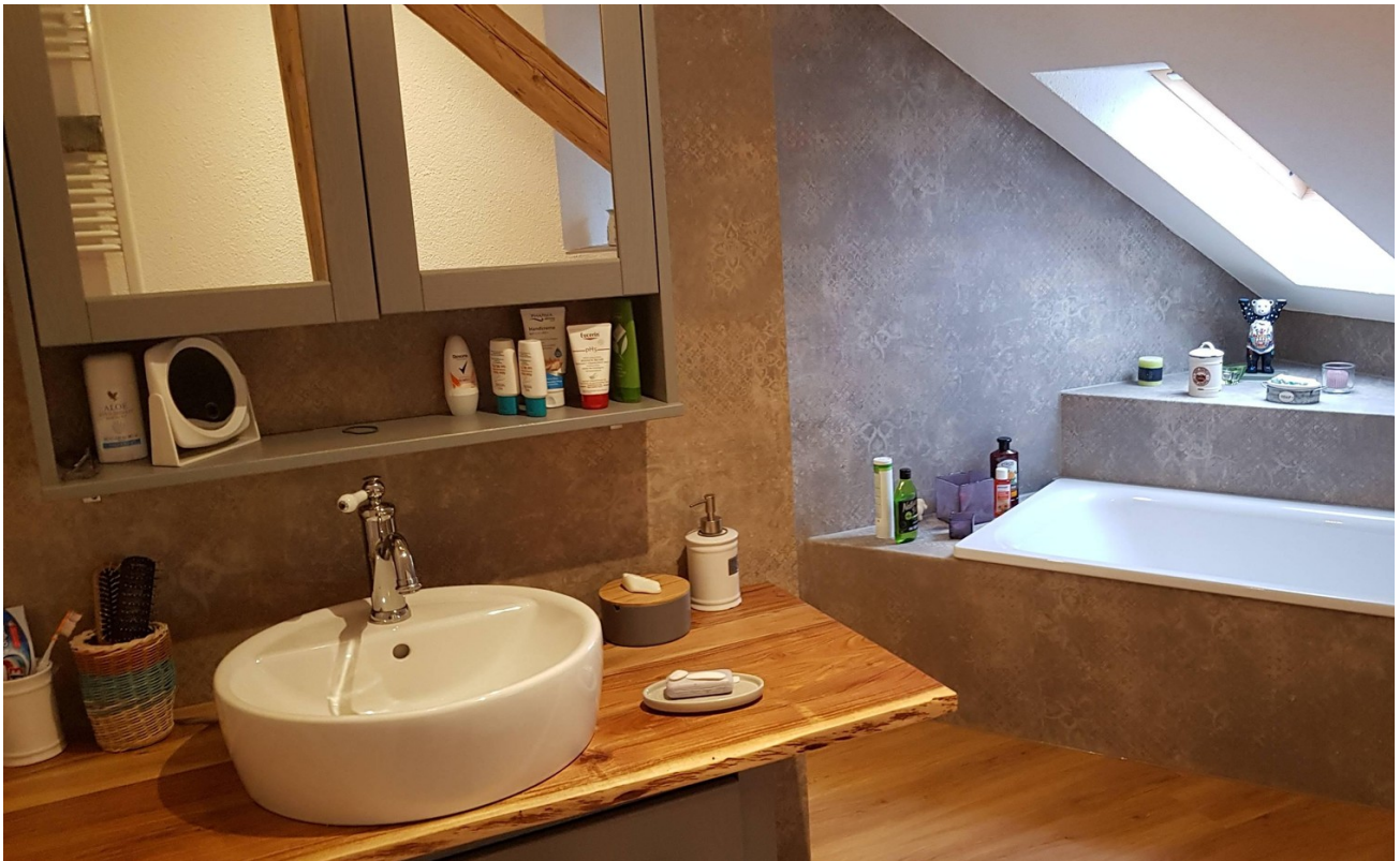
Badezimmer 2. OG