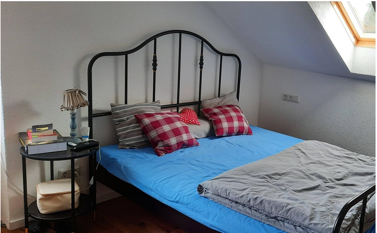
Schlafzimmer 2. OG