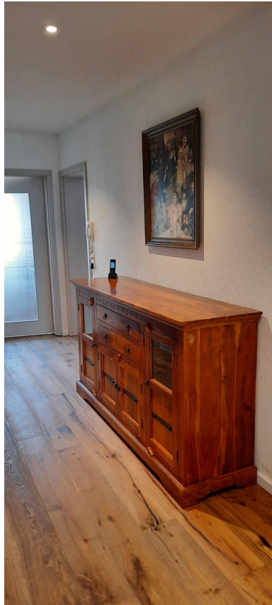
Flur 2. OG