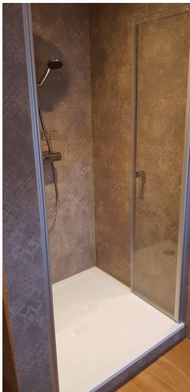
Dusche 2. OG