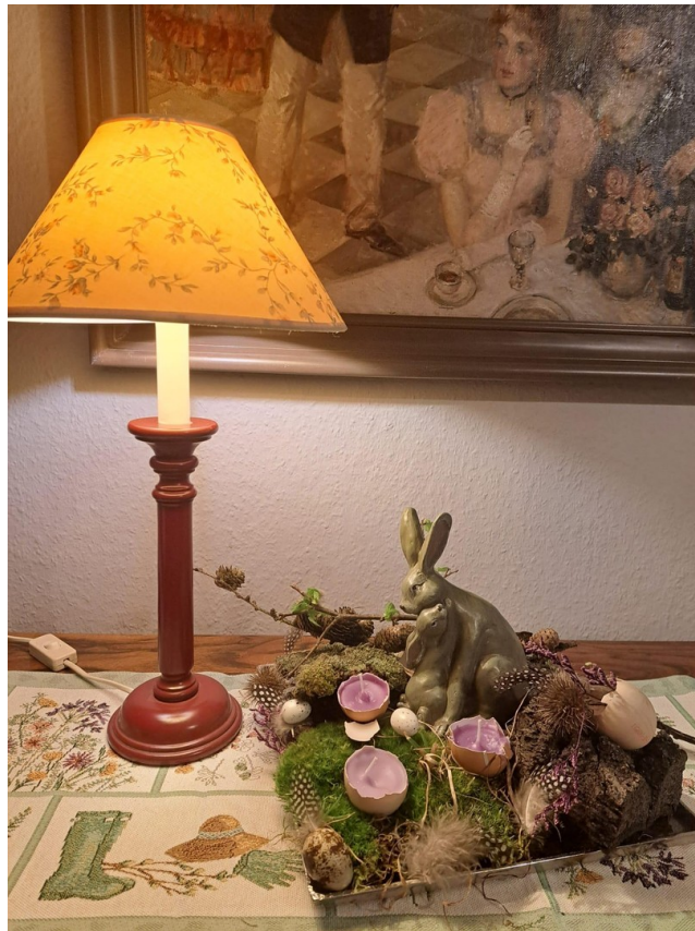
Arrangement im Flur