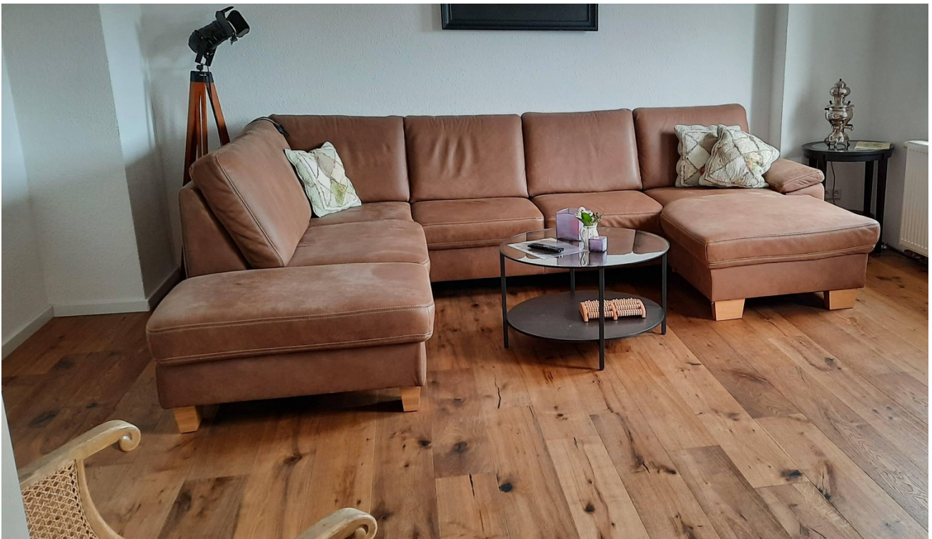
Wohnzimmer 2. OG